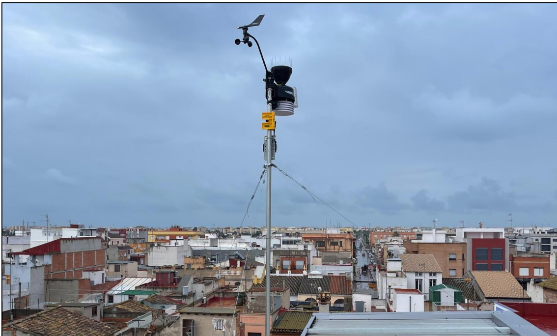
Figura 1. Estación meteorológica de Moncofa.

La estación meteorológica denominada Moncofa fue instalada el 25/11/2021 en el casco urbano de Moncofa (Castellón) y es propiedad del Ayuntamiento de Moncofa. La estación está situada en las coordenadas 39° 48' 25.91" N, 00° 08' 44.12" W y a una altitud de 6 msnm. Se trata de una estación meteorológica automática del modelo Davis Vantage Pro2, que cuenta con un pluviómetro manual de tipo CoCoRaHS/Stratus para corroborar la precipitación registrada en el pluviómetro automático.