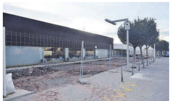
El nou espai esportiu s'està construint al costat de l'actual poliesportiu.

D'igual manera, el consistori ha traslladat la seua preocupació a la Subdelegació del Govern, tenint en compte els actes de vandalisme que s'han produït sobre l'embarcació. Des del municipi es vol prevenir qualsevol mal mediambiental que es poguera produir pel trencament o deterioració del casc del iot.