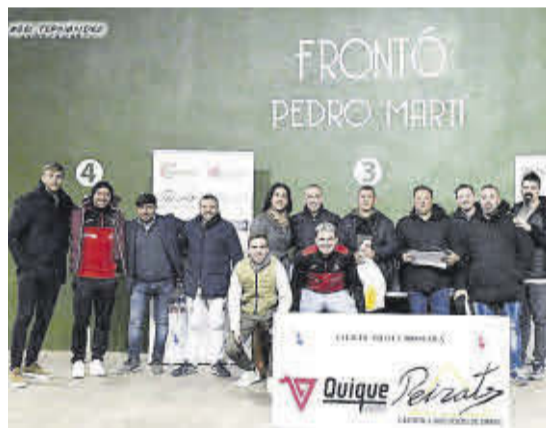
La categoría veteranos también tuvo un excelente podio.