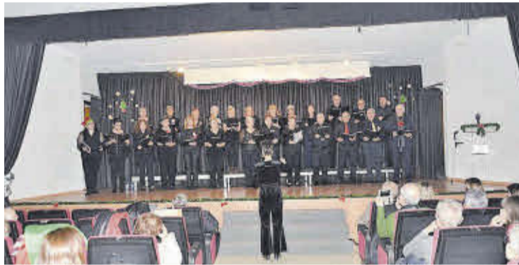
El coro Belcaire interpretó un repertorio de temas relacionados con la Navidad.