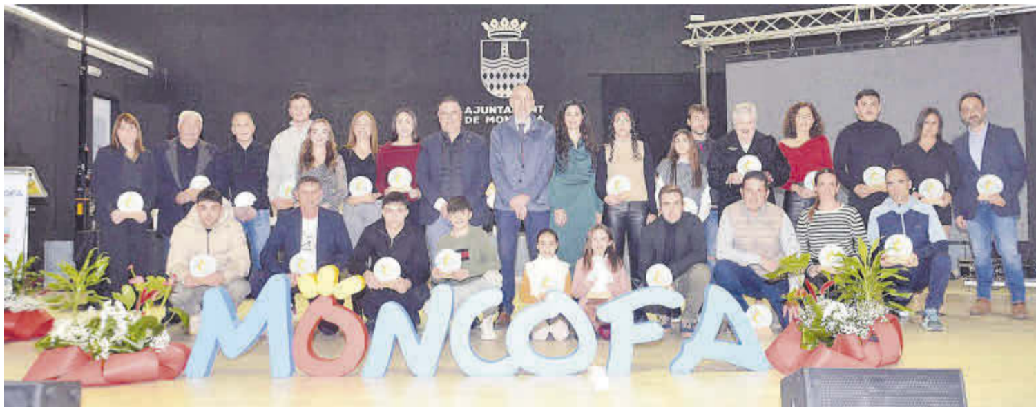
El edificio polifuncional fue el escenario elegido para la celebración de la IV Gala del Deporte de Moncofa, que premió los resultados obtenidos durante 2024.

La Gala del Deporte también sirvió para hacer entrega de los