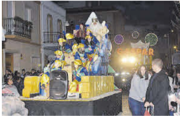
El público llenó el recorrido de la Cabalgata de los Reyes Magos.

El último acto multitudinario de las fiestas de Navidad fue la Cabalgata de los Reyes Magos. El esperado evento contó con la