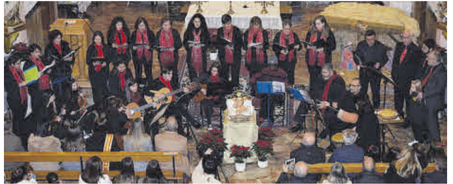
La iglesia parroquial se quedó pequeña para albergar al público del concierto del coro parroquial.