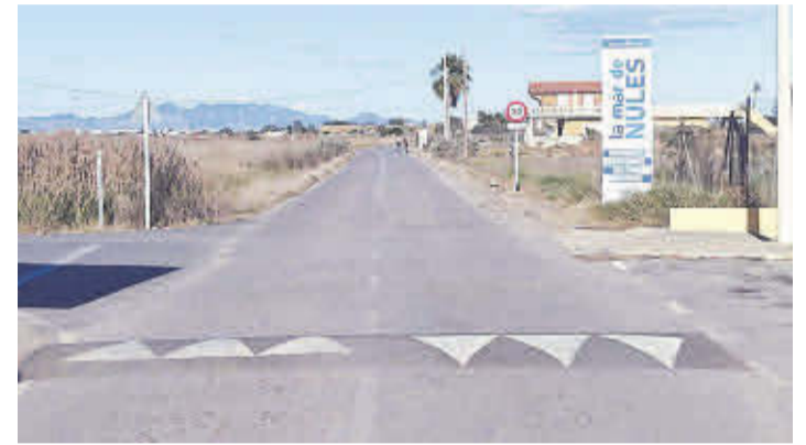
La passarel·la de ciclovianants passarà de Nules a la platja de l'Estanyol.

L'Ajuntament de Moncofa, en la seua aposta per millorar les infraestructures del municipi, ha començat a treballar en una sol·licitud per a captar fons europeus. Es tracta d'una acció conjunta amb el consistori de Nules amb la qual ambdues localitats podrien rebre uns 10 milions d'euros.