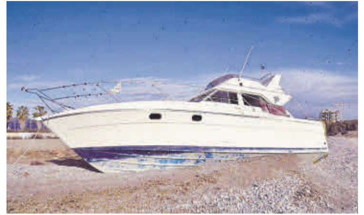
Estat en què es troba actualment l'embarcació a la platja Belcaire de Moncofa.

«L'aposta de l'equip de govern és posar les condicions idònies perquè l'activitat industrial també siga un focus de generació d'ocupació dins de l'economia local», adverteix l'edil i afegix que «volem agrair a l'Ivace pel suport econòmic», conclou el primer tinent d'alcalde de Moncofa.