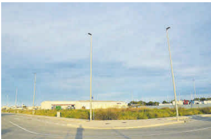
El polígon Riuert s'ha convertit en un espai més modern, segur i funcional.

L'Ajuntament de Moncofa ha culminat les obres de millora del polígon industrial Riuert, un projecte la inversió total del qual ascendeix als 113.700 euros i que s'ha dut a terme gràcies a la subvenció de 61.930 euros atorgada per l'Institut