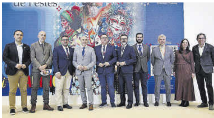
Alós, junto al director general de Turismo y el secretario autonómico de Turismo.

en los años 70 logró cautivar a los veraneantes, a la vez que generaba un sentimiento de orgullo entre los residentes. Esta imagen fue recuperada por la corporación en la pasada edición de Fitur coincidiendo con