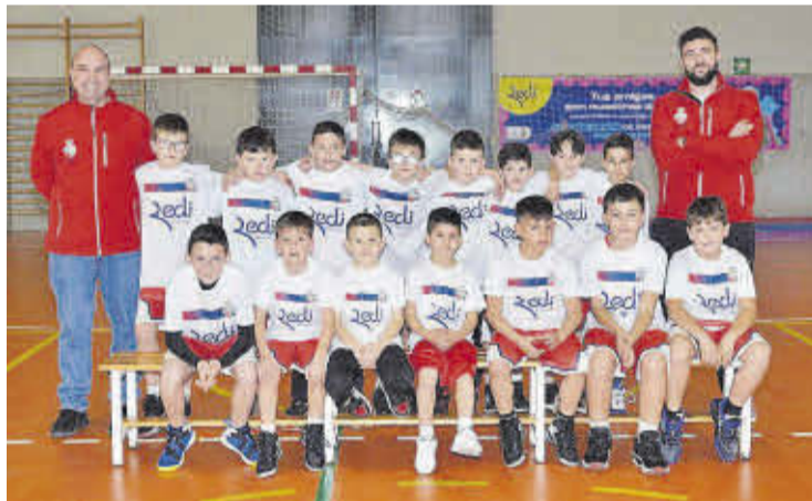
Collado y Segarra están al frente de las categorías benjamín y prebenjamín.