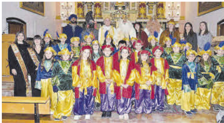
Los Reyes Magos de Oriente, acompañados por los niños y las jóvenes festeras.

presencia de decenas de vecinos y visitantes, dispuestos a disfrutar de un animado recorrido, en el que los protagonistas fueron Sus Majestades de Oriente. Estos estuvieron acompañados tanto por las jóvenes que forman parte de la corte de honor de las fiestas patronales, como por el nutrido grupo de niños y niñas que en unos meses recibirán la Primera Comunión.