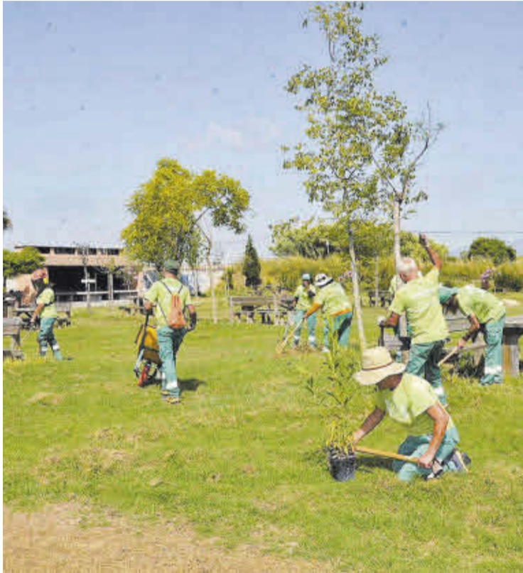
Els treballs a desenvolupar en estos tallers se centraran en jardineria i obres.

L'objectiu és fomentar l'ocupabilitat de persones en situació de vulnerabilitat o amb dificultats