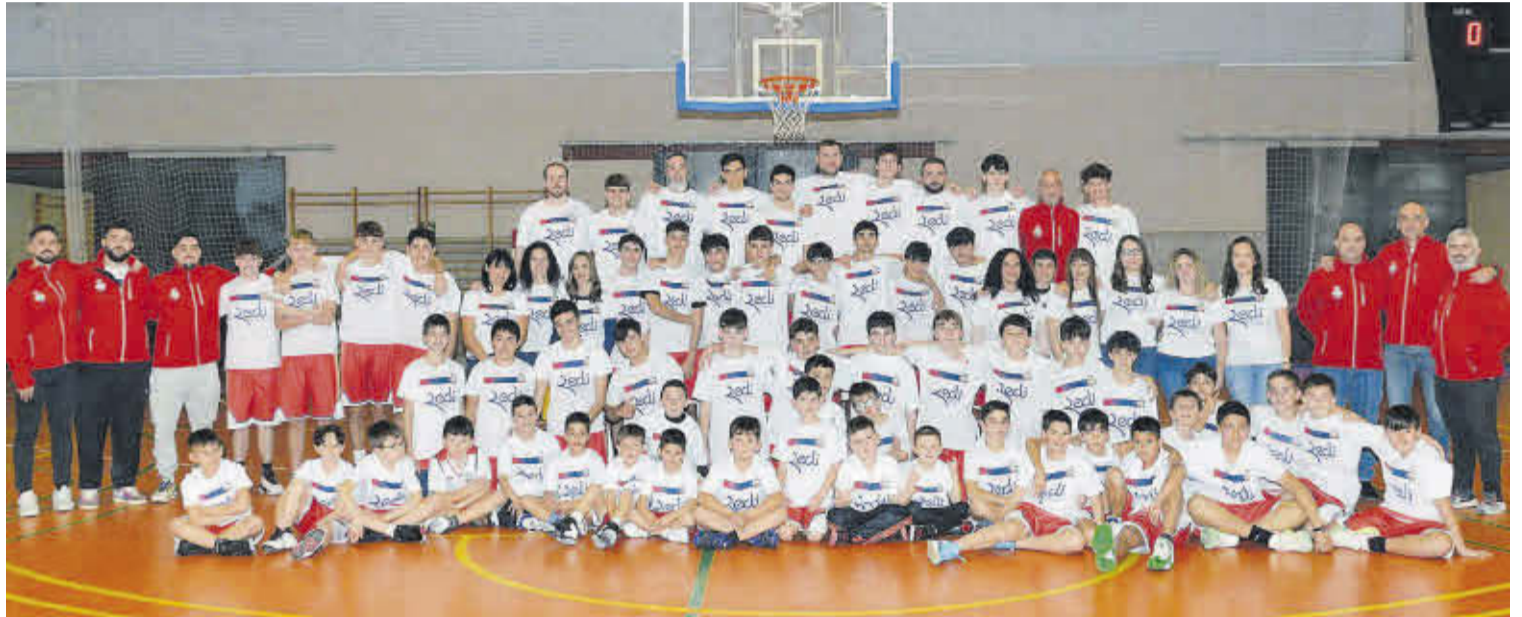
Los jugadores que conforman las distintas categorías del CB Moncofa, junto a los entrenadores, la junta directiva y las integrantes de la categoría femenina.