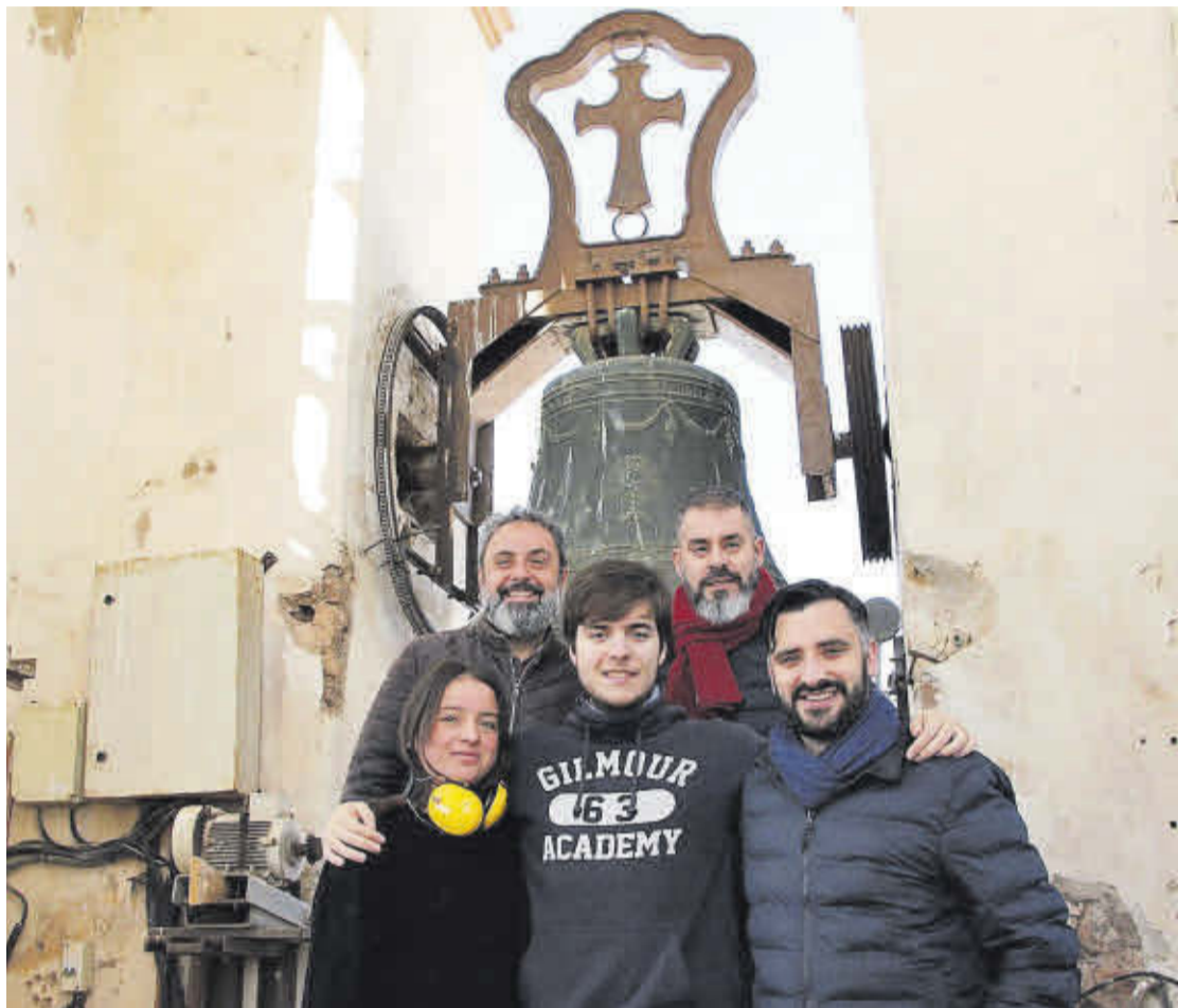
Campaneros venidos de Eslida, Alфондегуilla y la Vall d'Uixó se encargaron del toque manual de las campanas.

El campanero explicó que, como es habitual, el día anterior a la actuación «revisamos todos los mecanismos, desconectamos todos los motores para dejar a las campanas libres y realizar