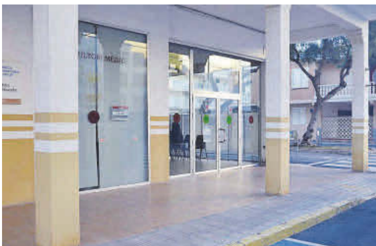
El consultori de la platja donarà servei mentres duren les obres d'ampliació.

El consultori mèdic de la platja de Moncofa ja està obert perquè les obres d'ampliació del centre de salut començaran de manera imminent. Així, s'ha traslladat de manera temporal l'atenció per a la població maternoinfantil i treballadora social al centre auxiliar situat al carrer Almirall Cervera.