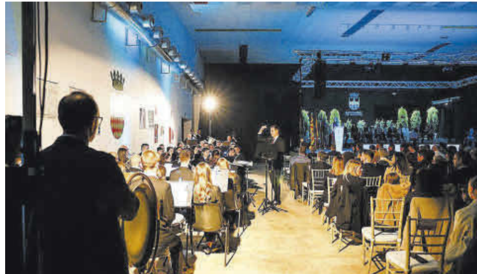
Los integrantes de la SUM Santa Cecilia fueron los encargados de ambientar la gala.