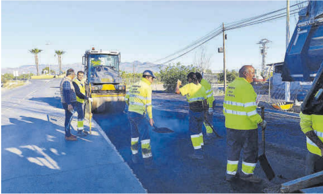
Les àrees del consistori treballen per a dur a terme l'objectiu de resoldre totes les incidències i queixes dels ciutadans.