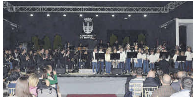
La SUM Santa Cecilia llevó a cabo el concierto extraordinario navideño.