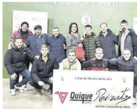
Podio de la categoría segunda A, junto a miembros del club.