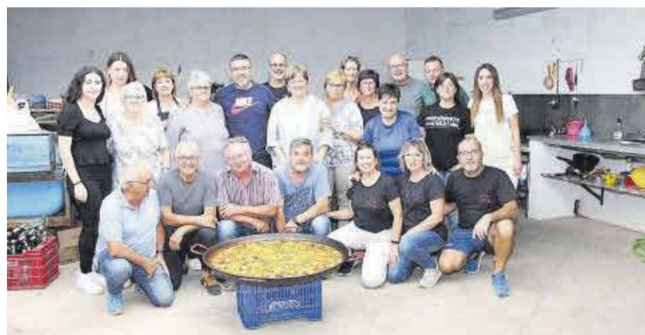
La Colla Festes és un exemple de com viuen les penyes aquesta setmana en el seu propi casal festiu.