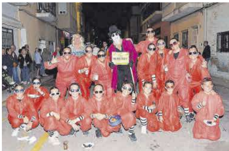
Les disfresses varen fer gaudir a tot el públic present en el recorregut marcat.