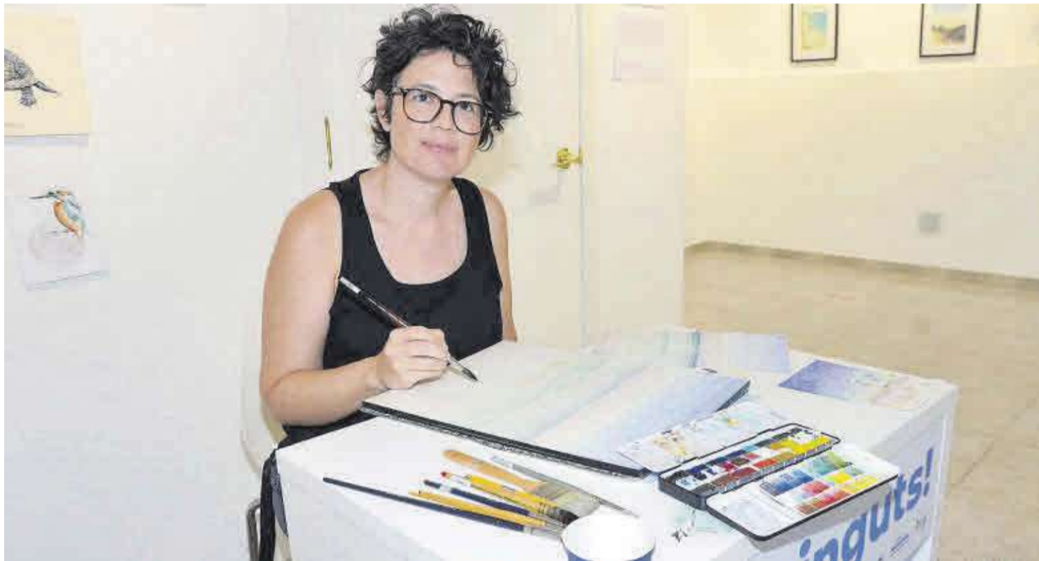
La ilustradora de Moncofa tuvo la idea de ir plasmando dibujos de las imágenes que ofrece el mar Mediterráneo mientras estuvo exponiendo en la sala Pleamar.

Y a través de la observación y el dibujo gráfico y la acuarela se disfruta y se remarca «el patrimonio natural mediterráneo y se redescubre lo que es común y cotidiano, dejando que nos sorprenda y nos cautive con sus texturas y patrones», expresa la