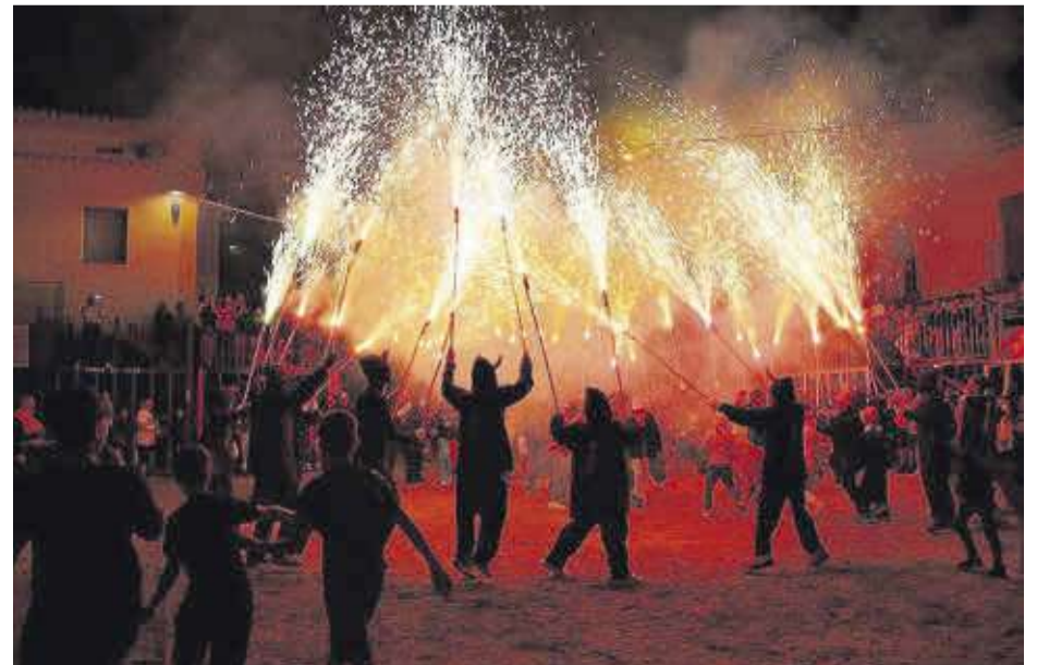
Els Dimonis de Foc de Nules amb el seu espectacle van deixar el seu segell i van fer gaudir als veïns.