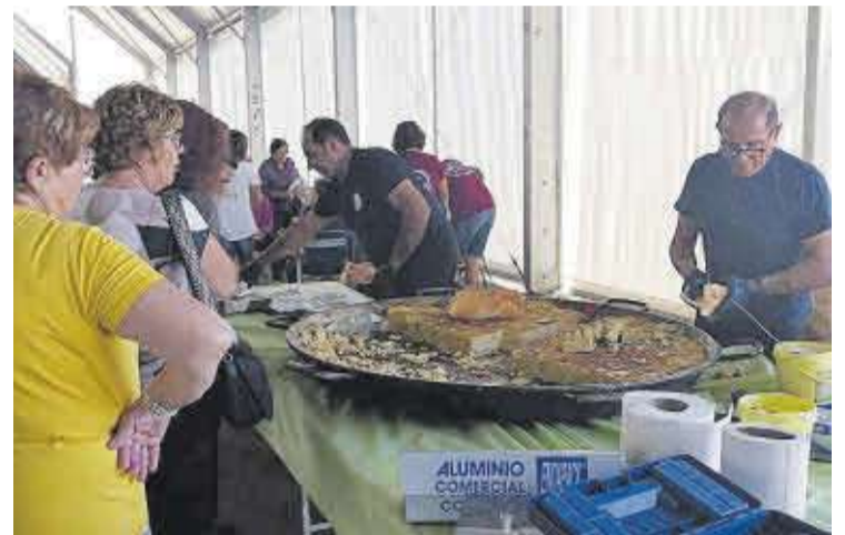
Esmorzar de truita de creïlla a la carpa de festes oferit per la comissió de festes.