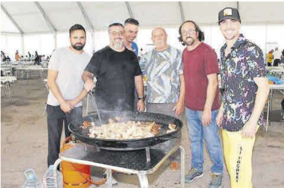
Integrants de la penya Els Birlos, en plena elaboració de la paella que va entrar al concurs festiu.