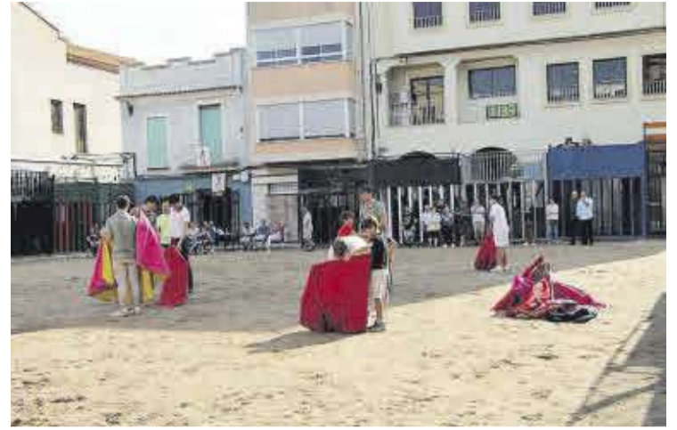
L'Escola Taurina de Castelló va oferir un espectacle amb la participació de xiquets.