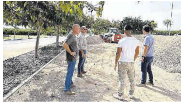
El consistorio ha iniciado los trabajos de modernización del polígono Riuet.

El Ayuntamiento de Moncofa ha iniciado los trabajos el proyecto de mejora, modernización y dotación de infraestructuras y servicios en polígonos industriales, en este caso en el polígono Riuet, que se encuentra a escasos quinientos metros del casco urbano. Todo gracias a la subvención recibida por parte del Ivace.