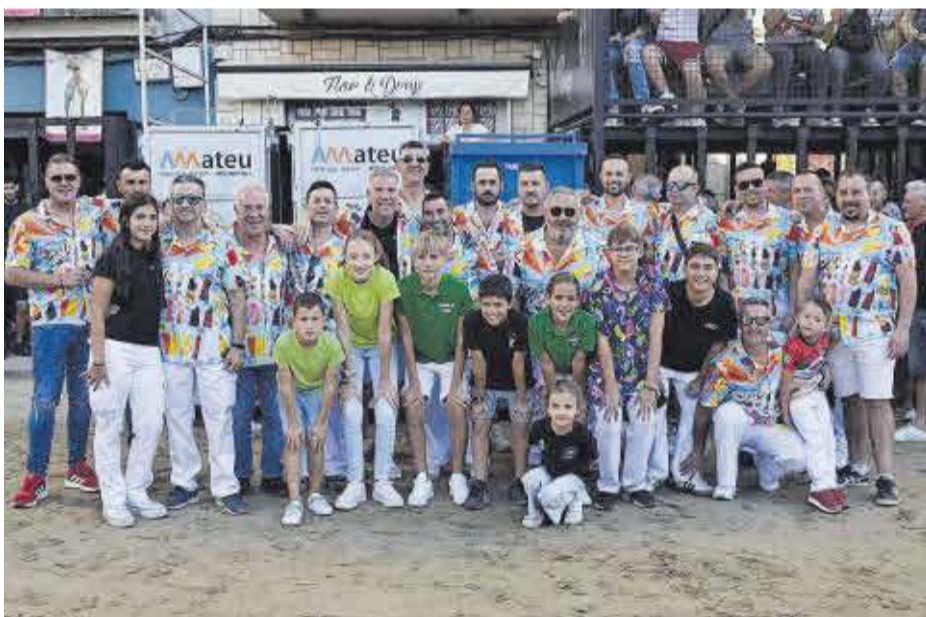
Integrants de les penyes El Peló-Fum i flit, abans d'exhibir el bou adquirit per a la setmana festiva.