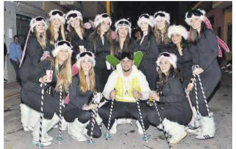
Les penyes es van bolcar en idear disfresses i mostrarles a tots els veïns i veïnes.