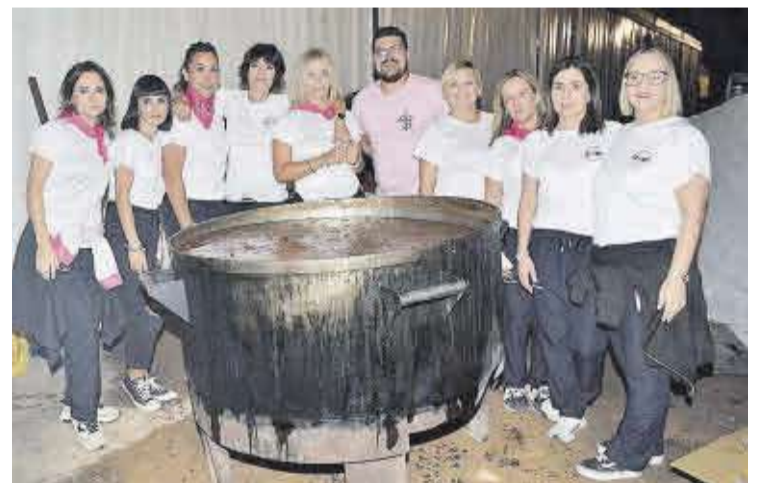
La comissió de festes, davant la caldera de carn de bou abans de servir els plats.