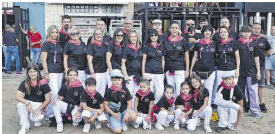
La comissió de festes, integrada per les nou dones de la penya El Rus, junt a tots els seus familiars.