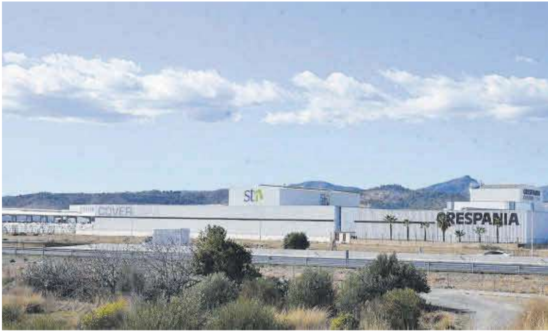
El polígono industrial Casablanca ya cuenta con la necesaria canalización de agua proveniente de la planta desaladora.