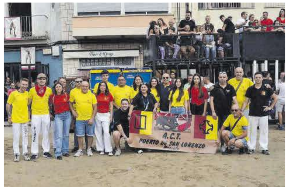
Membres de l'ACT Puerto de San Lorenzo, moments abans de donar solta al bou d'aquestes festes.