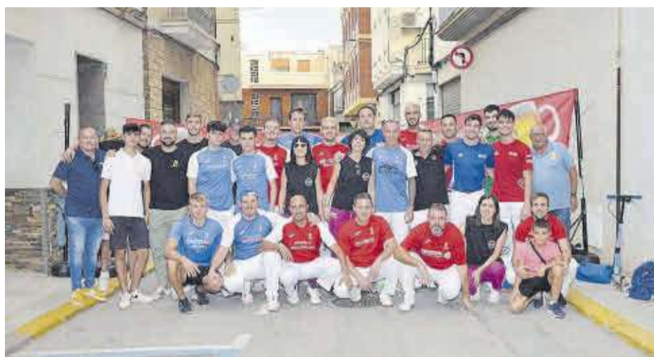
La pilota valenciana és un esdeveniment esportiu que sempre està present en esta setmana festiva.