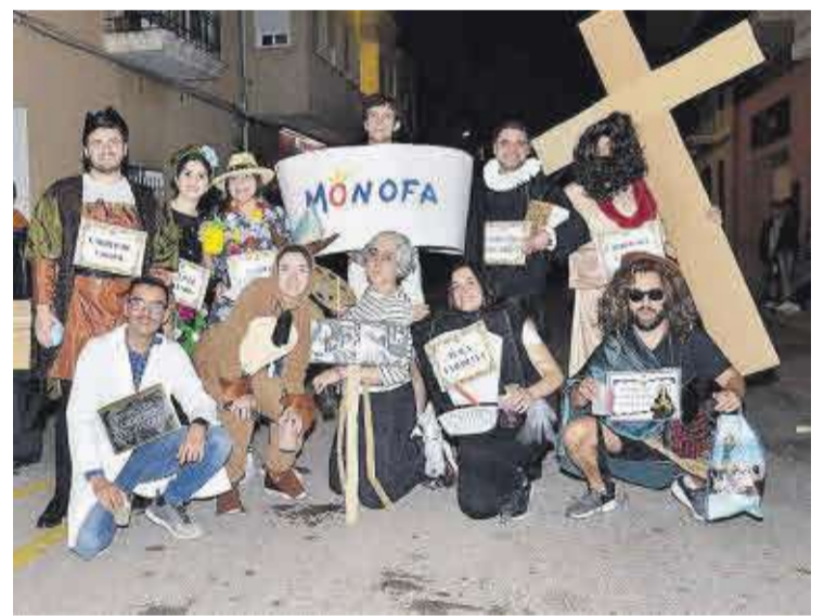
Els carrers i emblemes locals, presents en la nit de disfresses de les festes.