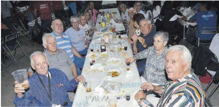
El sopar de calderes va congregat a més de 1.100 penyistes i veïns a la carpa de festes.