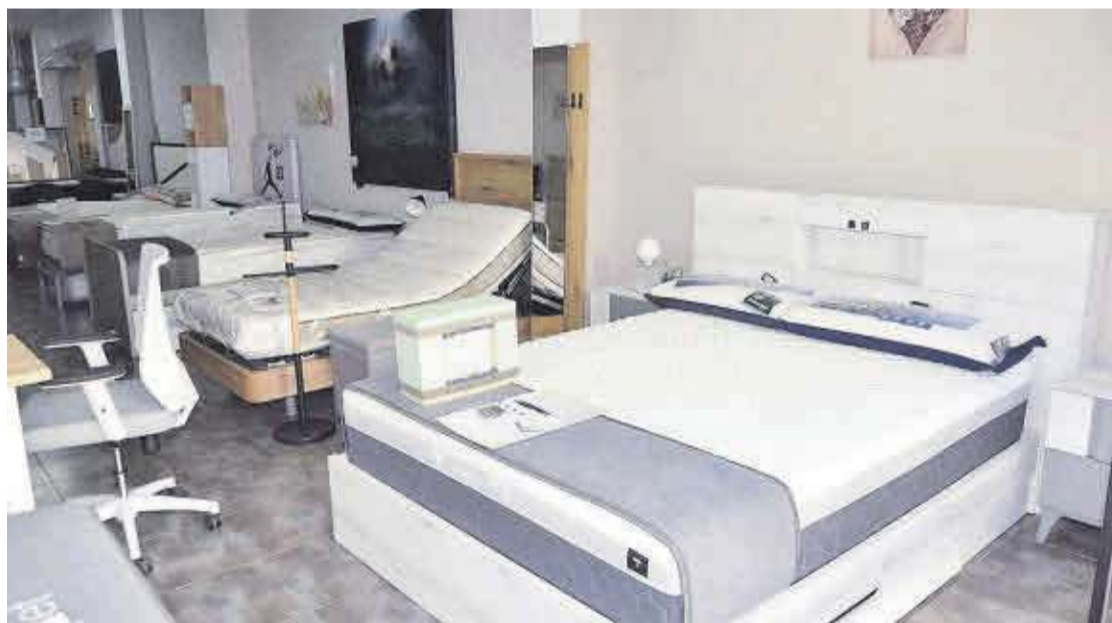
El cliente puede encontrar una amplia selección de colchones de la mejor calidad que garantizan un descanso perfecto.