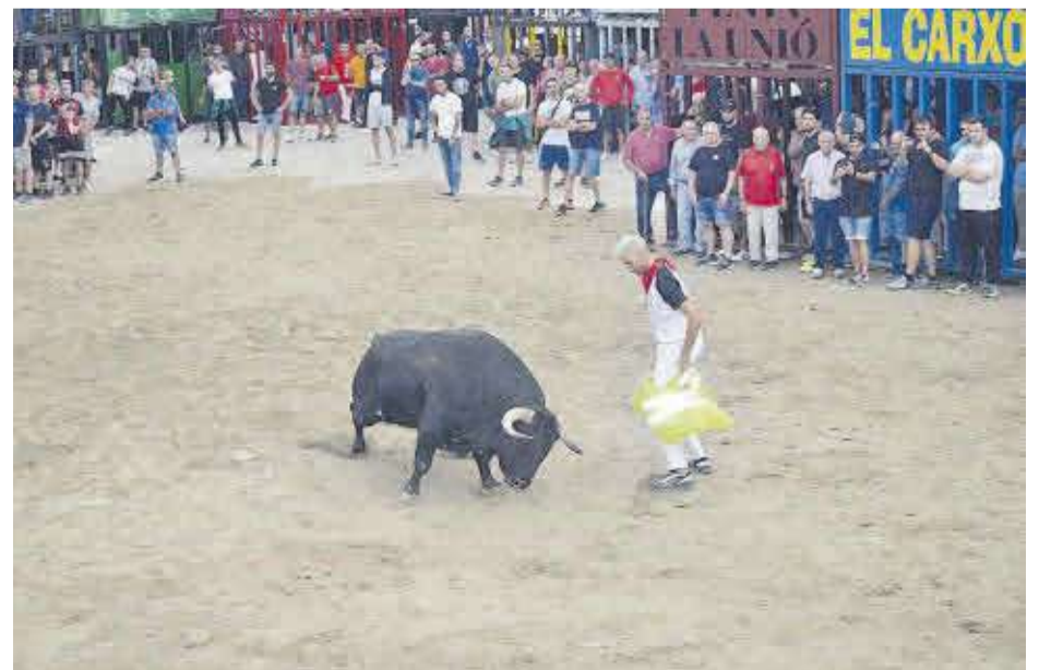
El bou 'Lioso', oferit per l'ACT Puerto de San Lorenzo, va deixar el seu segell davant els aficionats.