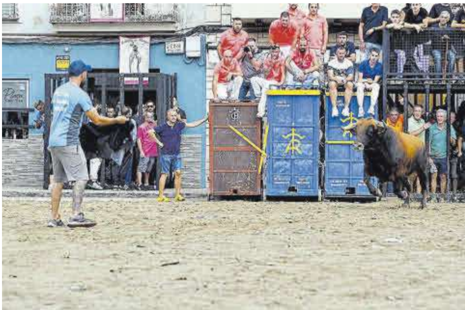
Moment de l'exhibició del bou 'Nicolás Maduro', oferit per l'ACT K-Nut.