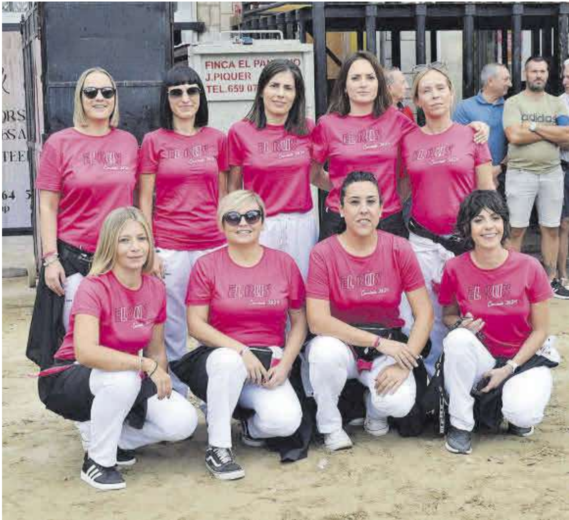
Les integrants de la penya El Rus, que enguany han estat al capdavant de la programació de les festes de Sant Antoni.