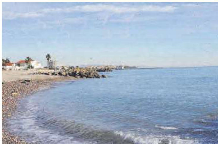
El proyecto de estabilización del litoral sur protegerá toda la zona de viviendas.

«Tenemos la imperiosa necesidad de llevar a cabo la defensa de las viviendas de primera