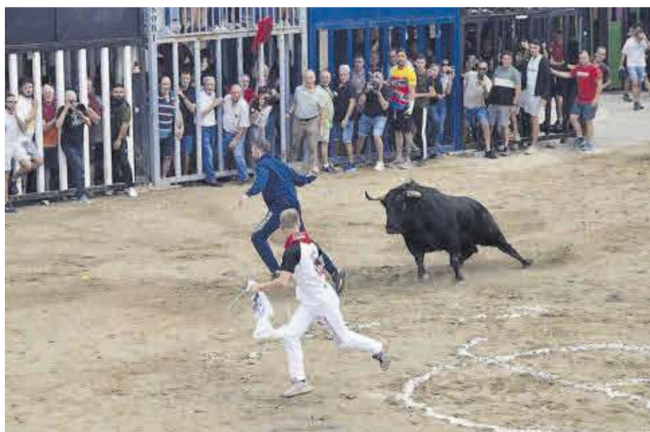
En la jornada més taurina, que va ser la del 7 d'octubre, es va exhibir el bou de l'ACT L'Asklaguetto.