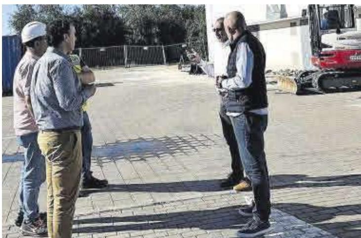
Esta nueva infraestructura se ubicará en el actual parking del polideportivo.

El consistorio ha iniciado los trabajos de construcción de una carpa polivalente de 1.500 metros cuadrados, que se ubicará en el actual aparcamiento de vehículos situado entre el polideportivo municipal y el edificio polifuncional.