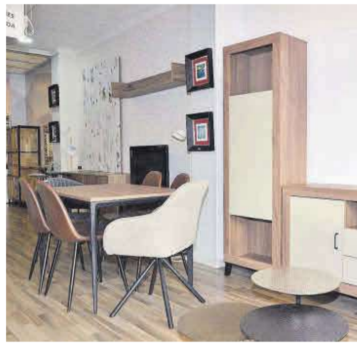
Su amplia exposición permite hacerse una idea real de la decoración.