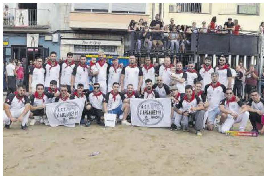
Els membres de l'ACT L'Asklaguetto van fer sentir la seua presència en el centre del recinte taurí.