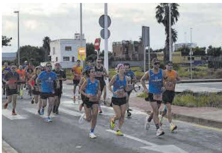
La primera part del recorregut va portar als 'runners' per la perifèria del poble.