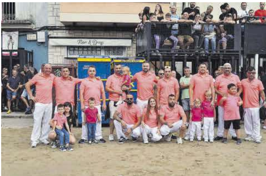
Integrants de l'ACT K-Nut, moments abans d'exhibir el bou adquirit per aquesta setmana festiva.