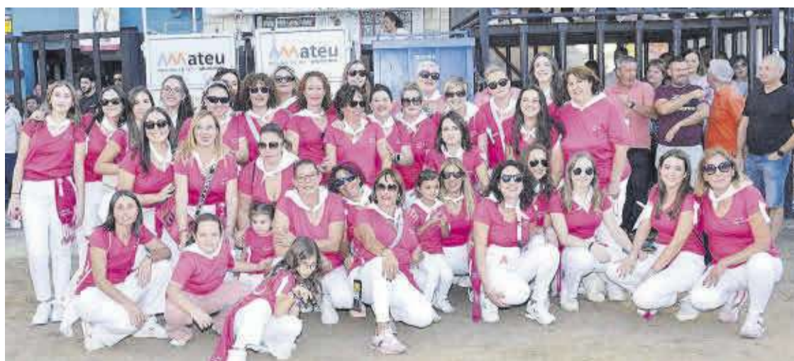
El nombrós grup de dones que formen part de la recentment creada ACT Dones Taurines, abans d'eixir el seu bou.