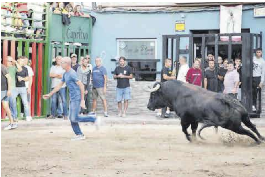
El bou 'Tinglao', de la ramaderia d'Albarreal, va fer gaudir a tots els aficionats taurins a Moncofa.