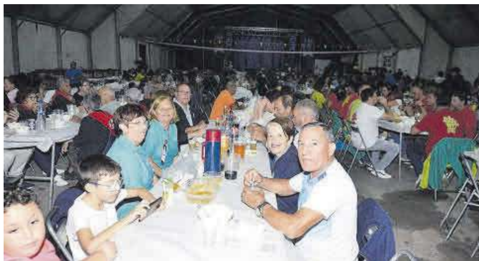
La carpa festiva va congregar a més de mil penyistes que van gaudir en tots els events gastronòmics.