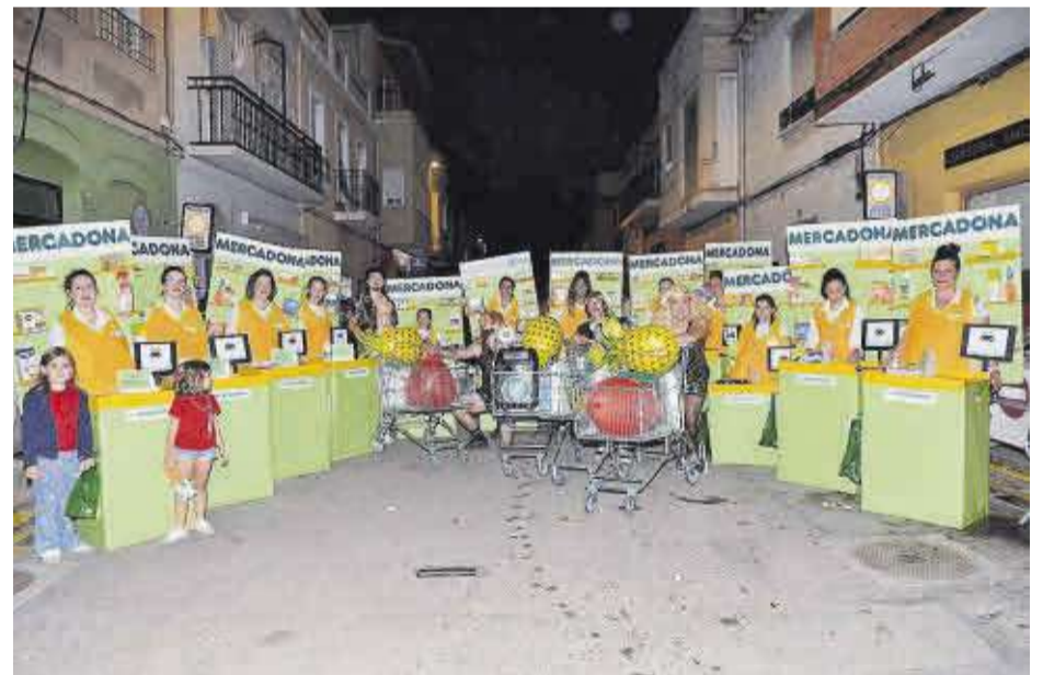
Mercadona, present entre les disfresses que enguany van idear les penyes participants en l'acte.