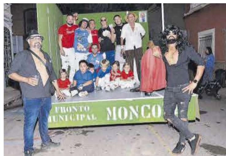
La pilota valenciana, present en l'esdeveniment de les disfresses de les festes.