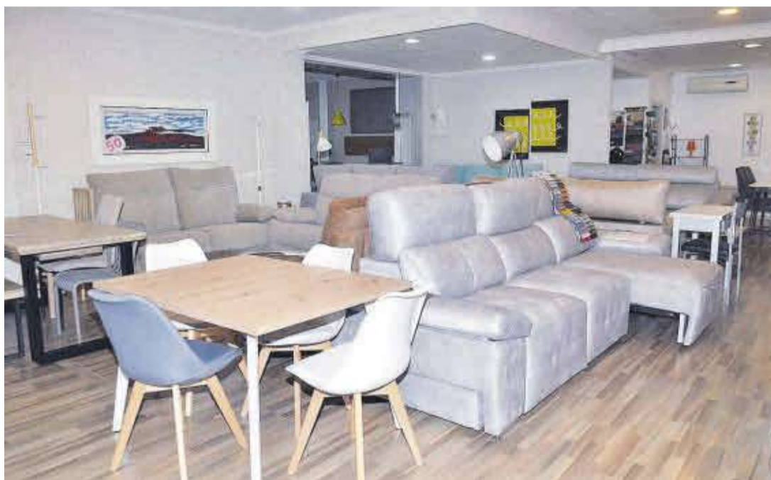
El establecimiento cuenta con una gran oferta de sofás y piezas de decoración para vestir cualquier hogar.

Las instalaciones en la calle Vicente Ramón Alós cuentan con una amplia gama de sofás y mobiliario para cada rincón de la casa