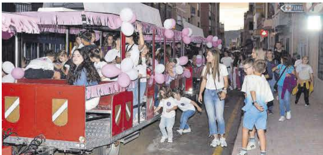
Espectacular entrà de penyes amb la gran novetat del trenet que va recórrer els carrers principals del casc urbà del poble.

un punt on celebrar tots els esdeveniments multitudinaris, els penyistes es dispersen pel nucli urbà. D'esta manera, amb els diferents esdeveniments gastronòmics i musicals han conduït tothom a la carpa de festes, que sense dubte ha sigut el gran èxit de la setmana de festes».