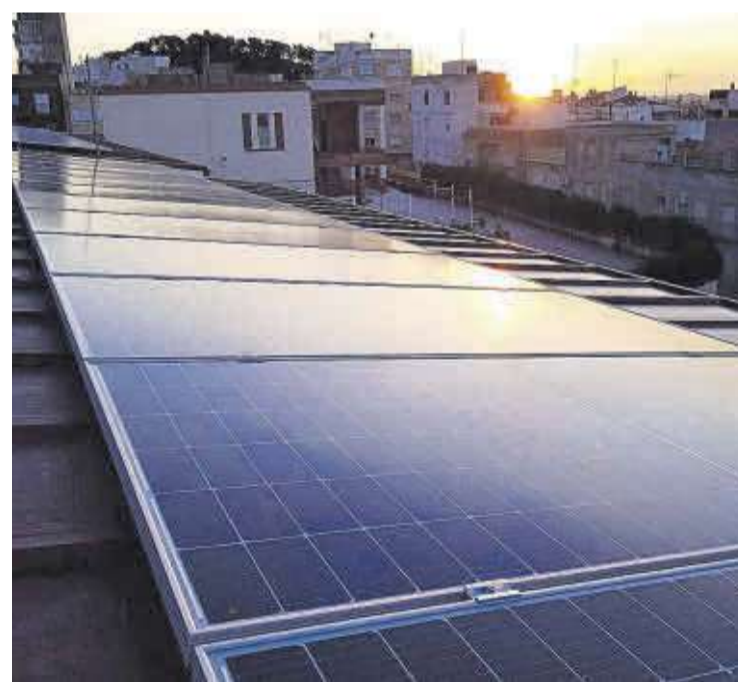
Desde ACQUAeNER apuestan por las energías renovables desde hace 22 años.

Desde ACQUAeNER apuestan por las energías renovables desde hace ya más de 22 años, acumulando una experiencia de más de 500 instalaciones a sus espaldas. «En ACQUAeNER asesoramos a nuestros clientes de cuál es la mejor solución adaptándonos a sus necesidades. Realizamos la mejor ingeniería solar, tramitamos las ayudas, los trámites legales y administrativos de las instalaciones, instalamos y mantenemos nuestras instalaciones», concluyen.