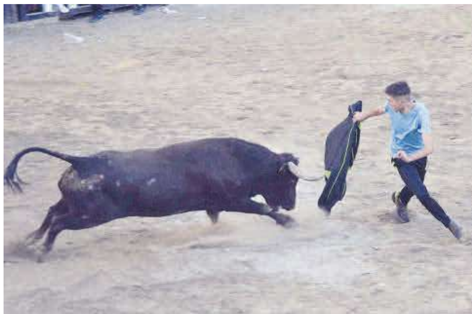
El bou de nom 'Cucurella', oferit per la penya El Peló-Fum i flit, va donar joc als aficionats taurins.