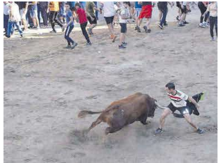
El bou 'Escribano', ofert per les Dones Taurines, va fer un excel·lent treball.