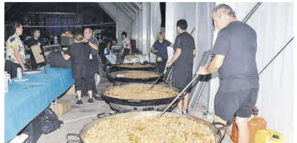
Les mandonguilles de carn a l'estil alcorines va ser el menú del sopar per als penyistes a la carpa.