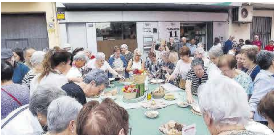
L'esmorzar saludable ofert per diversos establiments de la localitat va congregat a molts veïns.

Les nou dones de la penya El Rus han estat al front de l'organització de tots els actes celebrats al transcurs de la setmana festiva