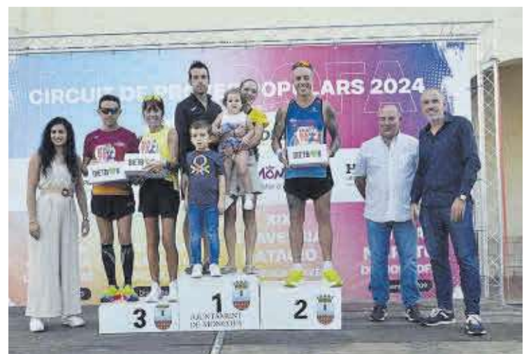
Podio local absolut, junt a l'alcalde, regidora d'Esports i gerent de Ruralmoncofa.