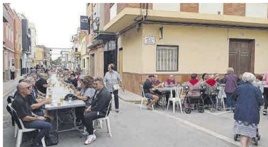
Les penyes El Peló-Fum i flit van oferir un magnífic esmorzar a tots els veïns i visitants de Moncofa.