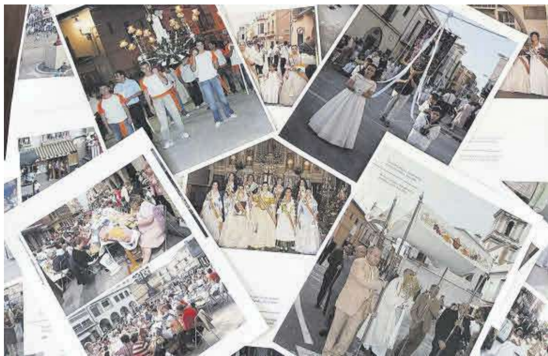
Imatge d'algunes de les planes que conformen la nova publicació que presentarà Sánchez el proper 15 de novembre.

Aquesta publicació recopila més de 400 fotografies que fan un recorregut per tots els esdeveniments que durant quinze anys s'han dut a terme en Moncofa