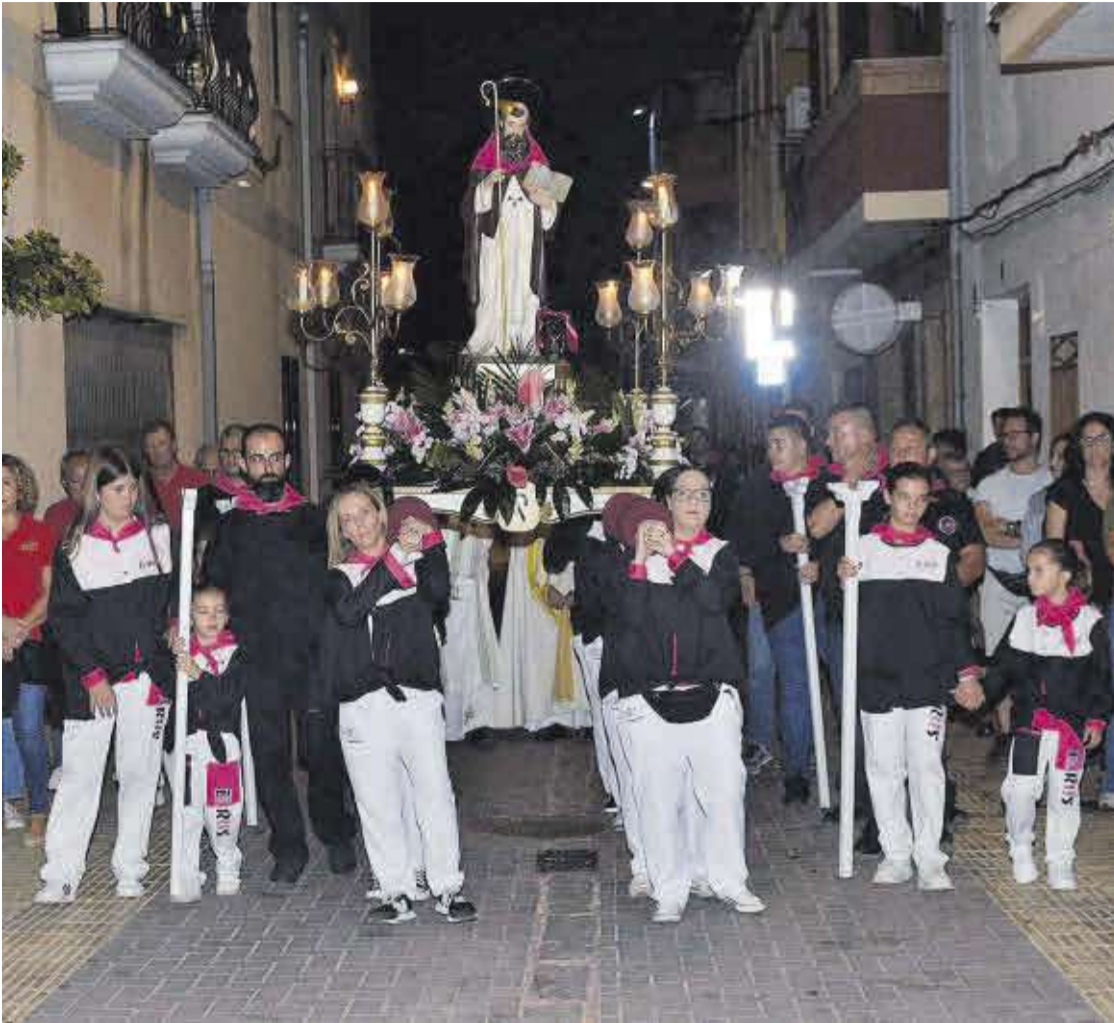
La comissió de festes, formada íntegrament per les dones de la penya El Rus, va portar al muscle el pas de Sant Antoni.