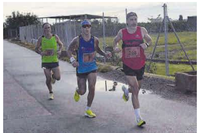
La prova atlètica va transcórrer per distints camins rurals del terme municipal.