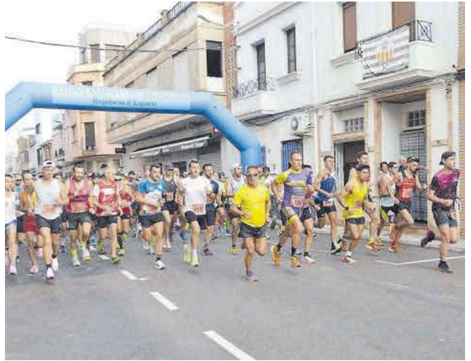
Els prop de 300 participants varen propiciar que l'èxida de la mitja marató fora espectacular.