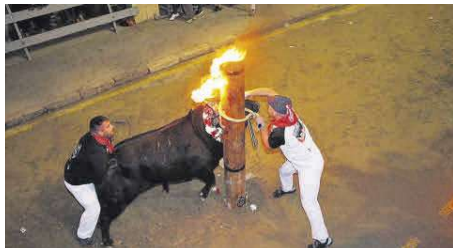
Al transcurs de la setmana de festes es van dur a terme diverses emboladades de bous i vaques.