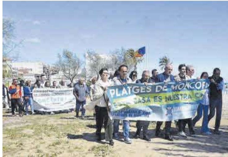
Las autoridades municipales encabezaron la reivindicación en la playa.

P aralizar los derribos y construir los espigones necesarios para proteger la costa de Moncofa y la Plana Baixa. Esa es la reivindicación por la que decenas de personas se manifestaron el 30 de marzo en una movilización convocada en la playa del municipio bajo el lema Esta casa es nuestra casa , como respuesta al plazo de dos meses que el servicio provincial de Costas del Ministerio para la Transición Ecológica ha dado a los propietarios de una vivienda para abandonarla y derribarla.