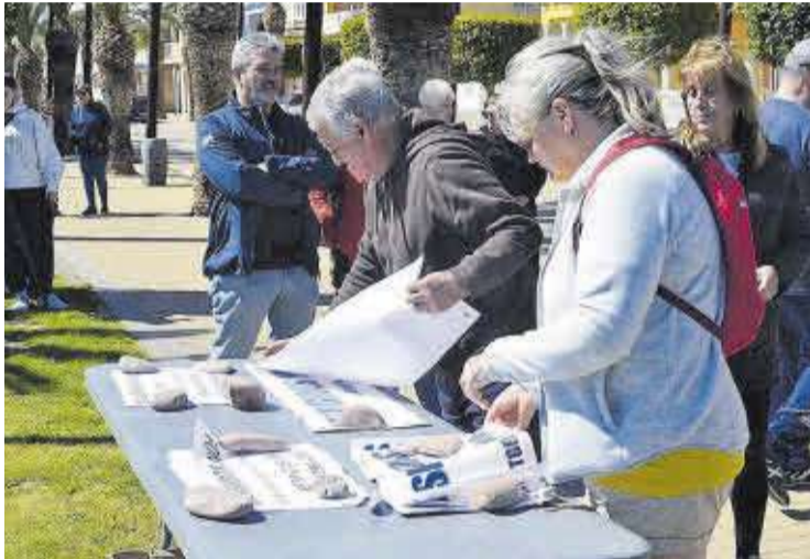
Asistentes a la concentración, durante la recogida de carteles contra los derribos.

La plataforma Platges de Moncofa- Espigones Ya convocó una concentración en la playa bajo el lema 'Esta casa es nuestra casa'