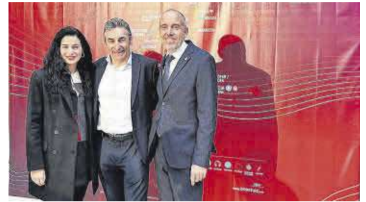
El alcalde de Moncofa y la edila de Deportes, con el director de la Vuelta.

Moncofa será meta en la segunda etapa de la Vuelta ciclista a España Femenina.