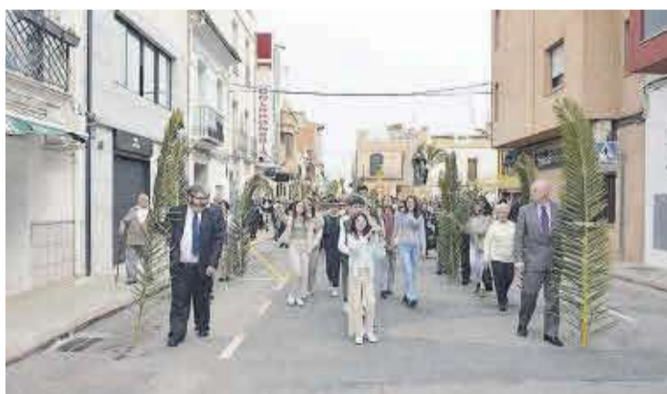
La benedicció de les palmes es va fer en la plaça el Plà, després de la processó.