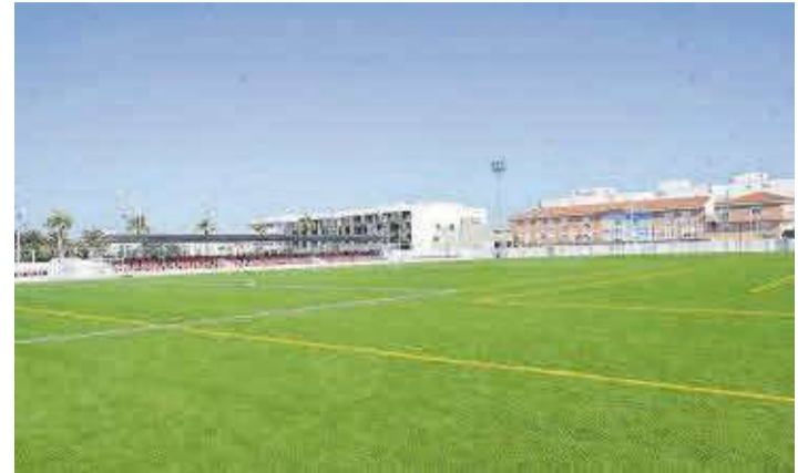
Instalaciones deportivas municipales con que cuenta Moncofa.

Asimismo, recuerdan a los vecinos y las vecinas de la localidad que pueden contactar con la oficina de atención al cliente de Facsa o con el Ayuntamiento para consultar y comunicar cualquier incidencia.