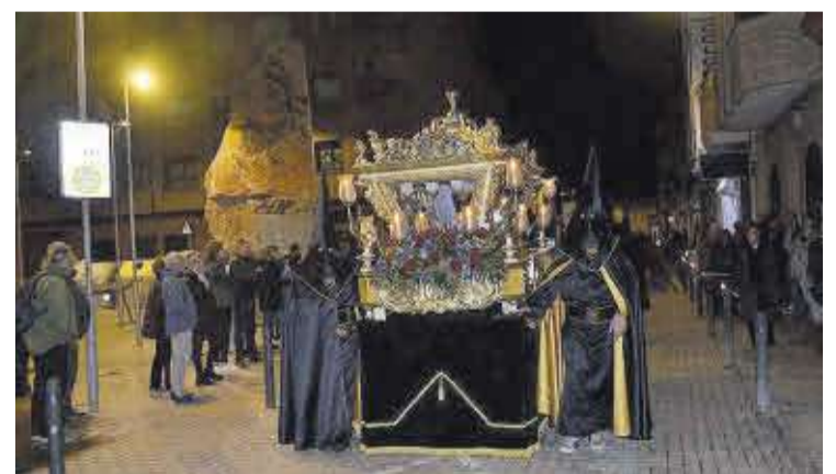
El pas del Sant Sepulcre va formar part de la processó del Divendres Sant.