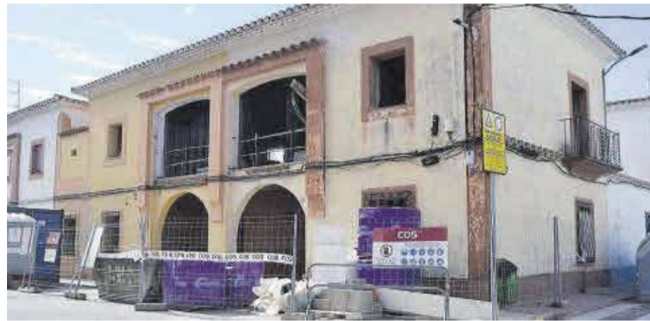
El proyecto de construcción del Espai Jove también contará con aportación económica del remanente.

Moncofa destinará 834.684,95 euros, procedentes del remanente de tesorería correspondiente al ejercicio económico 2023, a la inversión en distintos proyectos «necesarios para el municipio y para la mejora de la calidad de los servicios a los que tienen acceso los vecinos», explicó el alcalde y edil de Hacienda, Wences Alós.