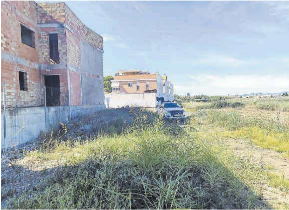
Los trabajos de control de plagas de mosquitos son constantes y los vehículos especializados peinan todos los puntos.