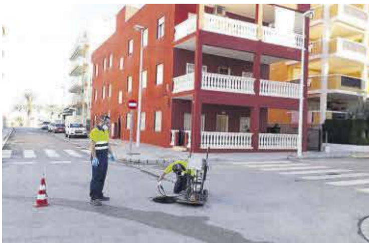
Operarios de Facsa desarrollando las labores desratización y desinsectación.

El Ayuntamiento de Moncofa y Facsa ha iniciado la campaña especial de desratización y desinsectación en la red municipal de alcantarillado, una iniciativa de carácter preventivo cuyo objetivo es evitar la proliferación de insectos y roedores en la