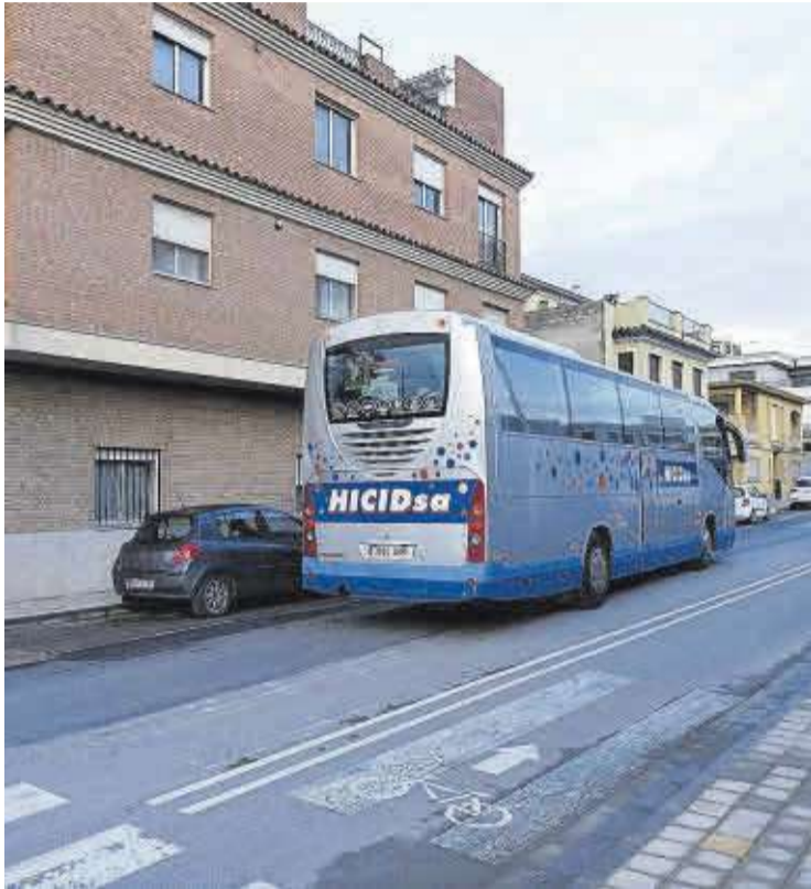
La empresa de transportes HICID SA es la adjudicataria de este servicio.

La ampliación de horarios proporcionará más alternativas diarias a los usuarios del transporte