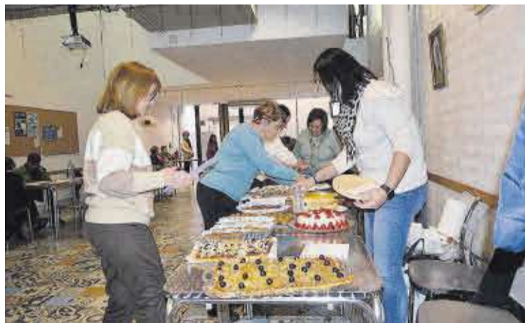
El concurs de dolç i salat va comptar amb diverses propostes gastronòmiques.

Moncofa ha dut a terme una extensa programació d'actes en la commemoració de la Setmana de la Dona. Entre els esdeveniments més significatius destaca la lectura del manifest, que esta edició ha sigut elaborat per l'alumnat del CEIP Científic Avel·lí Corma de la localitat. En esta jornada els