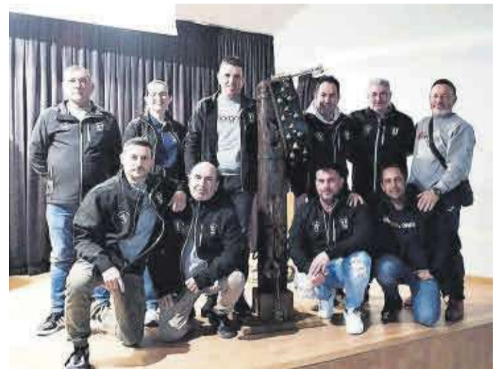
La localidad cuenta con 40 asociaciones culturales, festivas y deportivas.

Durante el encuentro, el edil de Seguridad Ciudadana señaló «la necesidad de contar con más vigilancia, sobre todo en las zonas de cultivo, ya que es época de siembra de cosechas de verano y es necesario incrementar la seguridad para evitar los hurtos en las zonas agrícolas existentes en todo el término municipal».