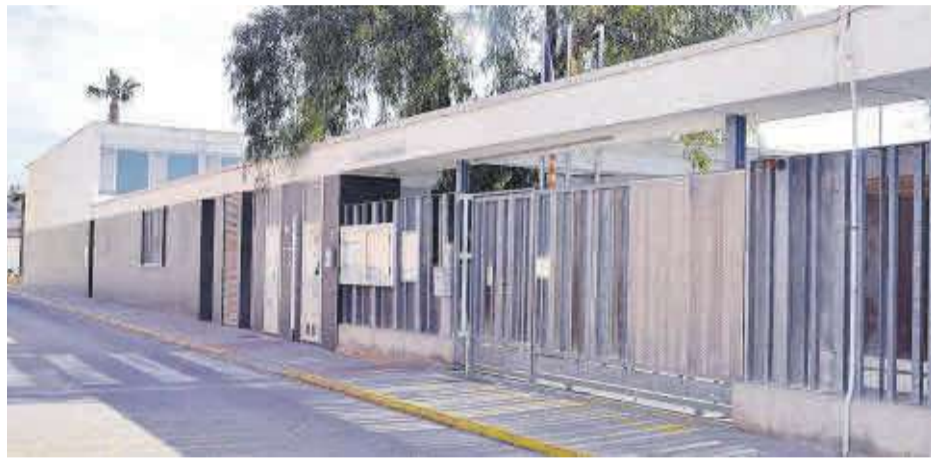
El forjado del CEIP Científic Avel·lí Corma albergará la instalación de placas fotovoltaicas.

Parte de la cantidad ahorrada se destinará a proyectos importantes y necesarios para mejorar la calidad de vida de la ciudadanía