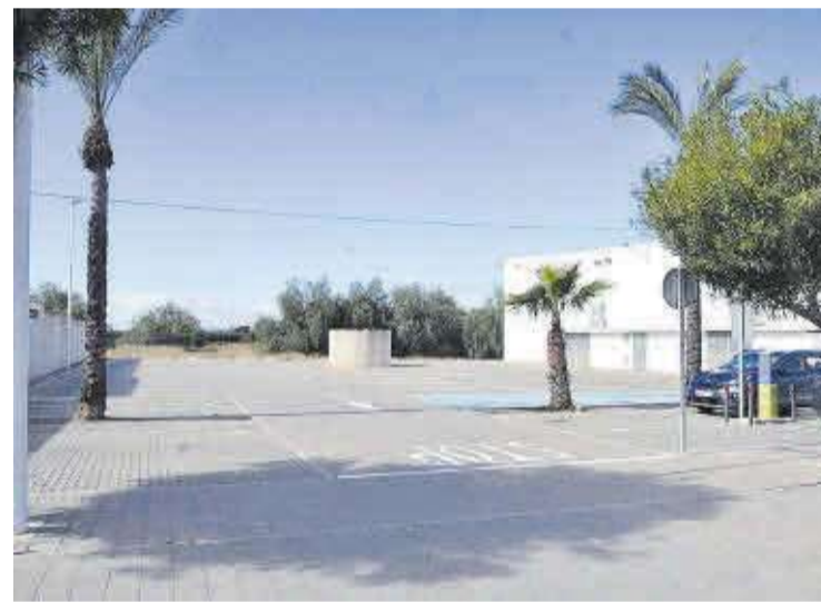
Del remanente también se destinará partida a la ampliación el polideportivo.

El informe de intervención pone de manifiesto la sana situación financiera del