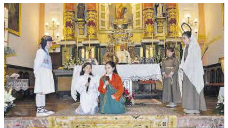
L'església va ser l'escenari per a la representació de l'acte de l'Encontre.