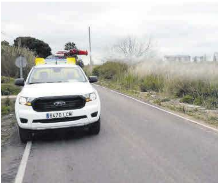
Acequias y balsas son los espacios en los que más proliferan las larvas del insecto.

El reglamento establece las normas a seguir también en las propiedades privadas