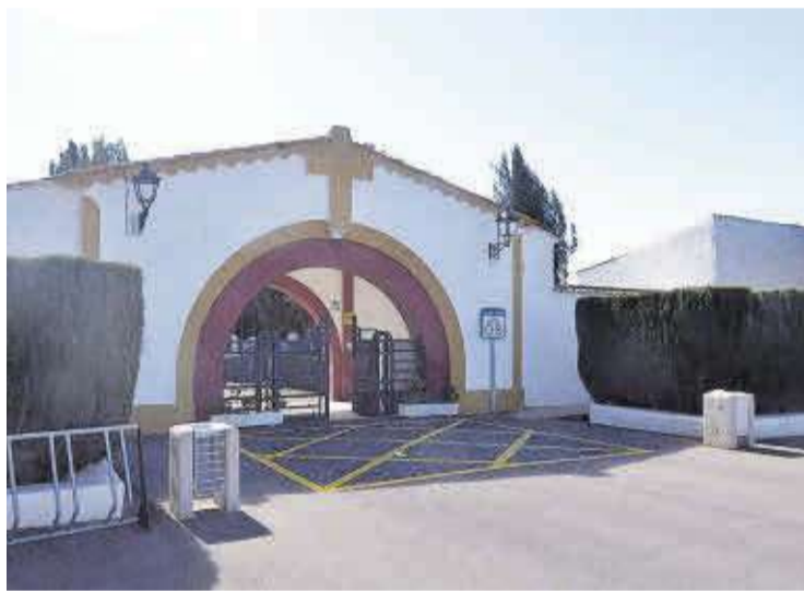
El consistorio adquirirá parcelas colindantes al cementerio municipal.

No obstante, estas no serán las únicas inversiones previstas, ya que a ellas se sumarán la instalación de placas fotovoltaicas en el colegio Avel·lí Corma y la biblioteca, un proyecto valorado