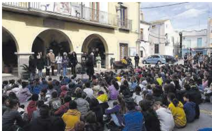
El manifest va ser elaborat per l'alumnat del CEIP Científic Avel·lí Corma.

La façana del consistori va ser el lloc escollit per a la lectura del manifest d'aquesta edició