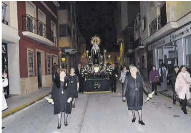
Les Endolorides, protagonistes en la processó de la Verge dels Dolors.

Finalitzada la processó del Divendres Sant, un grup de persones es van afanyar d'engalanar per a l'ocasió un tram del carrer Major, als voltants de l'església, que és on el diumenge es va dur a terme la representació de la Trobada entre la Mare de Déu i el seu fill, Jesucrist. Cal destacar que aquest esdeveniment també va comptar amb un nombrós públic que any rere any viu la representació i seguidament participa de la processó de la Trobada, que fa el trajecte a l'inrevés de la resta de processons que es celebren al llarg de l'any a la localitat.