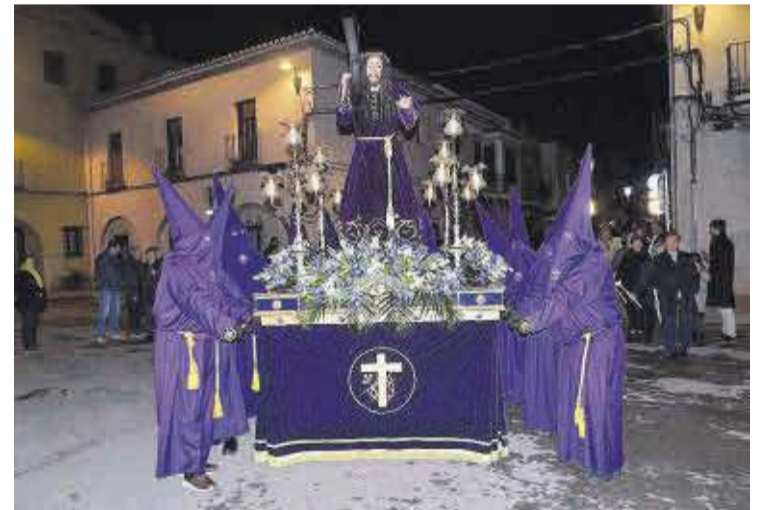
L'Associació d'El Nazareno va participar en la processó del Sant Enterrament.