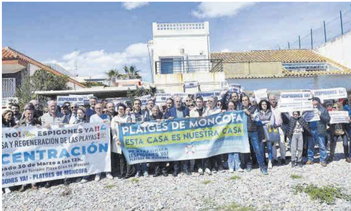
Todos los asistentes mostraron su apoyo a los propietarios de la vivienda que Costas quiere que se derribe este mes.