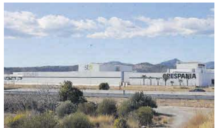
El polígono industrial Casablanca recibirá agua de la planta desaladora.