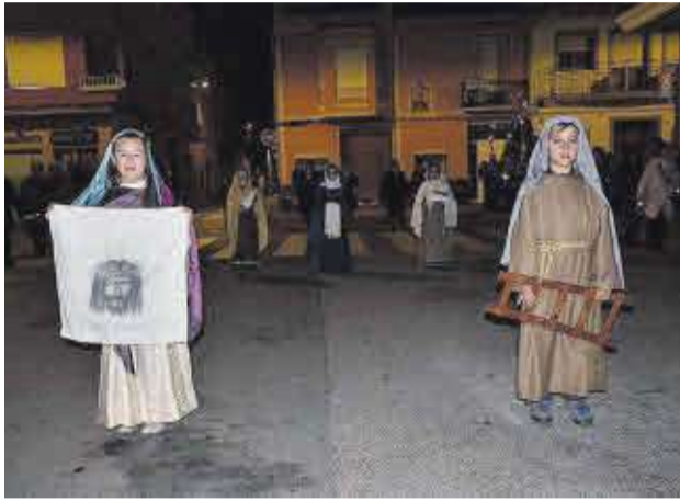
Un grup de xiquetes va representar la Passió de Jesucrist.

En la processó de l'Enterrament els protagonistes varen ser els passos religiosos així com els confreres integrats en cadascú d'ells