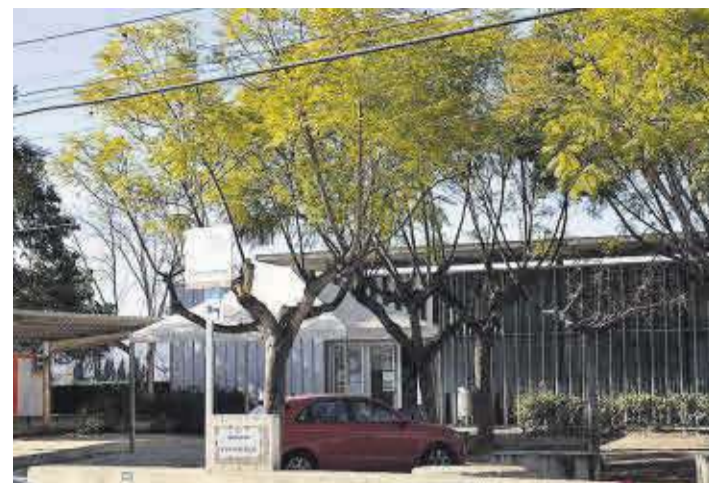
Actual infraestructura del centre de salut de Moncofa que es veurà ampliat.

Per part seua, l'alcalde de Moncofa, Wences Alós, va afegir que des del consistori «portem molts anys treballant per donar visibilitat a la dona i arreplegant iniciatives, sobretot del centre escolar. I també com a exemple està posar nom de dones en tots els parcs i zones verdes, així com Clara Campoamor, que dona nom a la biblioteca municipal. Seguim en el camí de donar importància el paper que desenvolupen les dones sempre».