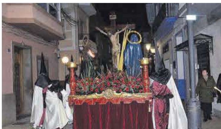
Els confreres del Santíssim Crist de l'Agonia varen portar el pas en la processó.