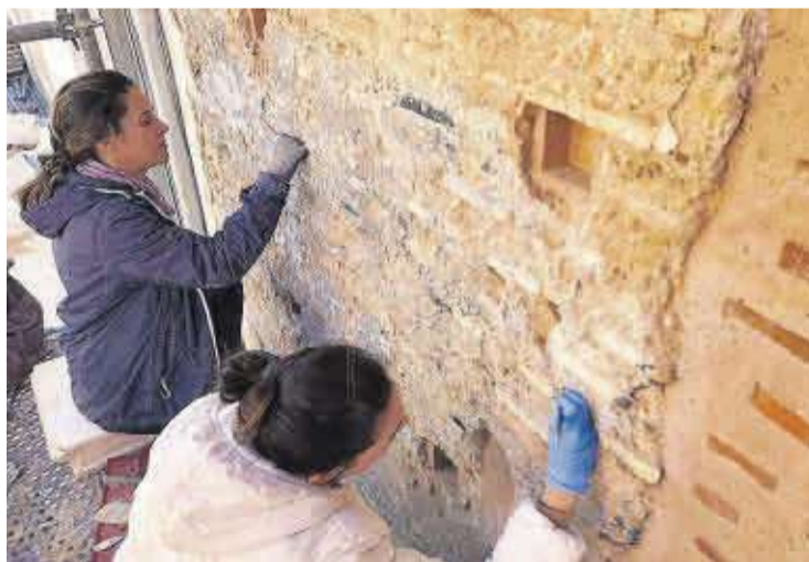
En el exterior se reformó parte de la muralla con el sistema de 'tapia valenciana'.

Cultural y gozan de la máxima protección de la Ley de Patrimonio. Por eso todo el proceso fue supervisado por los arqueólogos de la empresa Arqueocas. Arqueología y Patrimonio.