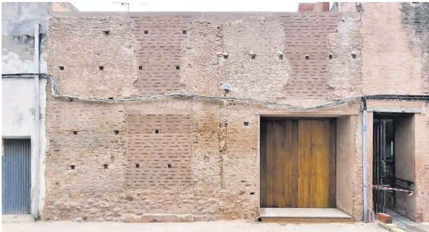
Los trabajos de restauración de la muralla se han llevado a cabo sobre las fachadas exterior e interior del inmueble y se han realizado en tres fases.

Los trabajos venían recogidos en el Plan Director para la Recuperación del Recinto Amurallado de Moncofa (2020). Cabe recordar que las murallas se construyeron durante el reinado de Pedro IV de Aragón, a mediados del siglo XIV, para defender a la población de las guerras, el bandolerismo y la piratería, y que posteriormente las defensas fueron ampliadas en el siglo XVI con antemuros y una torre-portal. Hoy, sus restos están declarados Bien de Interés