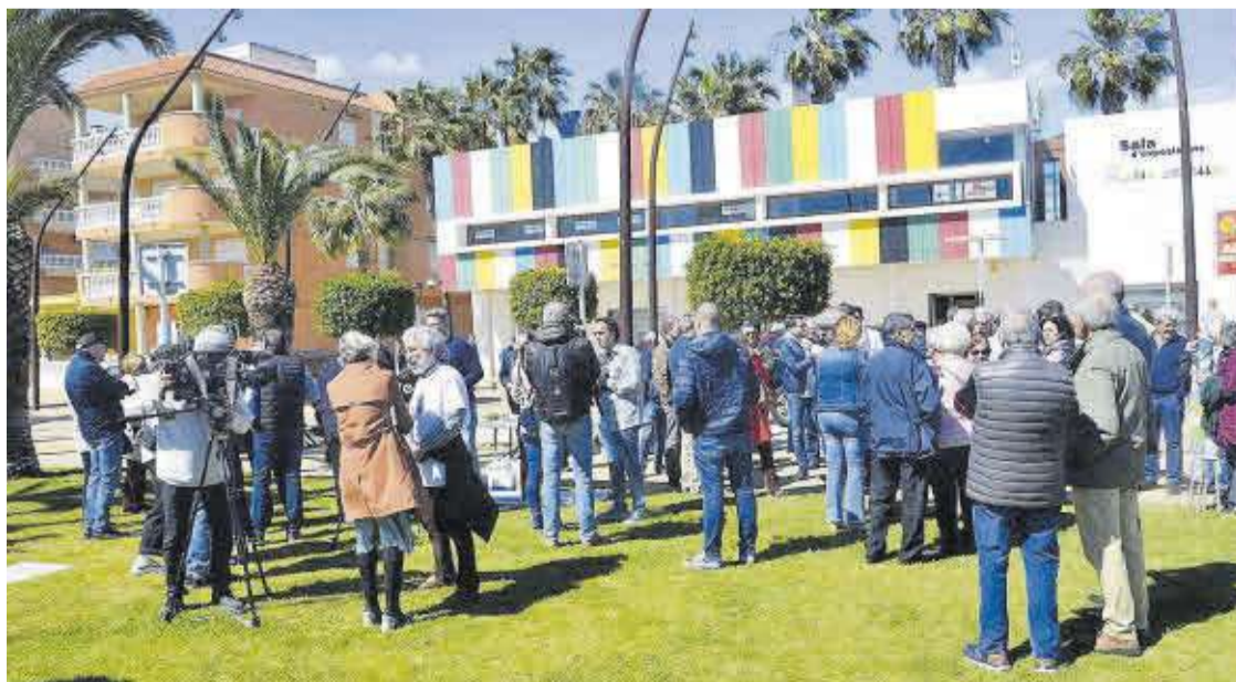
La movilización de los vecinos y las distintas entidades contra el derribo despertó una gran expectación mediática.