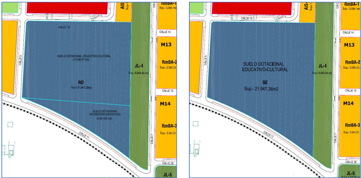
- planeamiento vigente -