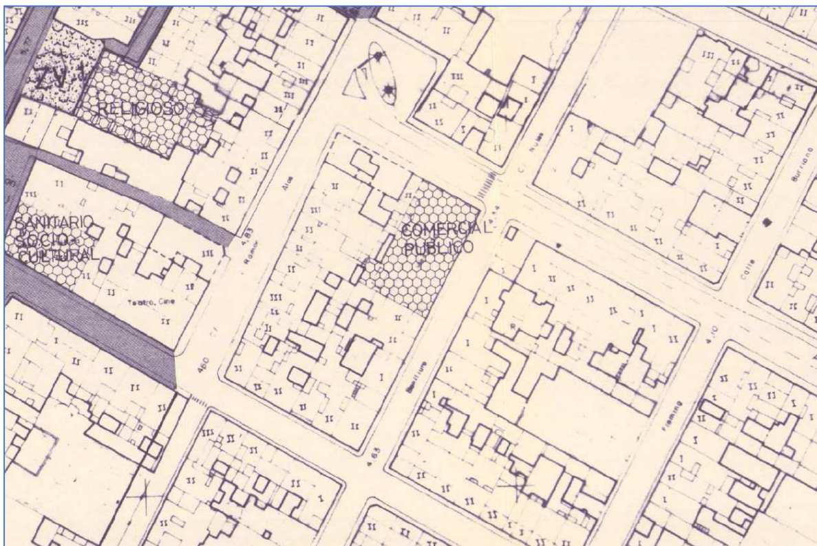
Localización del suelo dotacional Comercial-Público en la zona pueblo, según plano nº 3 de las NN.SS.

Uno de ellos, es suelo dotacional en el que se encuentra el Mercado Municipal, situado en la confluencia de la C/ Ramón y Cajal con C/ Benlliure, y que si bien se destina a este uso, sus parámetros urbanísticos no vienen recogidos en la normativa municipal.