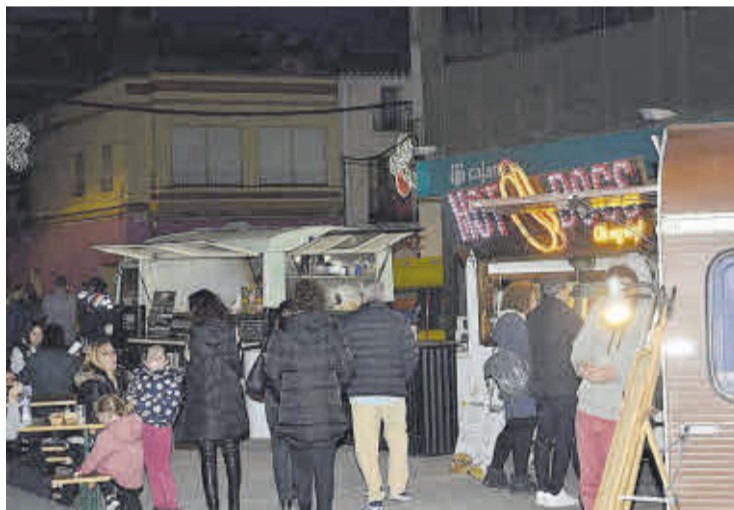
Los 'foodtrucks' atrajeron al público local y a los turistas a principios de mes.

Una de las personas que estuvo presente en este evento social y gastronómico fue la reina de