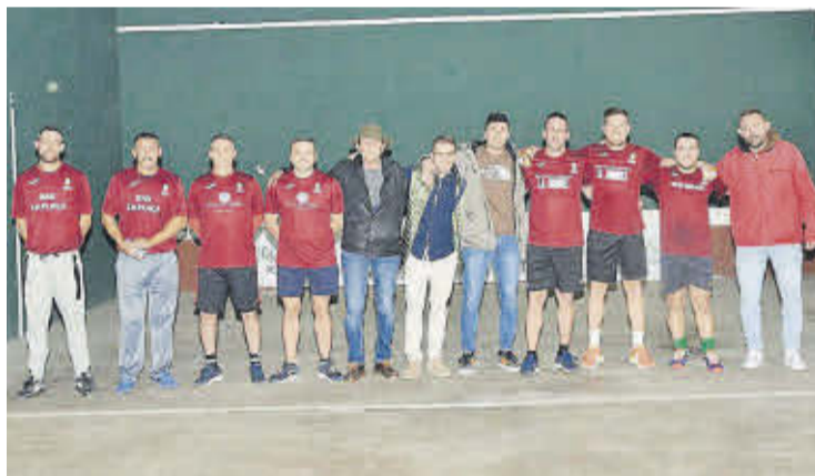
Equipos finalistas y semifinalistas de la categoría A del campeonato disputado.