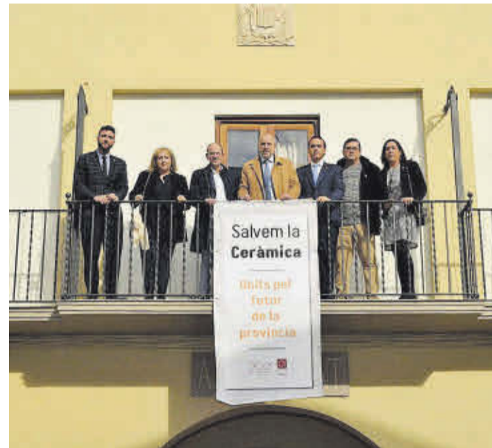
Miembros de la corporación municipal colgando la pancarta en el consistorio.

■ Una pancarta colgada en el balcón de la casa consistorial muestra la defensa, por parte de la corporación municipal, de la industria cerámica provincial, con los problemas por los que atraviesa. Dicha pancarta fue colgada por miembros del equipo de gobierno para, de esta manera, hacer más visible esta situación.