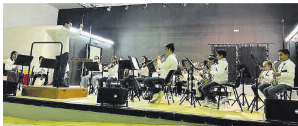
Los integrantes de la banda joven ofrecieron un concierto que agradó a los presentes en el acto musical.