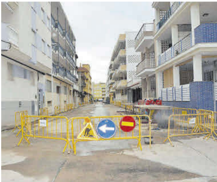
Esta conducción se unirá a la ya ejecutada en la fase de antes del verano.

Esta fase cuenta con un presupuesto de 310.000 euros y su ejecución está en el plazo marcado