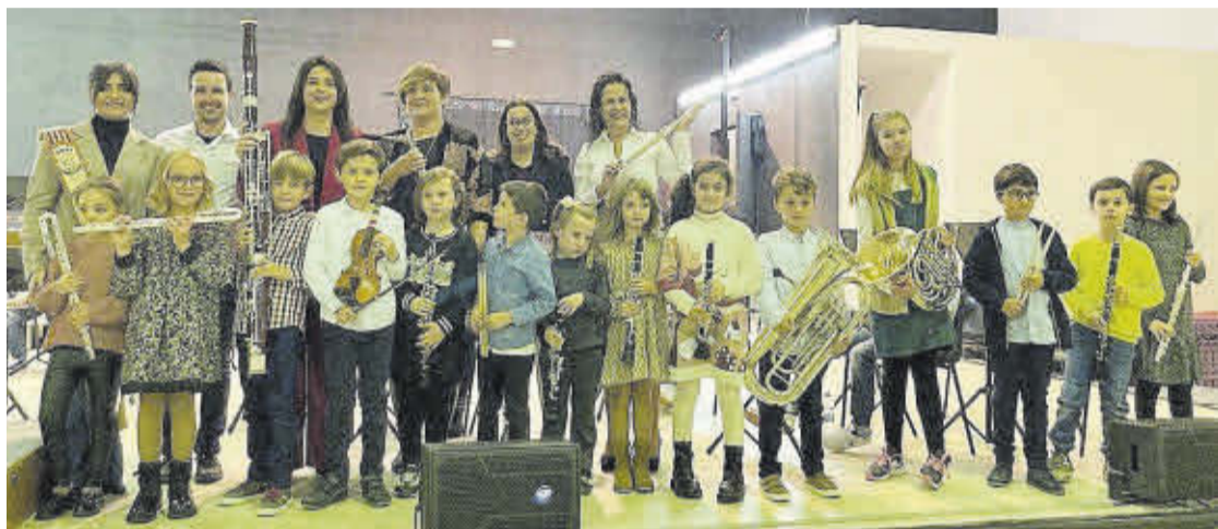
Los nuevos integrantes de la escuela de música Solfejant, junto a la presidenta de la SUM y la Musa de la Música de 2021.