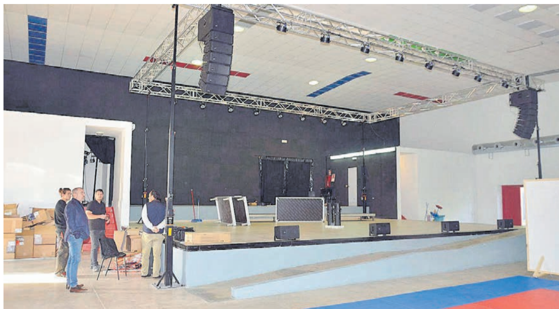
L'edifici polifuncional compta amb nova il·luminació i so per a poder realitzar espectacles amb molta més qualitat.