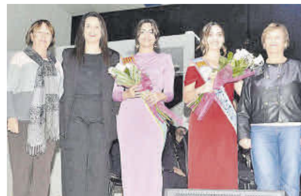
La asociación local contra el cáncer hizo un detalle a la dos musas.