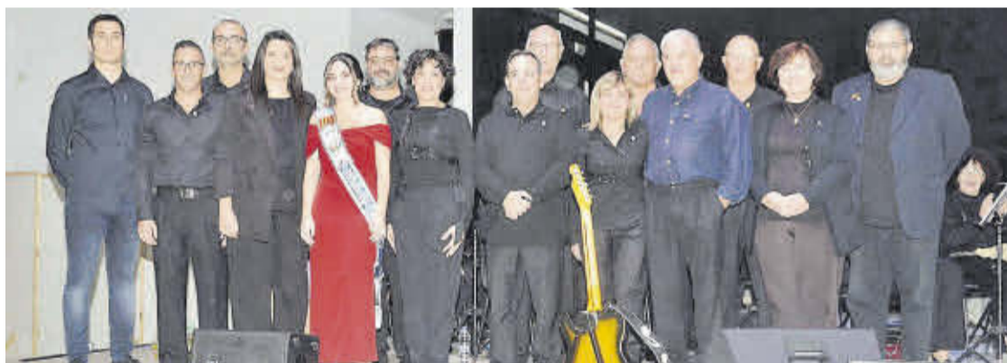
Reconocimiento a todos los músicos que llevan 50 y 25 años como miembros de la SUM Santa Cecilia de Moncofa.