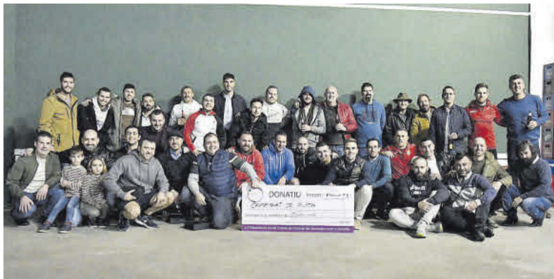
Organizadores, equipos y aficionados, y el cheque entregado a la asociación local contra el cáncer.

El frontón de Pedro Martí es el escenario donde se llevó a cabo este evento deportivo local