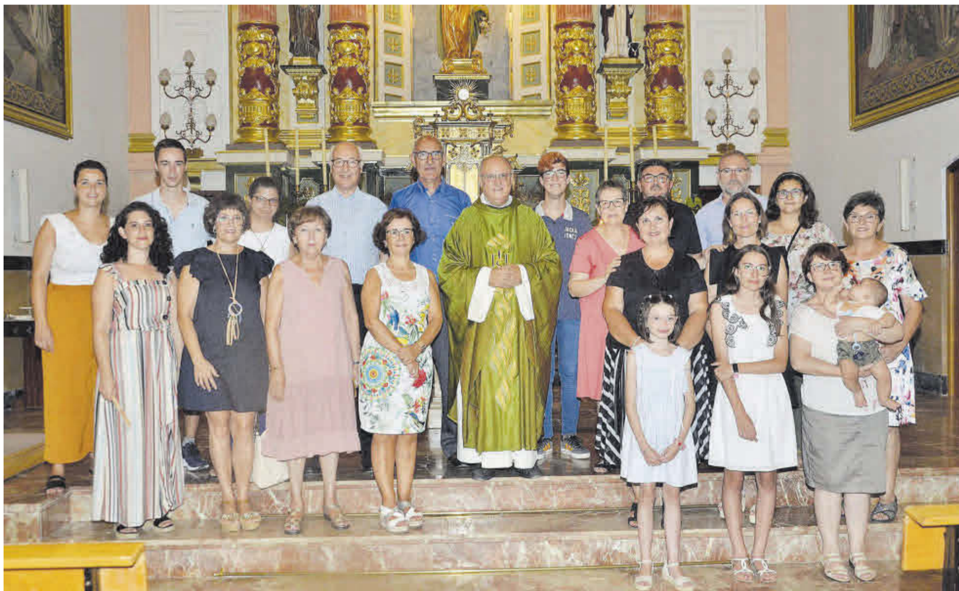
El coro parroquial de Santa María Magdalena de Moncofa está de enhorabuena y todos sus integrantes celebraron esta efemérides en un concierto especial que celebraron a finales del pasado verano.