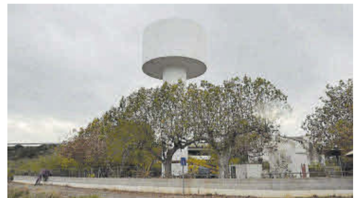
El Pirulí es una infraestructura muy representativa para esta localidad.