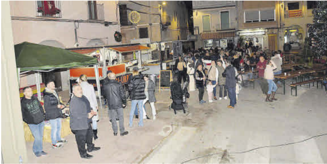
La plaza de la Constitución de la localidad fue punto de encuentro de vecinos y visitantes durante el puente festivo.