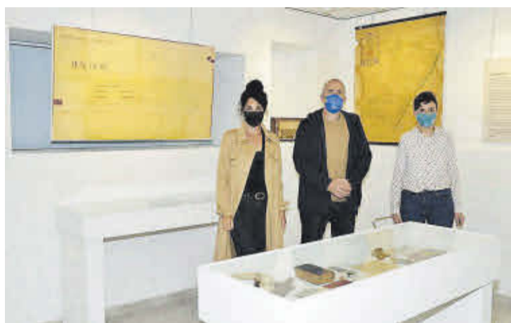
L'alcalde, junt a la regidora de Cultura i l'arxivera, en la Sala Plenamar.

destacat que «aquesta exposició ha comptat amb prop de 300 visites, de gent interessada en conèixer i visualitzar de primera mà fotografies, documents, llibres donats o cedits pels veïns, amb la finalitat de que es puguin donar llum».