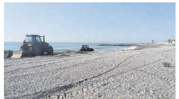
La maquinaria pesada trabaja a lo largo de los seis kilómetros de litoral.