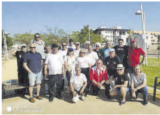
Los participantes en los actos programados disfrutaron de lo lindo en el taller de cerámica y en el concurso de petanca.