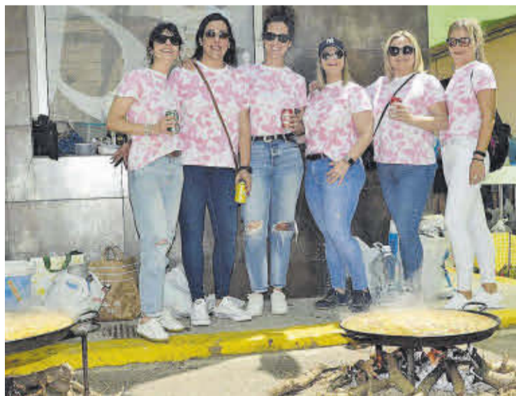
Pie de foto.