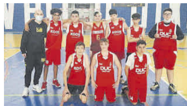
Los integrantes del cadete están progresando con un gran nivel.