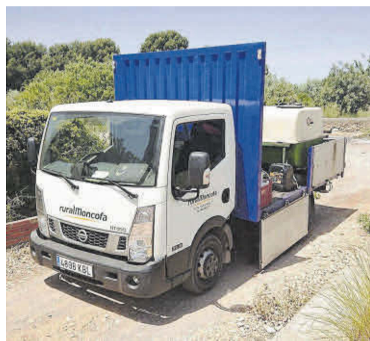
Rural Moncofa ha adquirit un nou camió per a dur a terme els treballs en els camps.

«En Rural Moncofa continuem apostant per oferir als nostres socis i clients un gran ventall de productes i serveis de qualitat, supermercats Charter, gasolinera, subministraments i assessorament agrícola, la Teua Tenda, telefonia, electricitat, gasoil a domicili, lloguer d'oficines i assegurances», finalitzen.