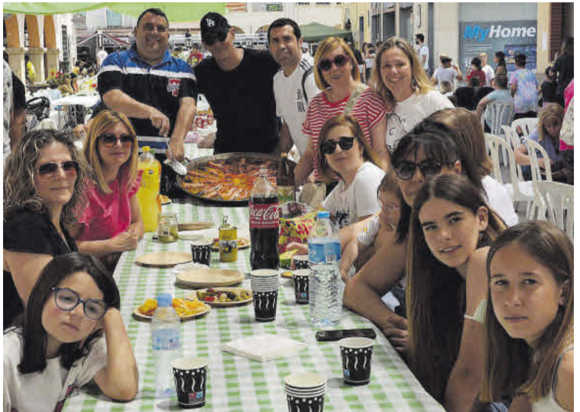
Mayores y pequeños se reunieron en torno a la mesa para disfrutar de las excelentes paellas preparadas para la ocasión.

La comisión de fiestas de octubre instaló una barra de bebidas con la finalidad de recaudar el máximo de dinero posible para poder elaborar un gran programa para las fiestas de octubre. Cabe destacar el gran ambiente creado por la gran afluencia de peñistas y vecinos junto con la música de la orquesta Grupo Next.