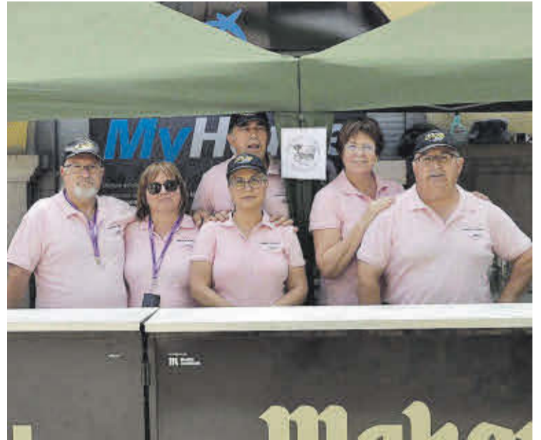
La comisión de las fiestas de octubre instaló una barra para recaudar fondos.