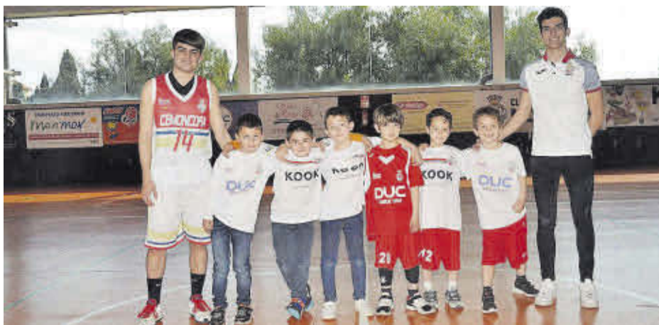
Los más pequeños del club, prebenjamines, se están iniciando en los entresijos del baloncesto.