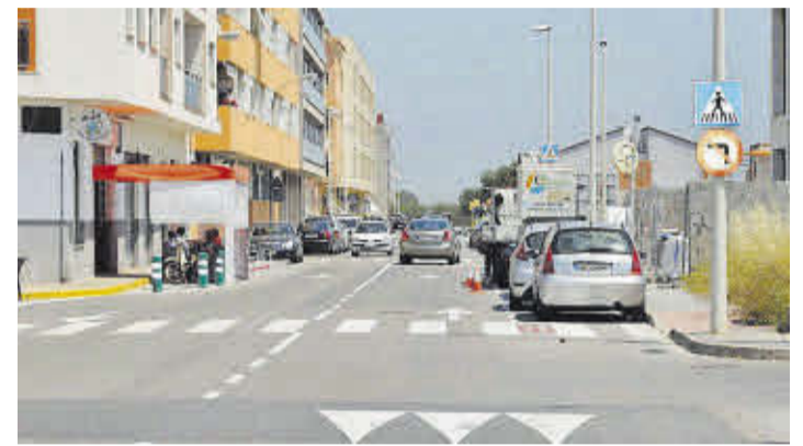
Las acciones acometidas mejoran la seguridad de este importante vial.