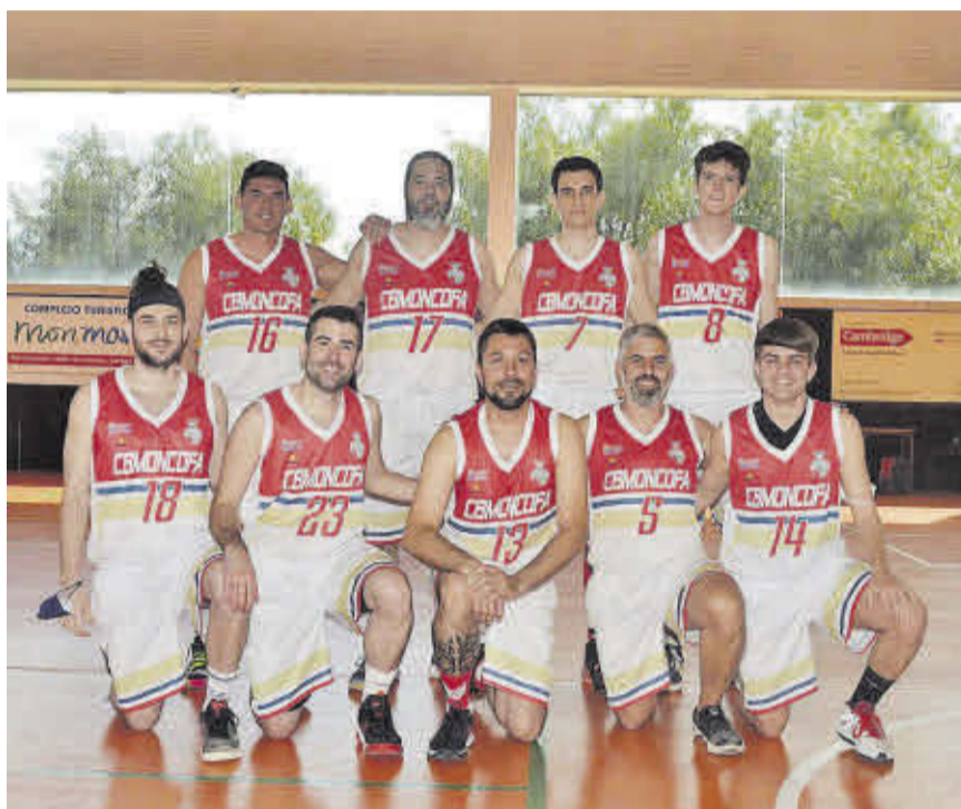
El sénior, buque insignia de este club, ha luchado hasta el final para alcanzar el 7º puesto.

Por su parte, el equipo infantil ha finalizado la liga regular en tercera posición y ahora está jugando el Trofeo Federación, como premio a la gran temporada realizada. Los alevines han alcanzado la quinta plaza en la tabla, en una temporada ilusionante en la que ha competido contra grandes clubs y también está disputando el Trofeo Federación. La plantilla del equipo benjamín ha realizado una temporada muy completa y los prebenjamines siguen su aprendizaje.