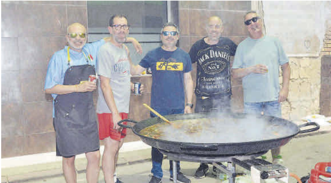
Agrupaciones de amigos y peñistas se juntaron para elaborar el plato típico valenciano en una jornada muy especial.