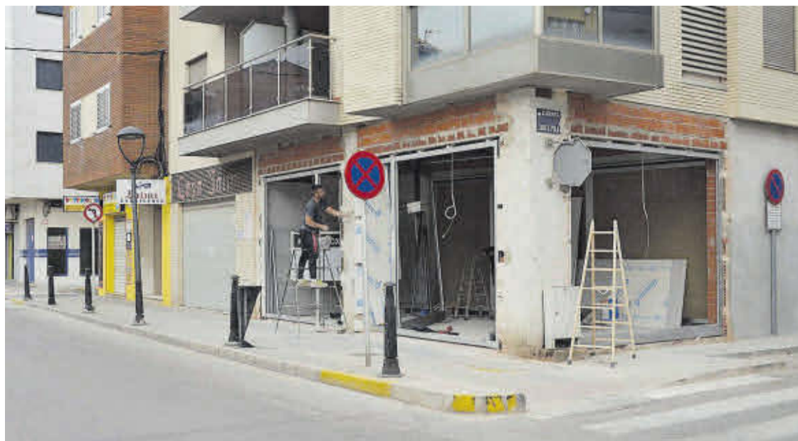
Caixa la Vall San Isidro, la nueva oficina bancaria ubicada en la avenida del Puerto, abrirá durante la temporada estival.