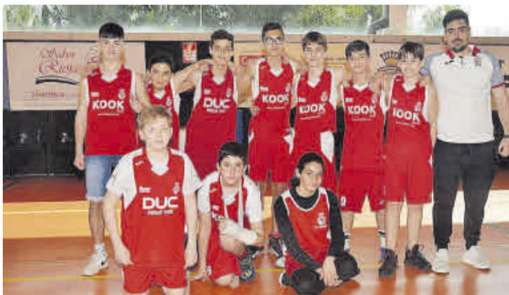
El equipo infantil cuenta con jugadores que suman mucha calidad.