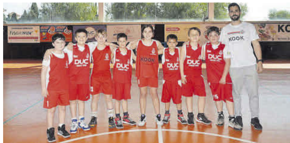
El equipo benjamín ha cuajado un temporada muy completa y digna de recibir los aplausos.