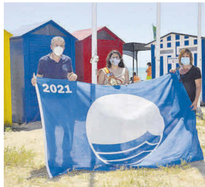
Les quatre banderes blaves onejaran en Grau, Masbó, Estanyol i Pedra Roja.

Moncofa ha tornat a rebre el suport a la seua bona faena en aconseguir que la bandera blava torne a onejar enguany en quatre platges del municipi. Així, han sigut reconegudes com a mereixedores de la bandera blava les platges del Grau, l'Estanyol, Masbó i Pedra Roja.