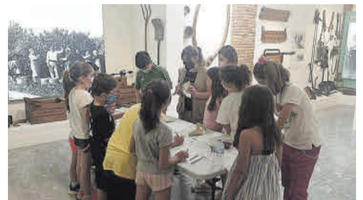
Los niños y niñas tuvieron una actividad ligada al mundo de la arqueología.