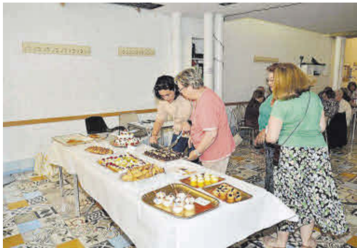
El concurso de dulces y salados congregó a un buen número de asistentes.