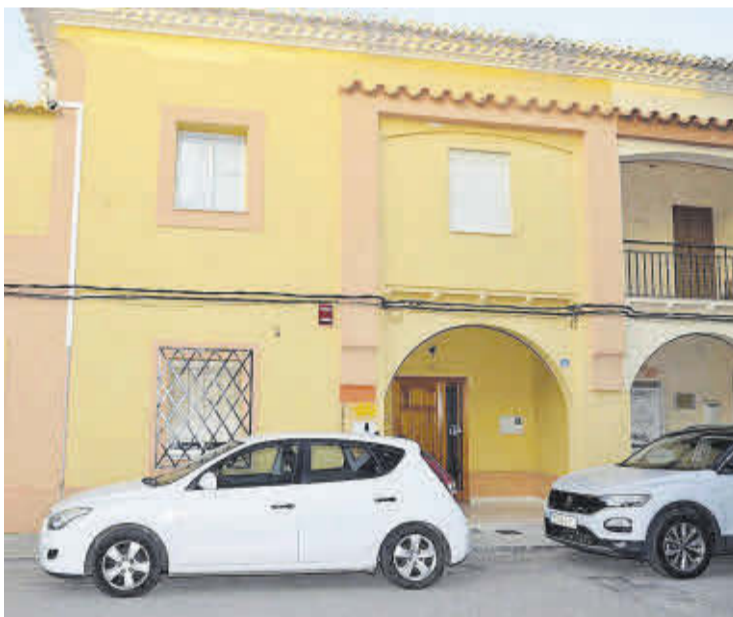
La planta superior del inmueble del Archivo Municipal albergará el Casal Jove.

El consistorio destinará alrededor de 800.000 euros a la mejora de la red de alcantarillado