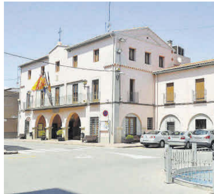
Las consultas e incidencias serán recibidas por los técnicos municipales.

El Ayuntamiento de Moncofa se ha unido a los más de 500 municipios, a nivel nacional, que disponen del servicio Línea Verde. A través de este canal de comunicación directo, los vecinos pueden poner en conocimiento del consistorio aquellos desperfectos que detecten en la localidad. Gracias a esta herramienta de participación ciudadana, el Ayuntamiento pretende conocer las necesidades del municipio y, de este modo, poder dar solución a las cuestiones comunicadas.