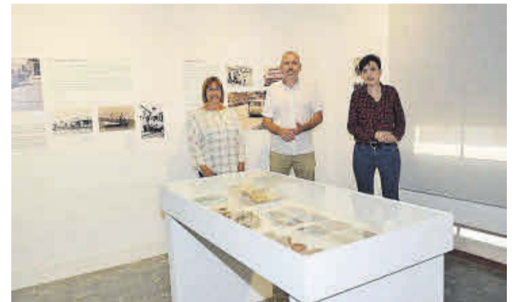
Las autoridades municipales visitaron el museo junto a su coordinadora.