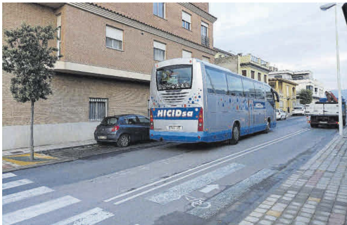
La localitat s'ha quedat amb un servei mínim d'autobús que els usuaris utilitzen per a anar a Castelló i València.