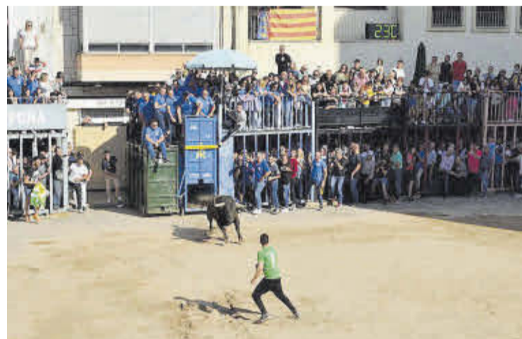
Las exhibiciones taurinas centraron los actos en toda la jornada del sábado 14.