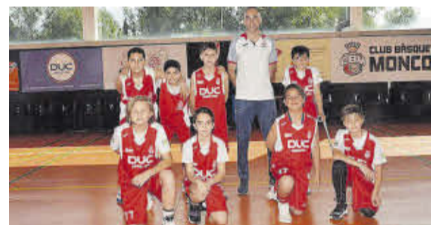
Este grupo de alevines ha alcanzado la quinta posición en la liga.