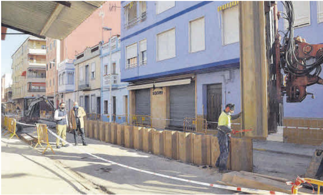
Las mejoras de la red de alcantarillado de la playa se realizarán con una gran parte del remanente de tesorería.