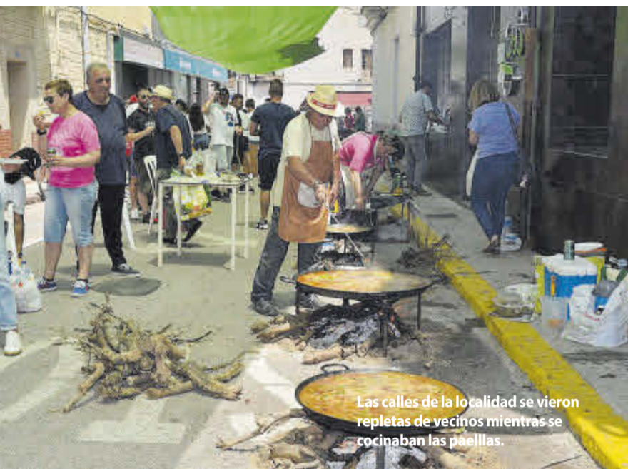
Las calles de la localidad se vieron repletas de vecinos mientras se cocinaban las paellas.