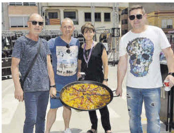
Pie de foto.