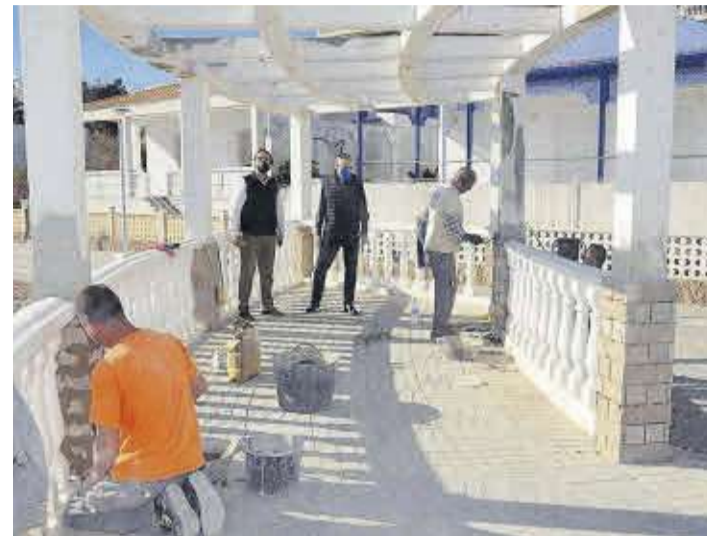
Las autoridades locales comprueban los trabajos de rehabilitación.

Actualmente se están llevando a cabo trabajos de mantenimiento en los dos miradores existentes en el paseo marítimo de Moncofa. Las actuaciones se están centrando en la rehabilitación de todos los materiales que dan forma a los miradores, ya que se encontraban en muy mal estado de conservación, debido a que desde que se construyeron en el año 1992 no han recibido un mantenimiento necesario para poder realizar una buena conservación.