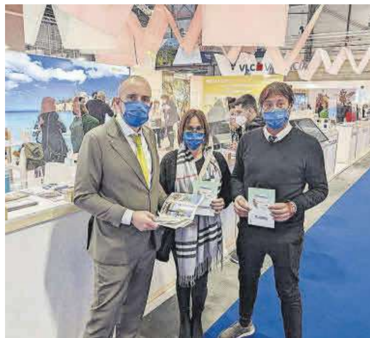
El alcalde junto a la edila de Turismo y el técnico de turismo en la feria de Madrid.