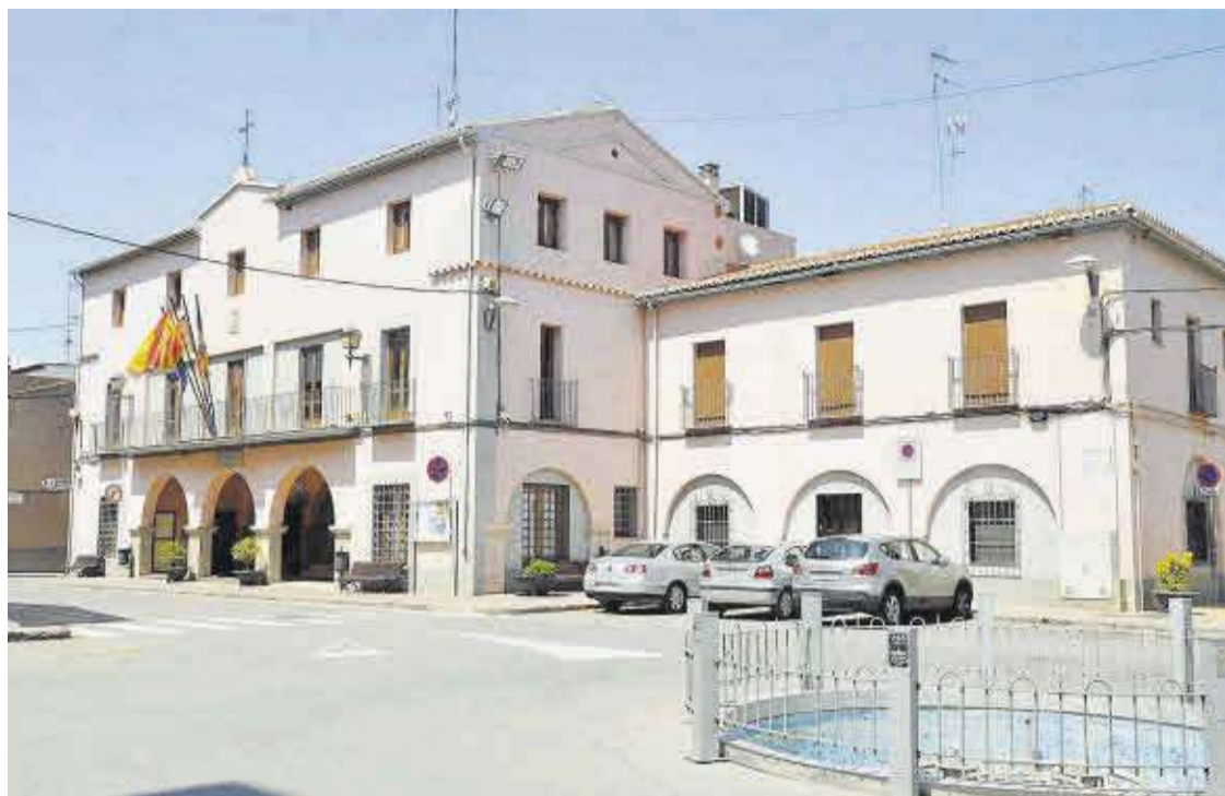
El área de Hacienda del Ayuntamiento ha procedido al pago de las facturas registradas hasta el día 14 de diciembre.