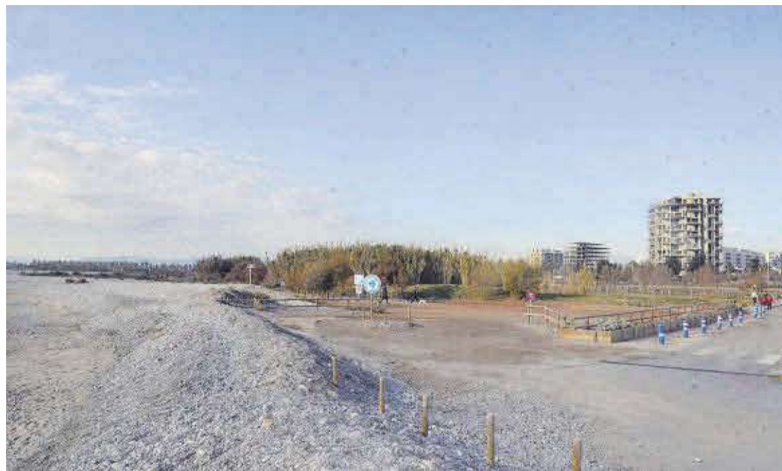
El nuevo deslinde propuesto por la Dirección General de Costas se adentra más de cien metros de la lámina de agua.

La extensión tutelada por Costas alcanza zonas verdes y solares de titularidad municipal