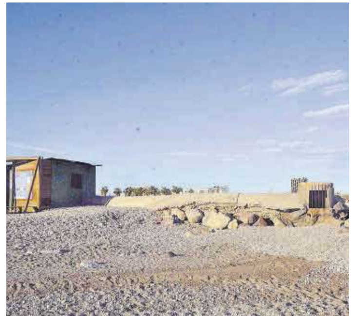
Actual infraestructura de l'estació de bombament a la zona de la Torre.

■ L'Ajuntament de Moncofa durà a terme la reparació de l'estació de bombament de la partida la Torre. Una infraestructura summament important per al bon funcionament del drenatge de la zona, tant de cultius, com de l'aigua de pluja que recullen les diferents sèquies existents a la zona. L'empresa Facsa, concessionària del manteniment de la xarxa de pluvials, estarà al capdavant de les feines que tenen un pressupost de 64.171, 82 euros.