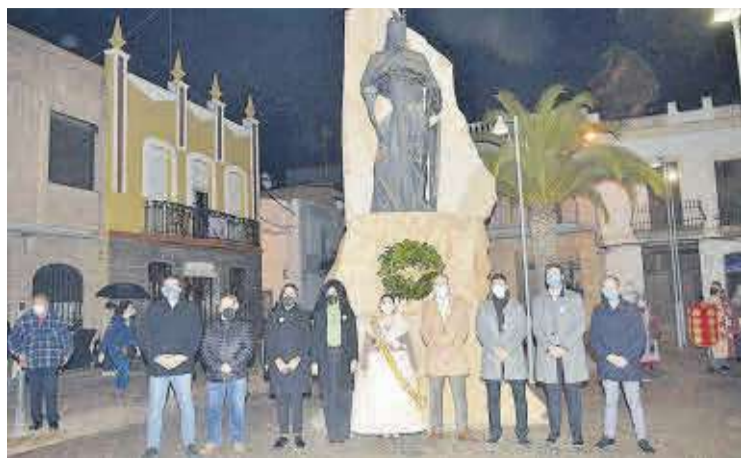
Totes les autoritats locals varen posar baix del monument del Rei En Jaume I.