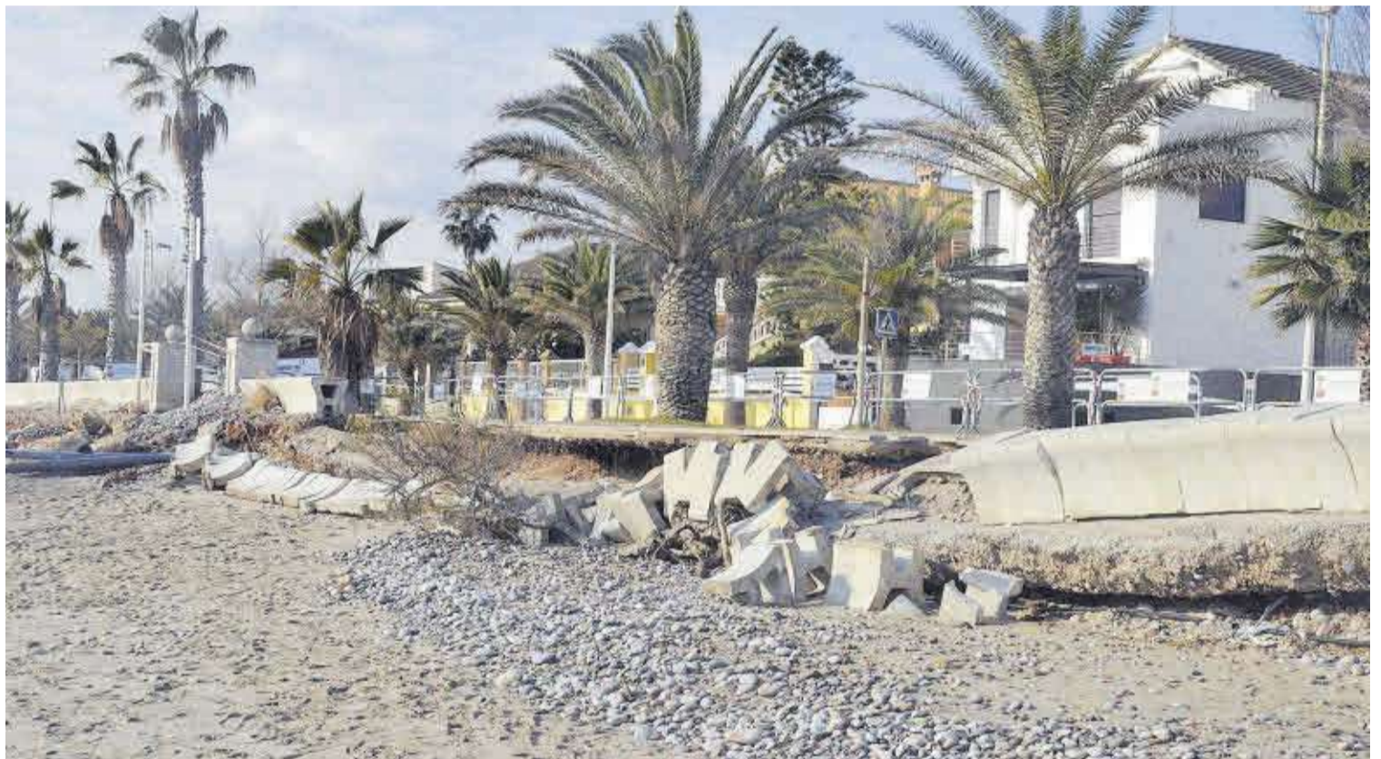
La inacción del Gobierno de España en el litoral de Moncofa está propiciando que los daños provocados por los temporales sean cada vez mucho más cuantiosos.