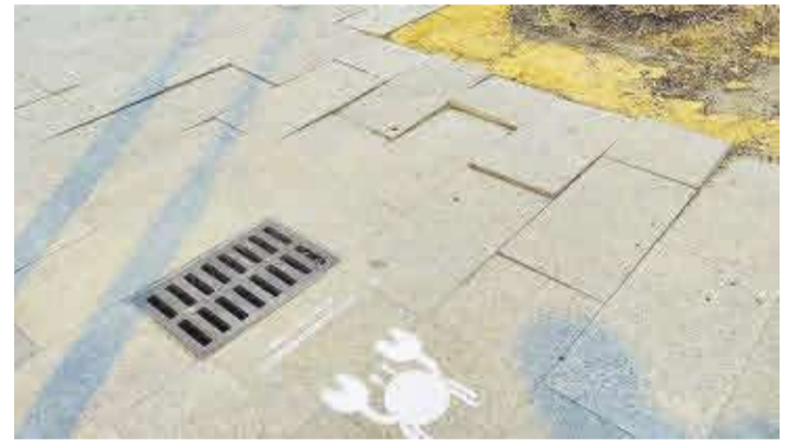
Desde el área de Medio Ambiente tratan de concienciar a la ciudadanía.

■ El Ayuntamiento de Moncofa pone en marcha una sencilla campaña que invita a la reflexión sobre las colillas y desperdicios que tiramos al suelo y acaban en los imbornales, abriéndose camino directo hacia nuestras playas.