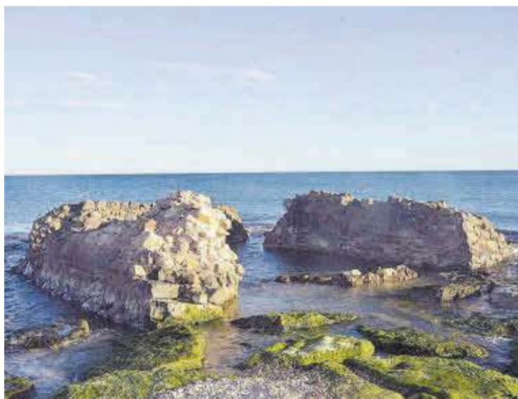
Desde hace muchos años los restos de la torre vigía están dentro del mar.

te el último temporal, y a consecuencia de la inacción de la propia Dirección General de Costas a la hora de reforzar las defensas del litoral de Moncofa, se registraron graves daños en la principal avenida del litoral del Grao de Moncofa, Mare Nostrum, que el Gobierno ni siquiera está dispuesto a reparar y que va a tener que asumir el Ayuntamiento si se mantiene esta actitud discriminatoria.