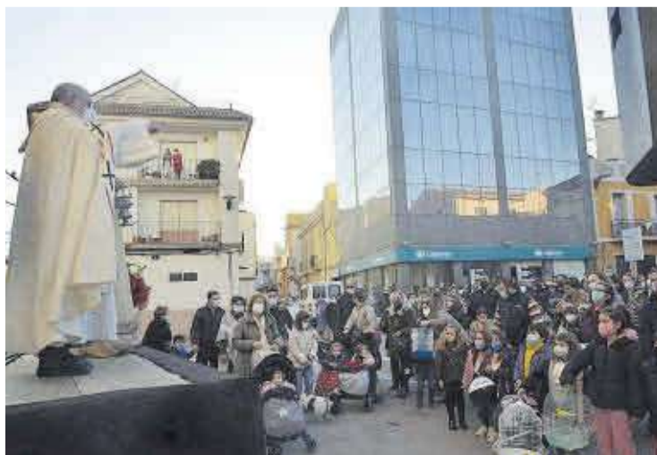
La bendición se llevó a cabo de manera global en la plaza de la Constitución.