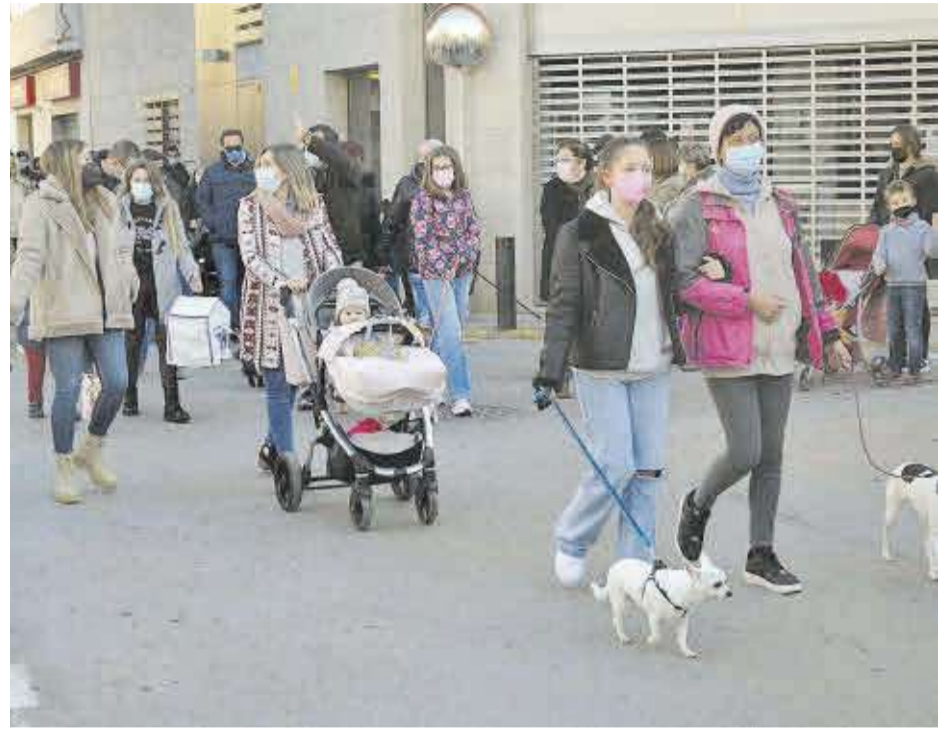
Un buen número de vecinos y visitantes participaron en el recorrido marcado para la ocasión.