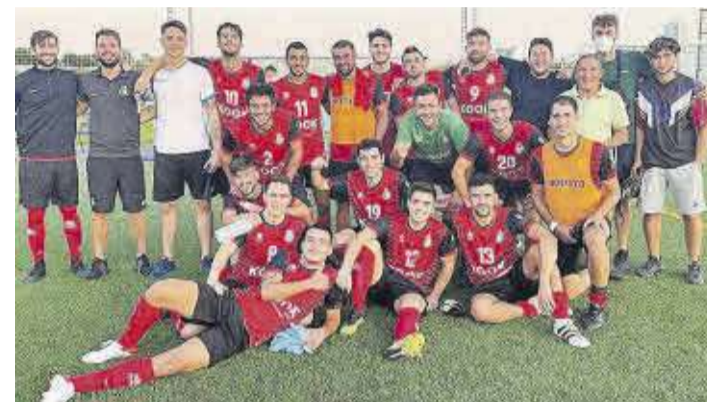
El Moncofa C.F. logra una de las mejores temporadas de su historia.

El Moncofa C. F. está llevando a cabo una excelente temporada. A día de hoy, el equipo no ha perdido ningún encuentro, logro que posiciona al club con las mejores estadísticas a nivel provincial.