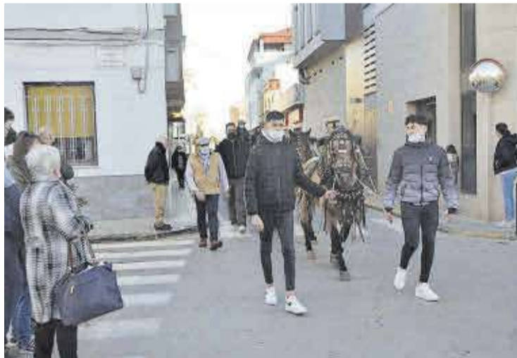
Las caballerías no faltaron a la cita de la tradicional fiesta en la localidad.

En esta línea, el alcalde de Moncofa, Wences Alós, manifestó que «al mismo tiempo que tenemos que ir recuperando actos y tradiciones no podemos olvidar que seguimos inmersos en una pandemia y los participantes de este acto han sido responsables en todo momento».