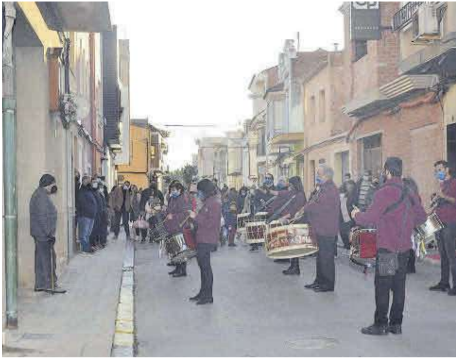
La sección de tambores y bombos del Cristo de la Agonía fueron los organizadores de este acto.