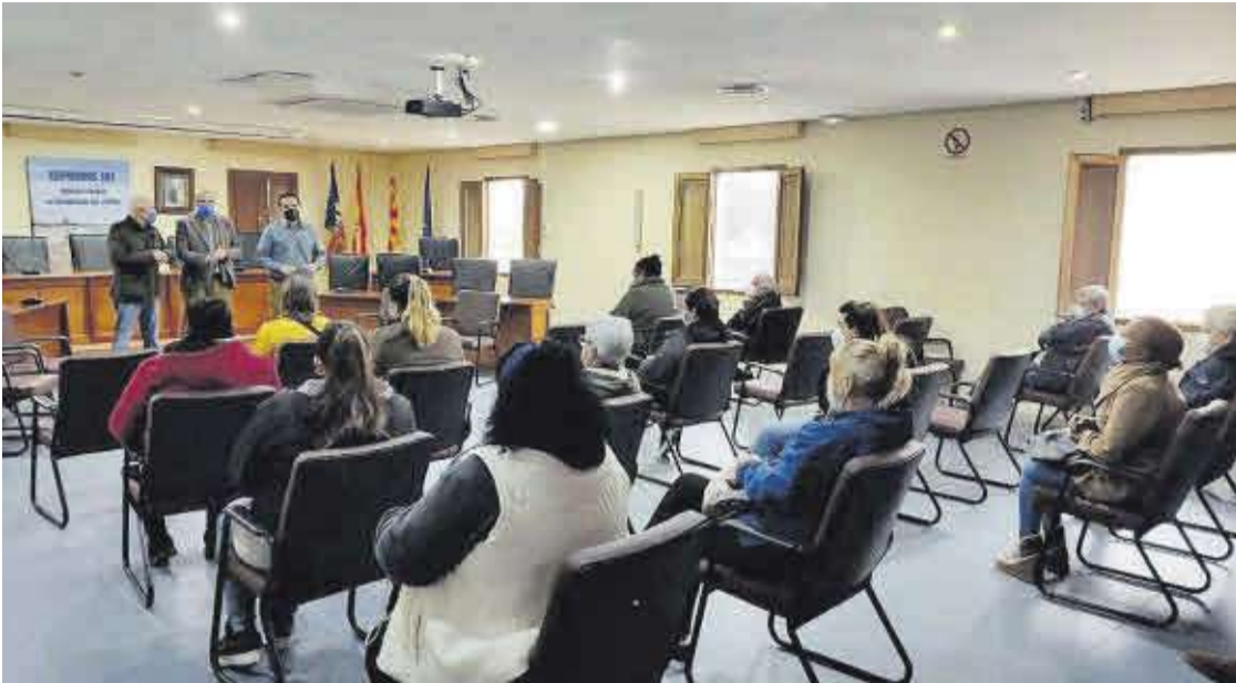
Les autoritats i l'equip directiu dels tallers d'ocupació han tingut una primera trobada abans d'iniciar els projectes.