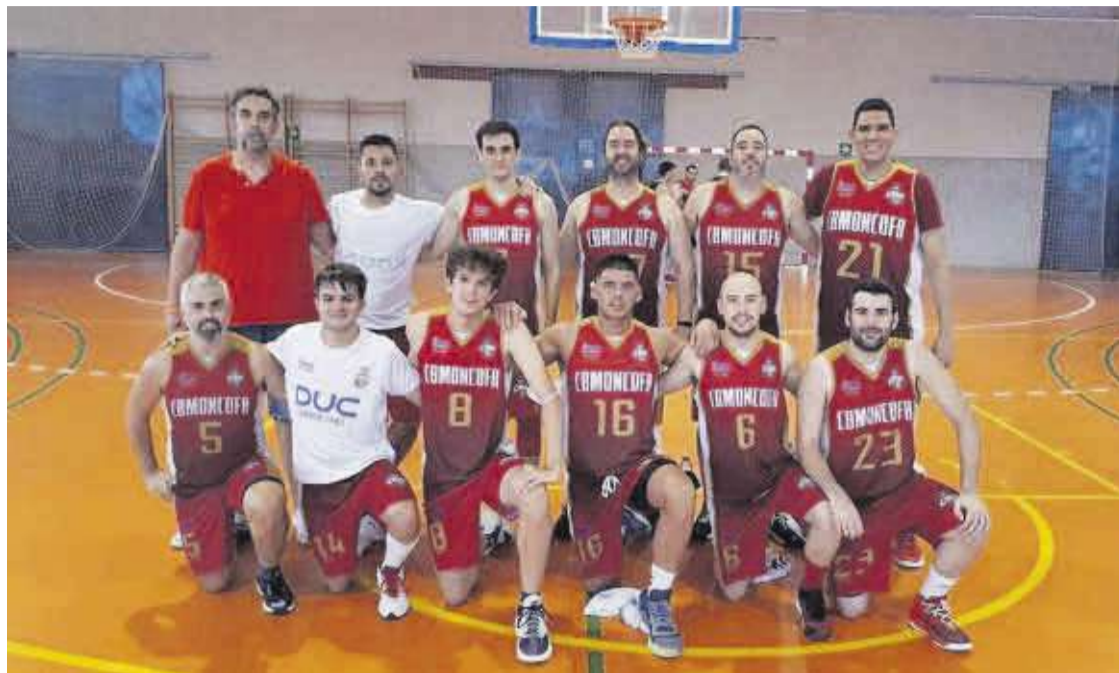
La plantilla del Kok Shop C.B. Moncofa está convencida de poder dejar al equipo en los puestos de cabeza de la clasificación.