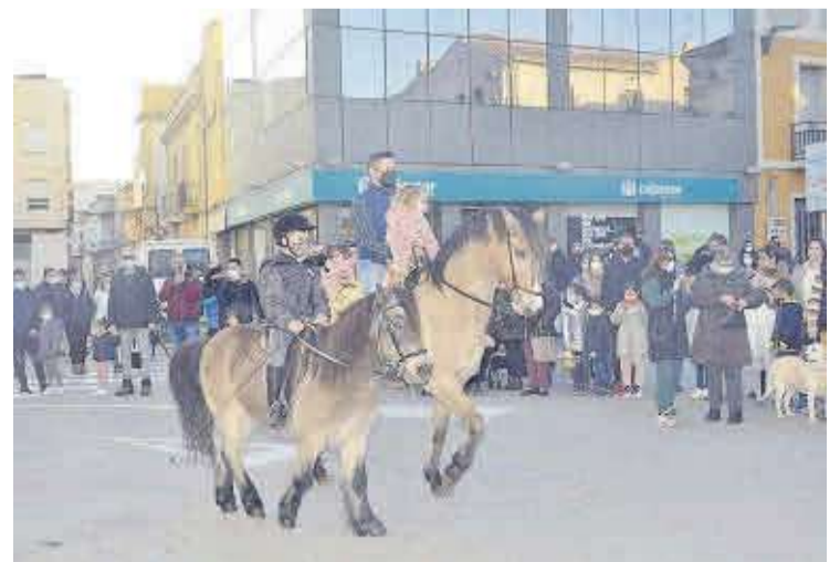
Los aficionados a los caballos tuvieron la oportunidad de participar en el acto.