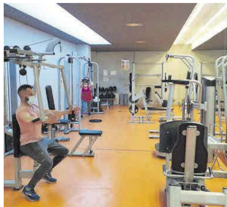
387 usuarios utilizaron las instalaciones del gimnasio municipal el año pasado.