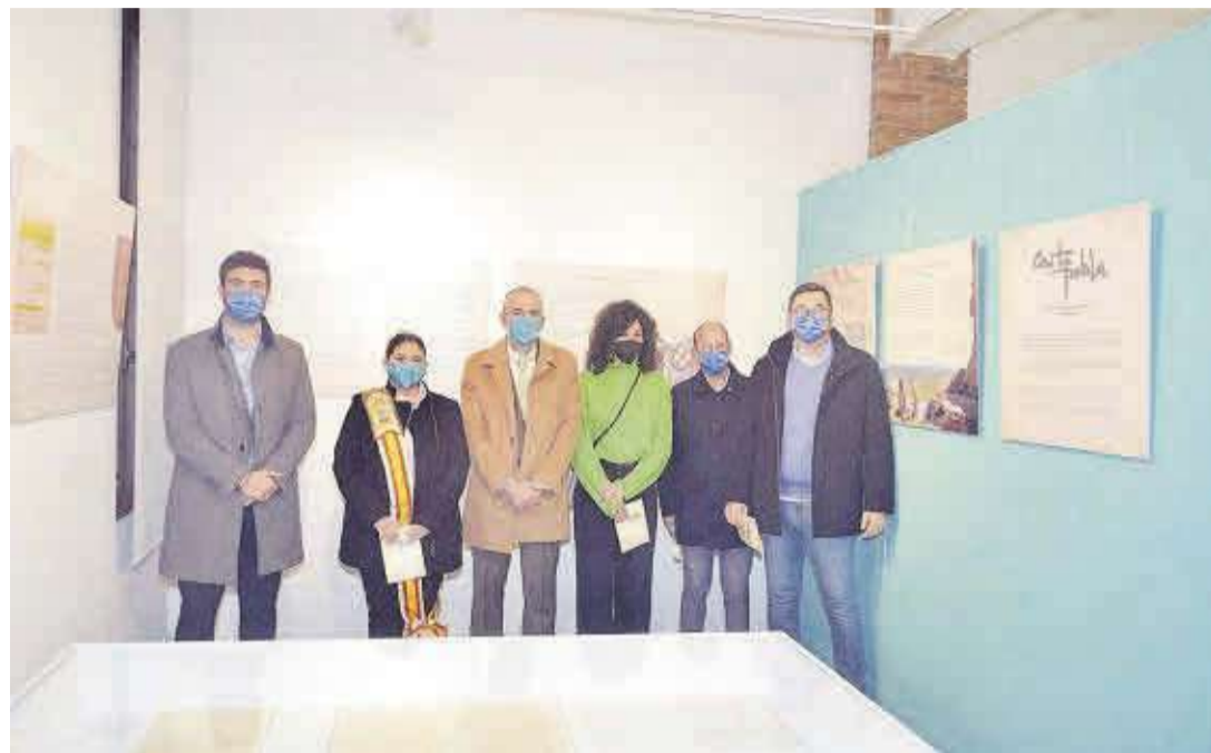
Las autoridades municipales encabezadas por el alcalde de Moncofa visitaron todas las áreas del museo local.

Actualmente se encuentra expuesta toda la documentación de la Carta Poble de Moncofa