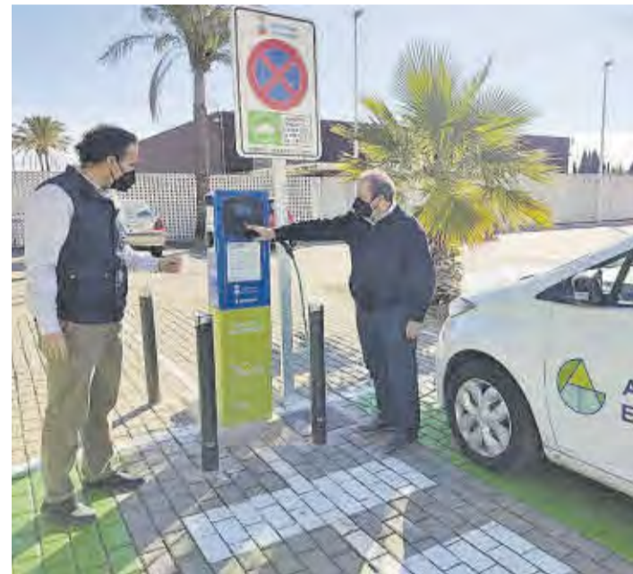
La zona de recàrrega es troba ubicada en els voltants del poliesportiu.

■ L'Ajuntament de Moncofa ja ha engegat el primer punt de recàrrega per a vehicles elèctrics per fomentar l'ús de vehicles més sostenibles i respectuosos amb el medi ambient. Això ha estat possible gràcies a una subvenció de l'Institut Valencià de Competitivitat Empresarial (IVACE) de la Generalitat Valenciana, que ha assumit 10.612,80 d'una inversió total de 13.266 €.