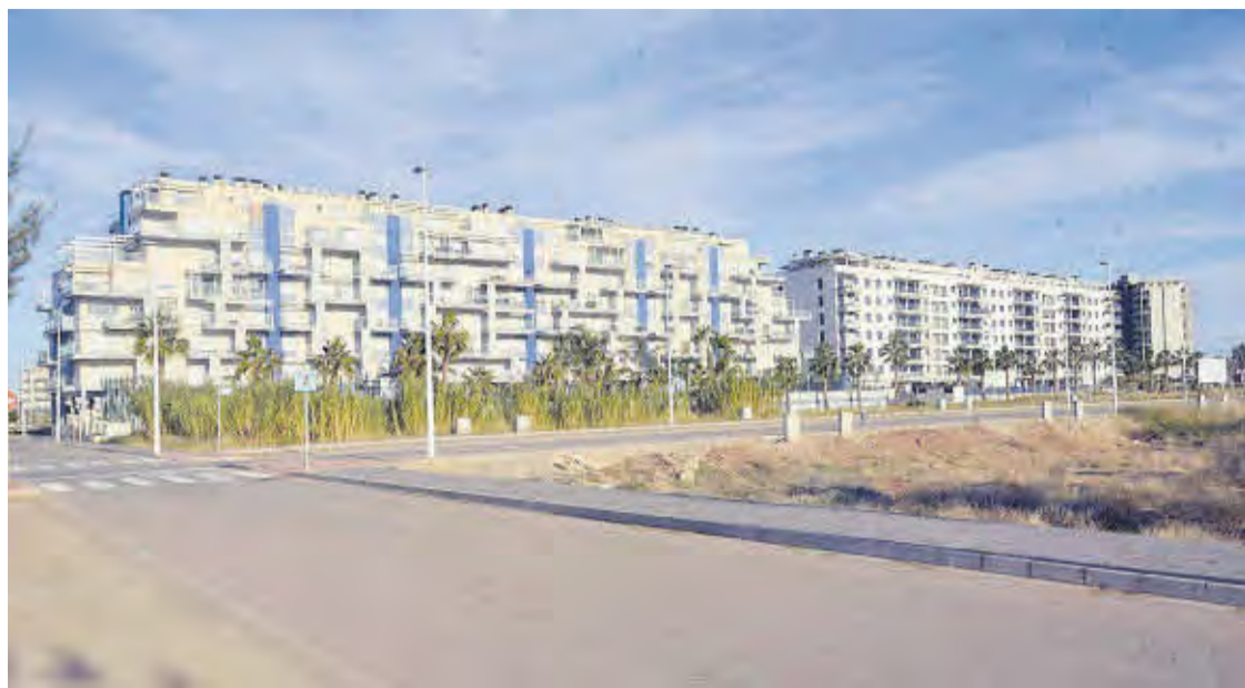
Els punts on encara queden vivendes per a vendre es troben quasi en la seua totalitat en llocs propers a la zona litoral.