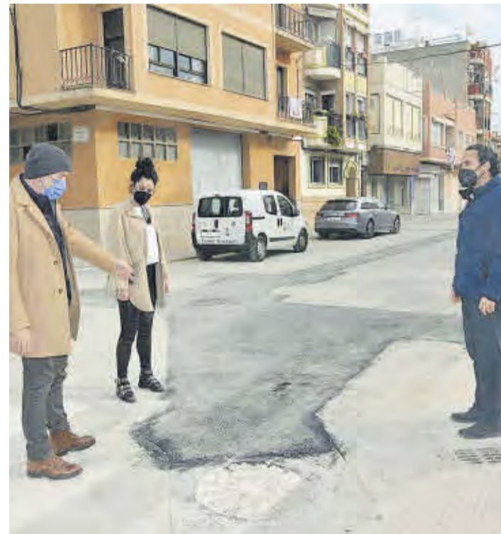
El alcalde y dos ediles comprobando los trabajos realizados en este vial.

El Ayuntamiento de Moncofa ha finalizado los trabajos de la mejora de la red de alcantarillado en la Avenida Ramón y Cajal, que ha comportado la colocación de un nuevo colector que transcurre por el centro del vial. El proyecto ha contado con un presupuesto de 39.559,99 euros y está incluido dentro del Plan Reactivem Castelló de la Diputación Provincial, entidad que sufragará el coste íntegro de la obra.