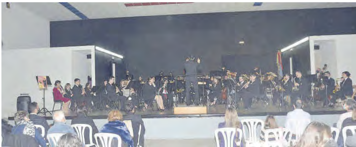
Los asistentes al concierto de la SUM Santa Cecilia de Moncofa, celebrado en el edificio polifuncional, disfrutaron del programa elegido para la festividad de 2021.

Como viene siendo habitual para la festividad de las bandas de música, la SUM Santa Cecilia de Moncofa preparó un concierto extraordinario, dirigido a