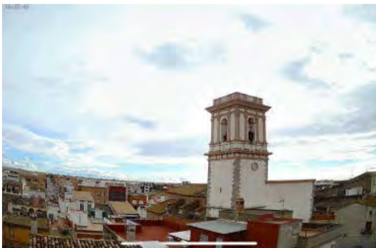
L'estació meteorològica es troba ubicada en la part exterior del centre La Murà.

L'Ajuntament de Moncofa ha signat un conveni amb Avamet, que és l'Associació Valenciana de Meteorologia, per a la instal·lació d'una estació meteorològica al terme municipal de Moncofa. Aquesta infraestructura s'ha instal·lat al centre de