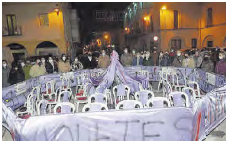
Una exposició amb el nom de les dones assassinades es va exposar a la plaça.