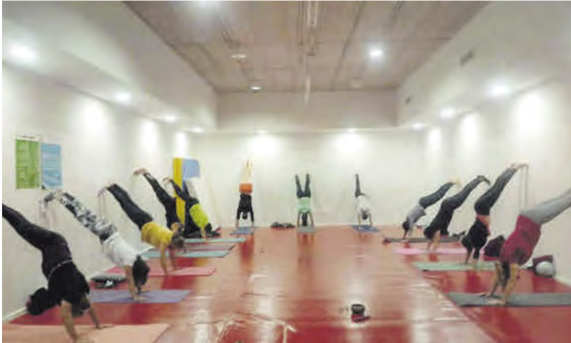
El yoga es una de las modalidades deportivas incluidas en la programación confeccionada para este año.

La concejalía prevé un importante aumento de las inscripciones a partir del año nuevo