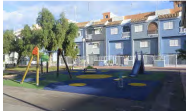
Un bon nombre de parcs infantils del poble han sigut millorats i actualitzats.