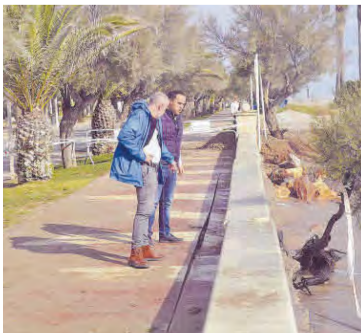
El alcalde de Moncofa comprobando los daños en un tramo de la acera litoral.

La zona del litoral de la urbanización La Torre- Camí Cabres también ha sufrido graves daños, ya que el agua del mar inundó el tramo del pequeño tramo de paseo que Costas ha construido y el agua se ha adentrado dentro de las propiedades privadas. «La verdad es que vienen meses complicados, porque en invierno es cuando aparecen los temporales marítimos de más intensidad», recuerda el primer edil de Moncofa.