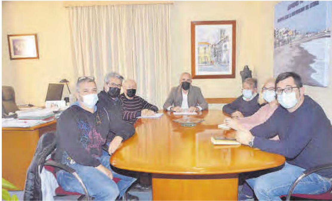
Los representantes de la plataforma Espigones Ya -Platges de Moncofa-, en la reunión mantenida en el Ayuntamiento.

Alós, ha indicado que «tenemos la imperiosa necesidad de poner encima de la mesa la situación tan penosa que estamos pasando en nuestro litoral y queremos mostrárselo a la propia Subdelegada». Todos los representantes de la platafor-