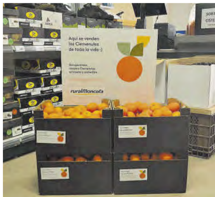
Rural Moncofa ofereix clemenules de La Plana en la Cooperativa i al Consum.

Finalment, el president, els i les membres del Consell Rector i els treballadors i treballadores de Rural Moncofa volem desitjar unes bones festes i un Felix Any Nou a tots els veïns de la localitat.