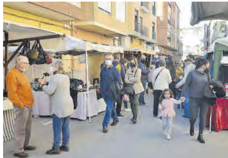
Veïns i visitants varen adquirir productes en els nombrosos punts de venda.

tall de punts d'interès que existeixen en aquest esdeveniment. També ha afegit que «de cara a la recta final d'any seguirem programant activitats i esdeveniments d'aquestes característiques, amb la finalitat d'atreure