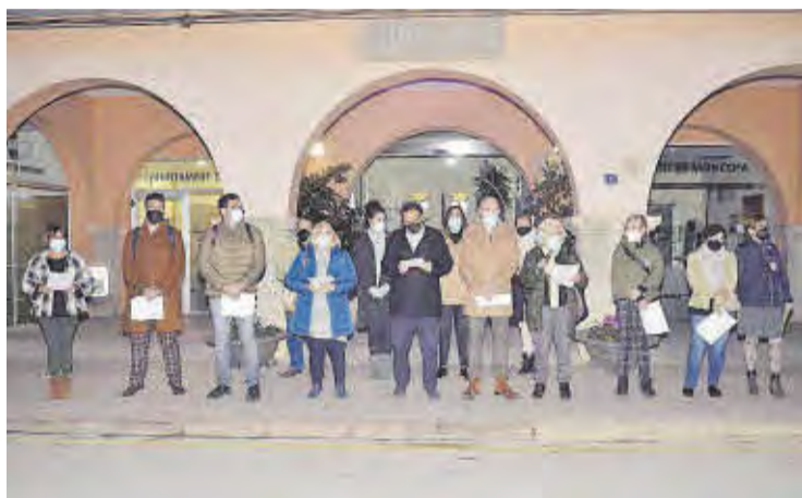
Autoritats i membres de l'Associació Carmen de Burgos llegint el manifest.

Per una altra banda, està en marxa la II Escola municipal d'Igualtat i Prevenció de la Violència de Gènere. El saló d'actes de la casa de la cultura és el lloc escollit per a dur a terme aquesta iniciativa encaminada a ajudar a les dones, que realment són les que han de conèixer de prop totes les situacions davant de la violència i com tractar de lliurar-se i al