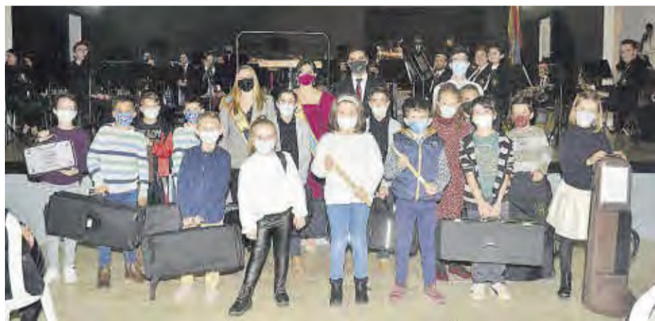
Este grupo de niños y niñas recibieron su nuevo instrumento para poder seguir formándose.

Desde el concierto de las navidades de 2019, la banda de música no había podido celebrar ningún concierto en el polifuncional