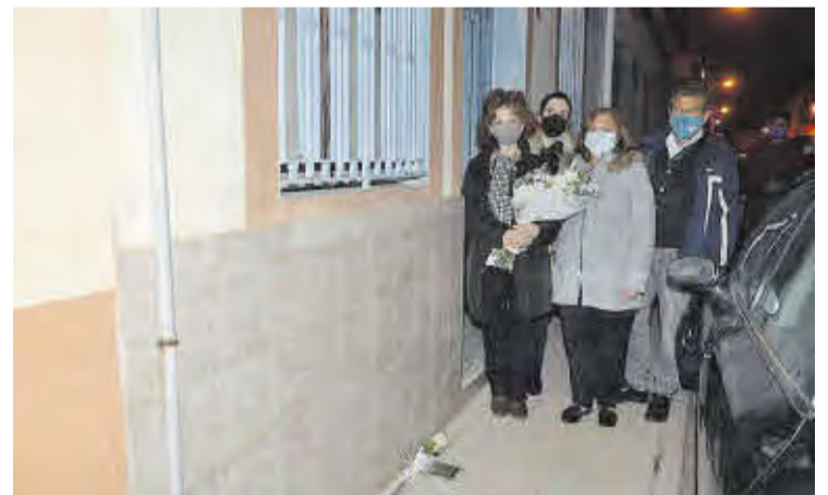
Bernardo Lairón vivió en la calle Villarreal y en su casa se ha colocado la placa.