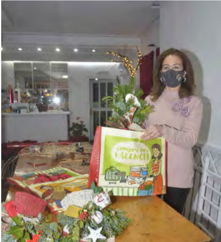
El comerços de la localitat tenen borses de rafia para donarles als seus clients.

L'àrea de Comerç, junt a la Xarxa Aviva, ha donat borses als comerços per als seus clients