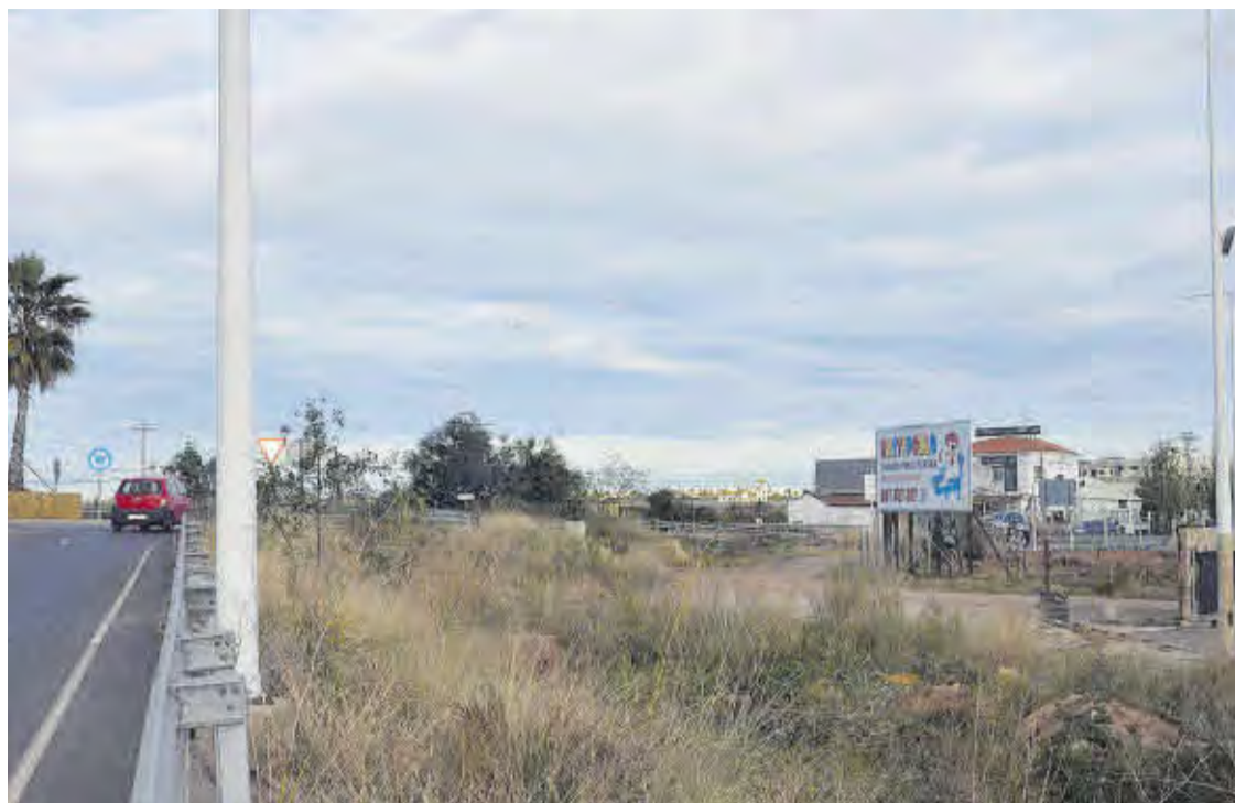
El trazado litoral del AVE, a su paso por Moncofa, transcurrirá a escasos ciento cincuenta metros del casco urbano.