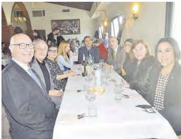
La taula presidencial en la que va estar l'alcalde, reina de les festes i autoritats.

A causa de les restriccions sanitàries, les taules no van superar els deu comensals i, abans d'accedir al saló, es van mostrar els passaports sanitaris. L'alcalde de Moncofa es va dirigir a tots els presents, recordant «a tots els veïns que durant aquests gairebé dos anys ja no es