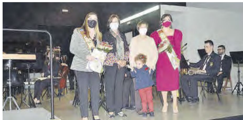
Representantes de la AEC de Moncofa hicieron entrega de un regalo a las Musas de la Música.

La SUM Santa Cecilia de Moncofa celebró la festividad de Santa Cecilia. Recordar que el año 2020, debido a la pandemia de la covid-19, no hubo ninguna celebración y este año se han incorporado los músicos y educandos de las dos anualidades, dado que durante el tiempo de confinamiento total o parcial, el aprendizaje siguió adelante y, por este motivo, las nuevas incorporaciones han trabajado de lo lindo para poder hacer realidad la meta de formar parte de la SUM Santa Cecilia, en el caso de los nuevos músicos, así como de iniciar el aprendizaje con el instrumento elegido, en el caso de los nuevos educandos