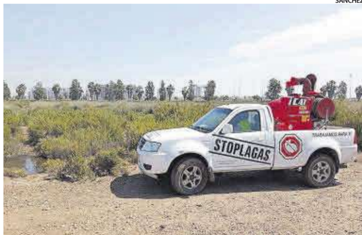
Les séquies són punts específics on poden proliferar les larves de mosquits.

L'Ajuntament de Moncofa està duent a terme la intensificació del tractament per evitar la proliferació de mosquit tigre.