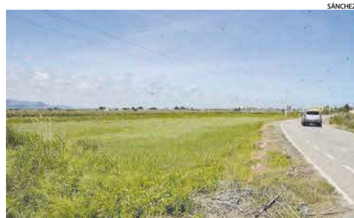
Terrenys que estaven inclosos dins del Pla d'Acció Territorial a Moncofa.

en el municipi, especialment a la zona de platja, ja que connectarà les noves urbanitzacions, ubicades en la zona de primera línia de costa, amb el nucli antic de la platja. Això permetrà millorar el trànsit i ajudar a que siga més fluid, especialment pensant en la major afluència de vehicles a l'estiu. Seguim en la línia del microubanisme, de les xicotetes actuacions que milloren sensiblement tant els serveis com la qualitat de vida dels nostres veïns».