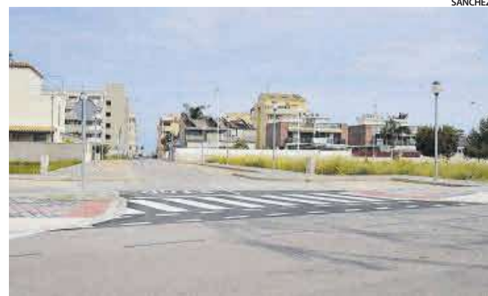
Un dels carrers que connecten els vials de la platja amb el Belcaire Nord.

Moncofa compta amb una xarxa de séquies en el terme municipal que sempre tenen aigua no estancada i que estan sempre baix control.