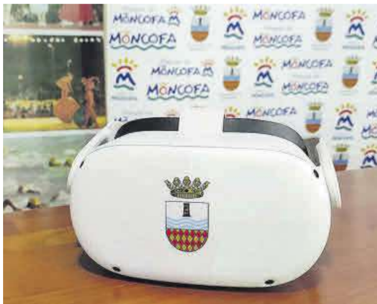
La concejalía ha proporcionado una gafas de realidad virtual VR a la Tourist Info.

información visual y descripciones de los lugares en diferentes idiomas e incentivando la promoción y la dinamización de Moncofa».