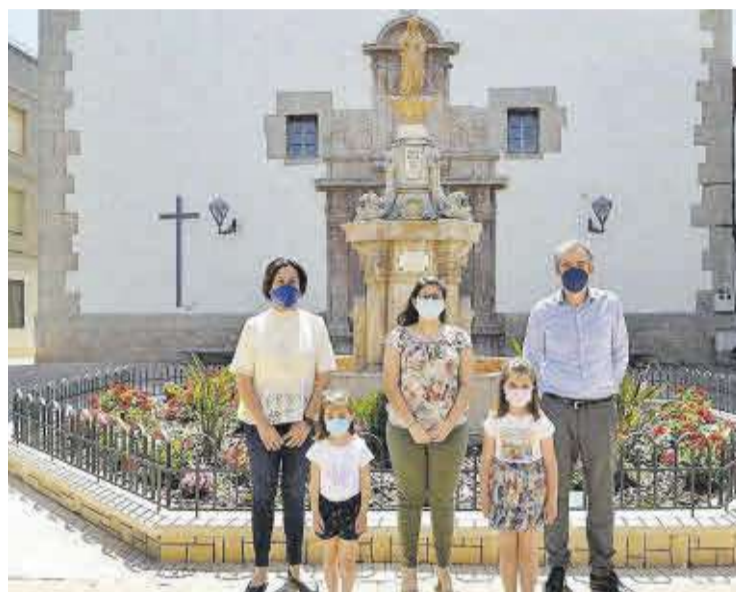
La futura reina de las fiestas y sus damas, junto a las autoridades locales.

La banda de música SUM Santa Cecilia de Moncofa también tendrá protagonismo en la semana de fiestas, con la celebración de un concierto en la plaza de la Constitución, y por lo que respecta a la Coral