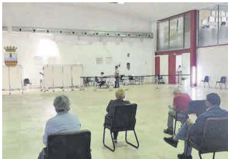
El edificio polifuncional se ha destinado a la vacunación masiva de los vecinos.

Con esta medida, desde el 25 de mayo los vecinos ya no tienen que desplazarse hasta Vila-real