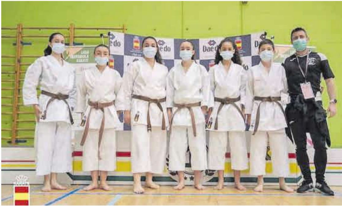
El grupo de karatekas del Club Karate-Do La Torre de Moncofa junto a su profesor en el Campeonato de Clubes de España.