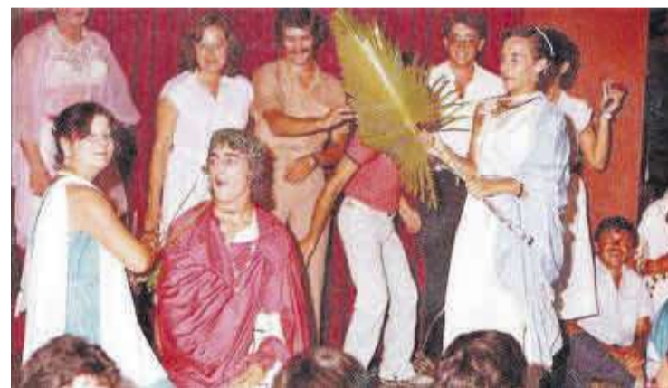
Ofrecía a los clientes música techno y gran número de espectáculos que formaron una combinación tan atractiva, convirtiéndola en un punto de encuentro.

muchas personas que se conocieron en su pista y más tarde 33 fueron pareja, llegando en muchos casos a ser matrimonio.