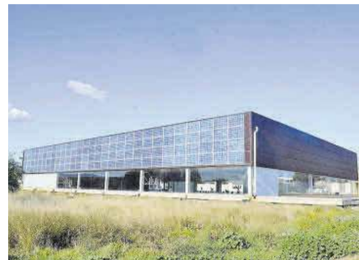
Las placas solares están instaladas en una de las fachadas laterales.

El consistorio ha llevado a cabo la puesta en marcha de las placas solares del polideportivo municipal de Moncofa, una acción que supondrá un ahorro energético que alcanzará el 60% de la facturación anual.