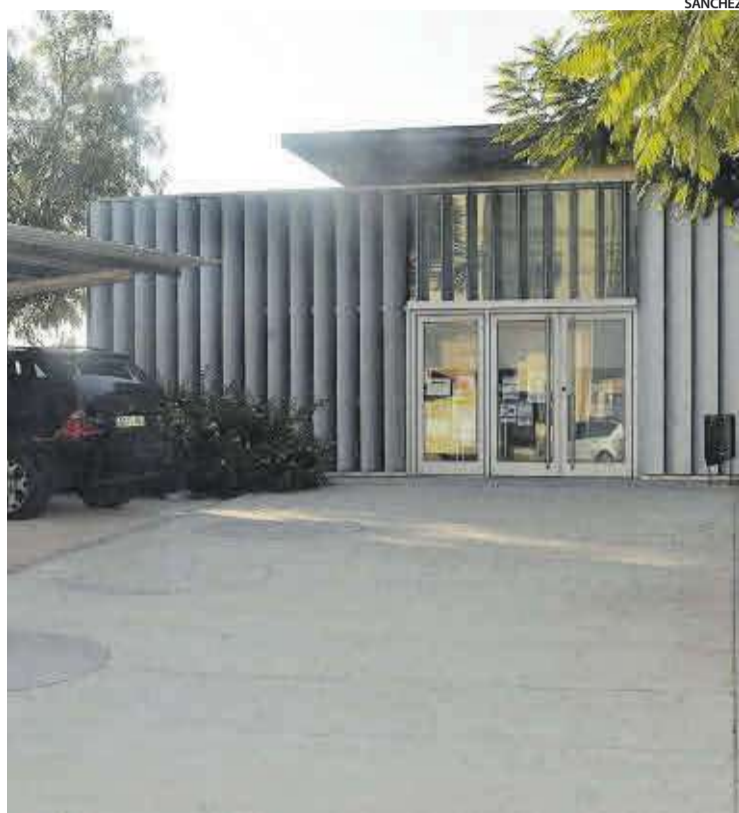
El centre de salut necessita una ampliació de les seues instal·lacions.

Els treballs compten amb un pressupost de quasi 1,2 milions d'euros i duraran uns 15 mesos