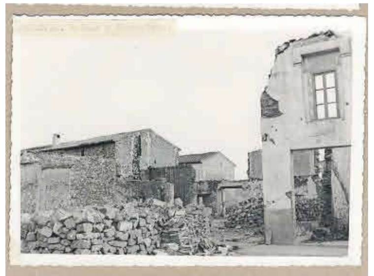
Las viviendas fueron desescombradas para volver a poder ser reconstruidas.

En Moncofa, el proyecto de Regiones Devastadas comenzó en 1940 y se alargó hasta el año 1957