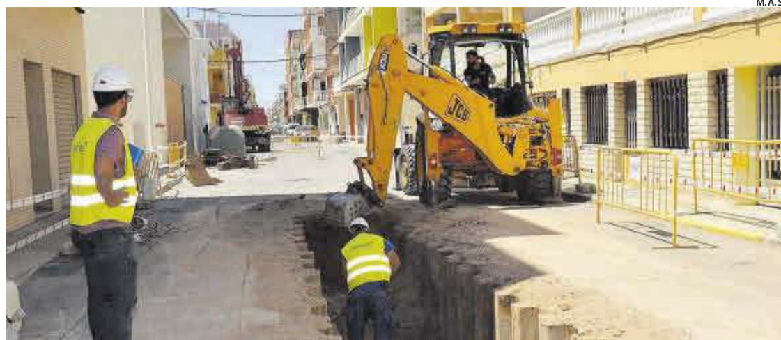
La red de alcantarillado de la playa será objeto de una mejora muy importante, que resulta necesaria e imprescindible.