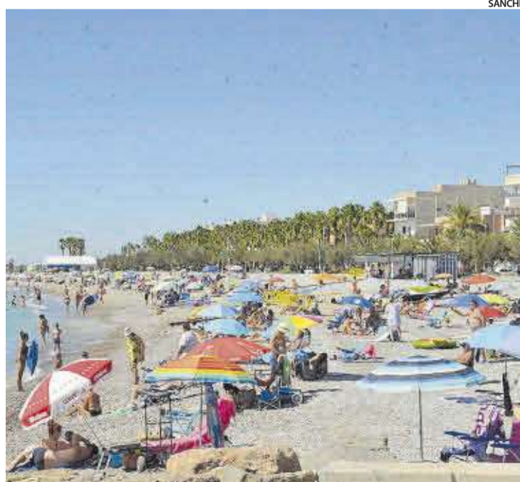
La medida adoptada aconseja a los usuarios no fumar en las playas este verano.