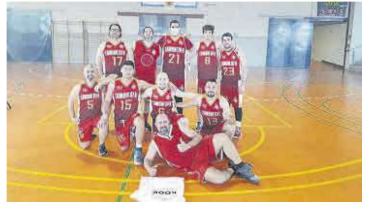
Actual plantilla del Club de baloncesto de Moncofa, en su cancha de juego.

Tras una difícil temporada, con la falta de jugadores y de continuidad en los entrenamientos por la pandemia, el equipo sénior ha estado jugando la permanencia y, gracias a la victoria obtenida a domicilio en la cancha del Puerto de Sagunto (42-50), certifica la permanencia en la categoría.