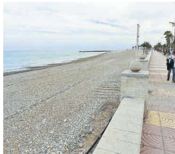
El día 1 de junio, las playas estaban preparadas para tomar el baño y el sol.

El Ayuntamiento ha llevado a cabo los trabajos de limpieza y acondicionamiento de las playas, gracias a los cuales, desde el 1 de junio, están en perfectas condiciones para el uso y disfrute de vecinos y visitantes.