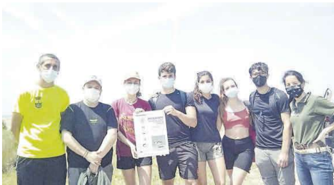
Los voluntarios realizaron trabajos medioambientales para mejorar la imagen del tramo del litoral que abarca L'Estanyol.