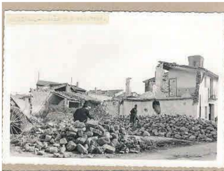
Trabajadores en tareas de separación de materiales para la reconstrucción.

Regiones Devastadas fue un organismo franquista que nació en enero de 1938, todavía en plena Guerra Civil. Después se convirtió en Servicio Nacional, en marzo, y en Dirección General, en agosto del mismo