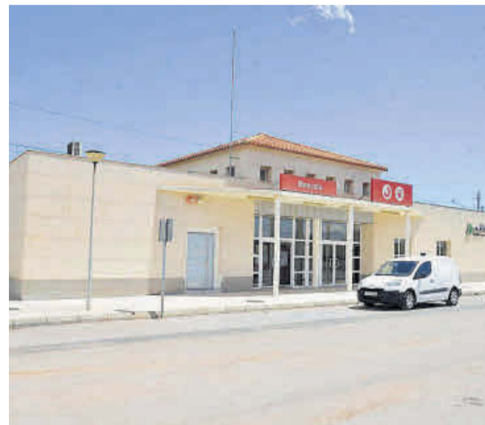
Moncofa contará con un acceso mejor y más directo a la estación de tren.

■ La Conselleria de Política Territorial, Obras Públicas y Movilidad ha dado el visto bueno a las alegaciones que en su día presentó el Ayuntamiento de Moncofa, respecto al proyecto de desarrollo de un polígono industrial de Nules, que se encuentra a escasos metros de la estación de ferrocarril y que no contempla la construcción de accesos a esta infraestructura.