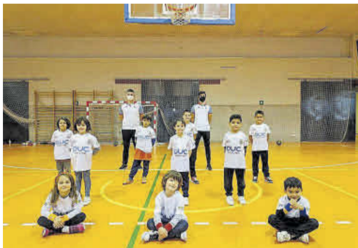
El equipo prebenjamín está empezando a conocer la base de este deporte.

A nivel competitivo el equipo sénior suma muchas bajas y nuevas incorporaciones, y está disputando encuentros en la categoría 1ª Zonal, donde demuestra que las ganas por hacerlo bien pueden a la adversidad. En cuanto al equipo infantil mixto, este se encuentra en la segunda posición de la tabla, con opciones de jugar la fase final de la liga. A pesar de lo complicado de la situación, la ilusión y el compromiso les empujan hacia adelante.