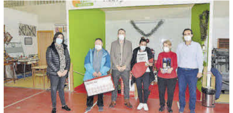
Els agraciats varen rebre els obsequis de mans de les autoritats municipals.