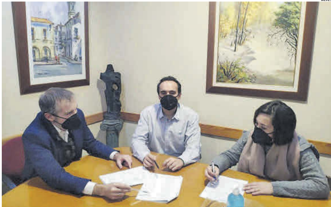
El alcalde de Moncofa, junto a varios ediles del equipo de gobierno que ha realizado una buena gestión económica.