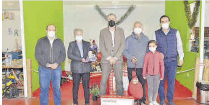
L'alcalde de Moncofa no va voler faltar als sortejos realitzats al desembre.