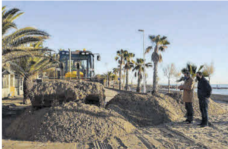
Els treballs de neteja han començat en la zona sud del litoral de la platja.

és una cosa que s'arrossega des de fa una dècada i l'efecte de les tempestes i de l'onatge no és només qüestió del canvi climàtic, sinó també de la falta d'actuacions del mateix Govern central, amb la barrera del Port de Borriana, que agreuja els efectes perjudicials cap al sud.