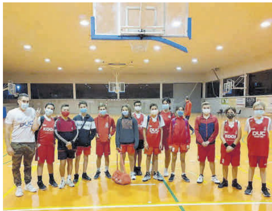
En las categorías inferiores, el único equipo que está inmerso en la competición es el infantil.