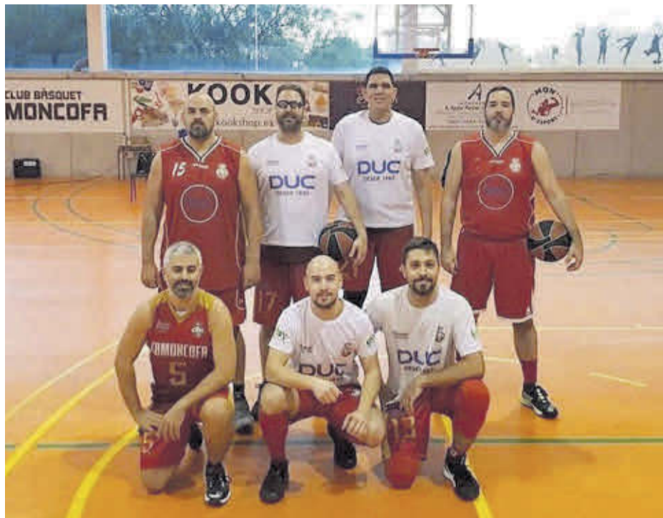
Esta temporada, el equipo sénior ha visto renovada parte de la plantilla respecto al año anterior.