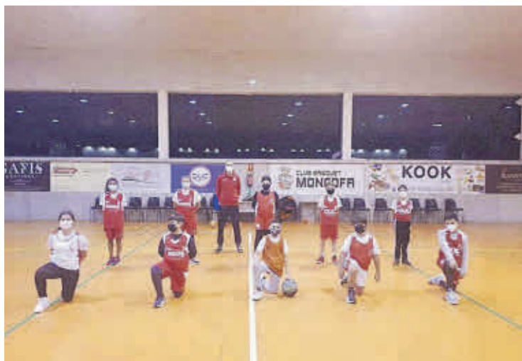
La pandemia ha privado de competir a la experimentada plantilla del alevín.