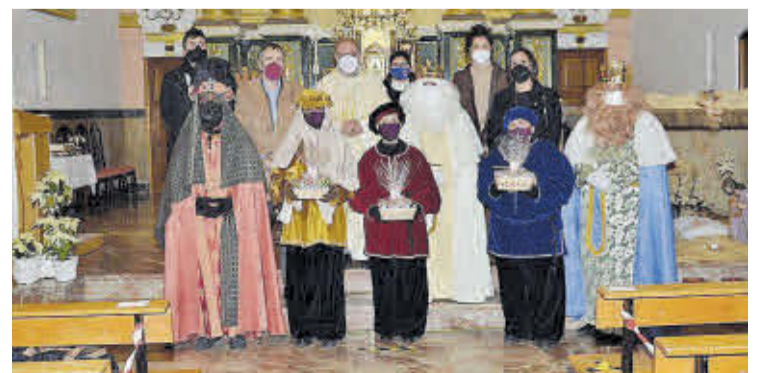
Els tres Reis Mags van realitzar l'ofrena a l'infant Jesús a l'església parroquial.