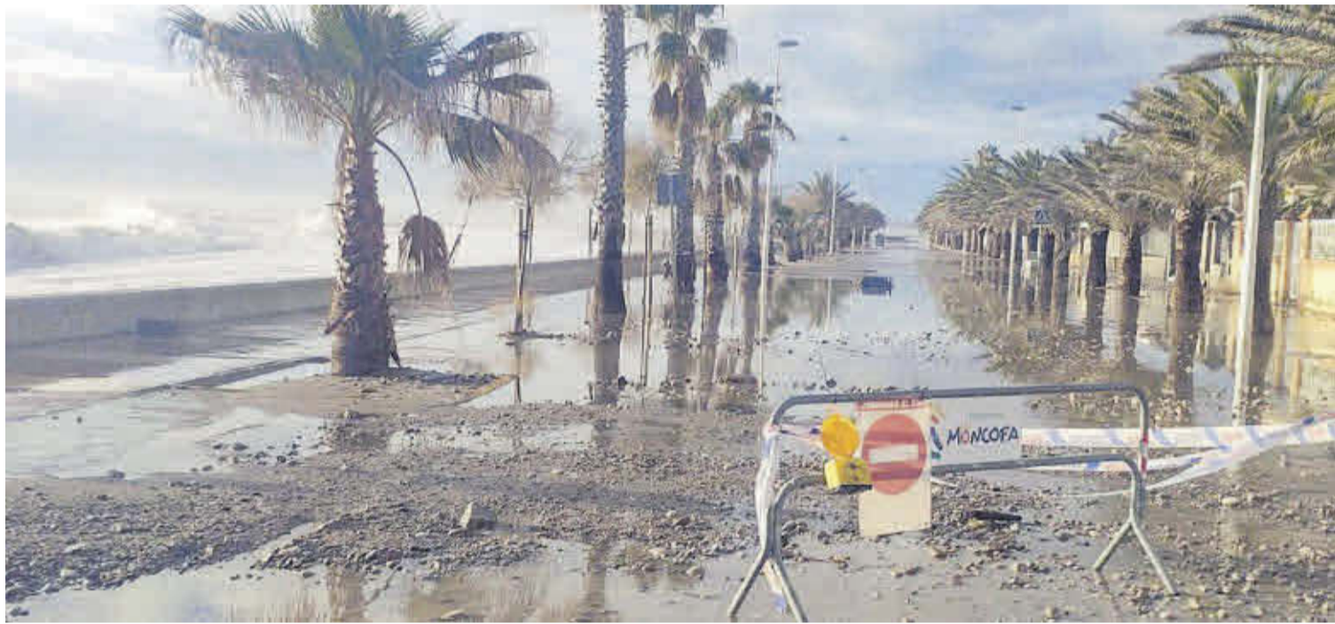
La tempesta 'Filomena' ha propiciat d'anys materials d'importància a la part sud de l'avinguda Mare Nostrum, al passeig marítim així com a la zona de La Torre.

La realitat és que aquesta falta d'infraestructures al litoral