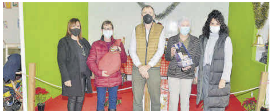
En els cinc sortejos els tres premis van ser una caixa de Nadal, un pernil i dues ampolles de vi.