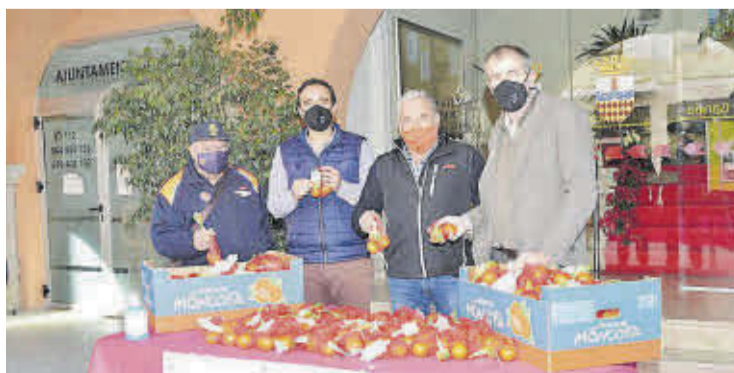
El consistori va fer campanya de 'Gallets de taronja' per a la nit de Fi d'Any.