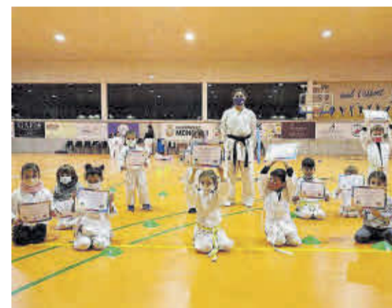
Los grupos de alumnos infantiles, durante la entrega de diplomas de aprovechamiento del primer trimestre.