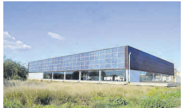
Las placas solares se encuentran instaladas en un lateral del polideportivo.

Cabe señalar que, en su día, el Ayuntamiento de Moncofa llevó a cabo la cesión de los 12.000 metros cuadrados que ocupará este nuevo espacio educativo, que se ubicará casi entre el casco urbano de Moncofa y la playa. Por otra parte, es necesario recordar que Moncofa es el único municipio de toda la Comunitat Valenciana que supera los 5.000 habitantes y que no cuenta con ningún IES.