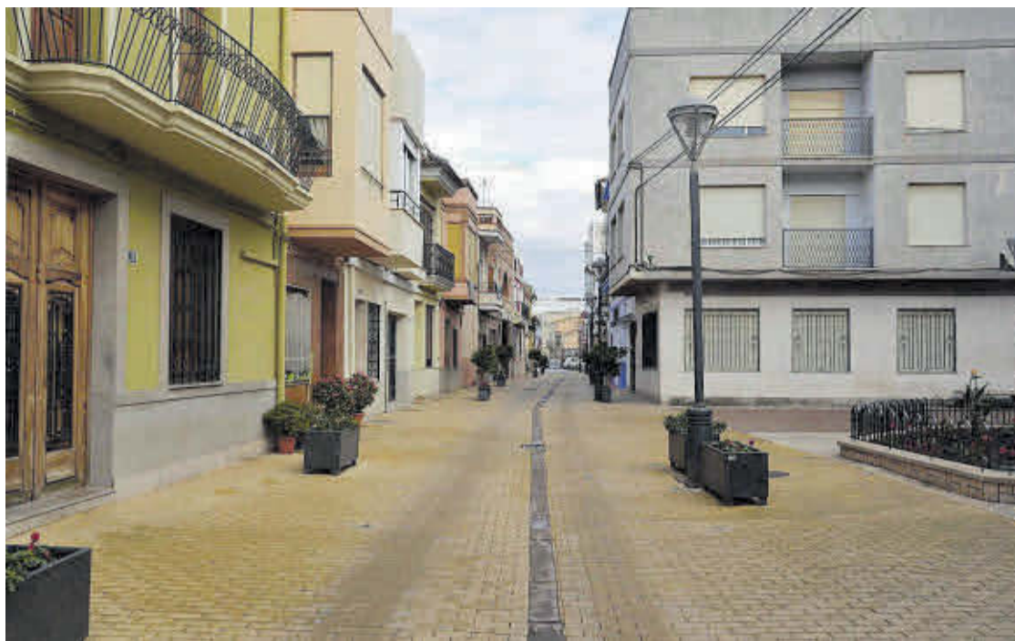
El carrer Major, la plaça de l'església i el propi monument i les restes de la muralla seràn llocs que voràn els cicloturistes.