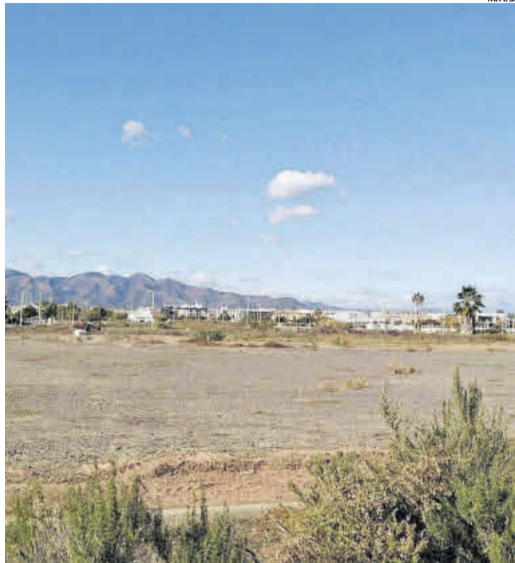
Los terrenos en los que está prevista la construcción del futuro instituto.

El futuro instituto Palafangues tendrá una extensión de 12.000 metros cedidos a la Conselleria