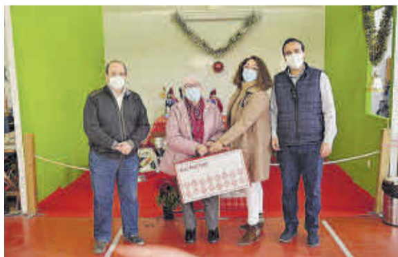
El primer premi va ser una caixa de productes nadalencs.