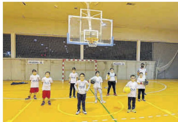
El equipo benjamín cuenta con la base de jugadores de la temporada anterior.