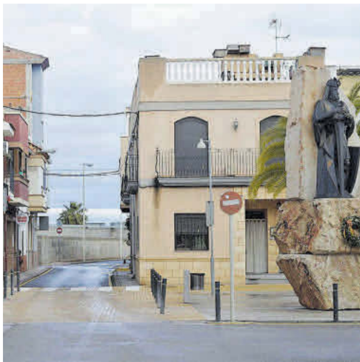
La plaça del Plà amb l'estàtua del Rei En Jaume i també la prodran visualitzar.

La ruta que transcorre per Moncofa s'inicia a Borriana i fins Almenara, i els cicloturistes podran conèixer de primera mà tots els punts d'interès que es