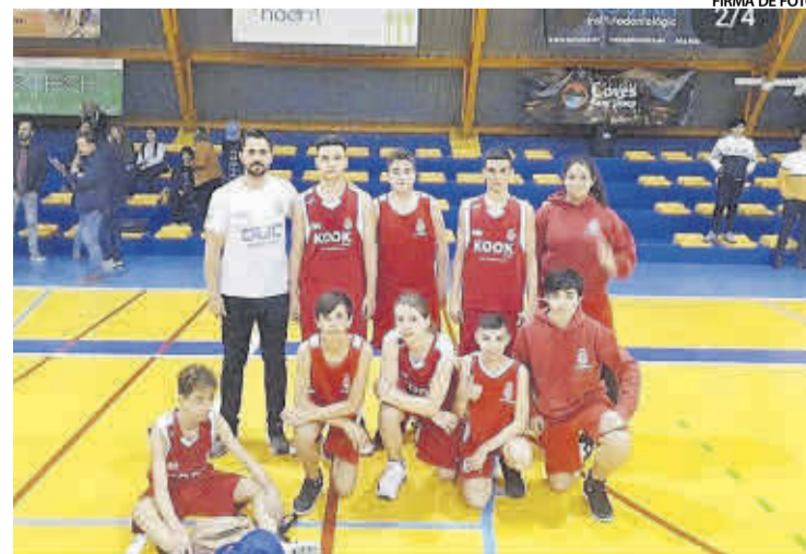
La plantilla del equipo cadete no compite, pero se exprime en los entrenes.