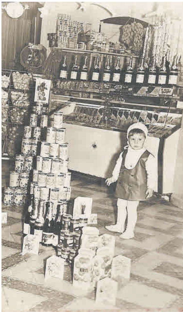
La localidad ha visto cómo han ido desapareciendo los comercios cada día.

Cuando vamos a pagar, si observamos, cada vez se paga menos en metálico. Lo hacemos