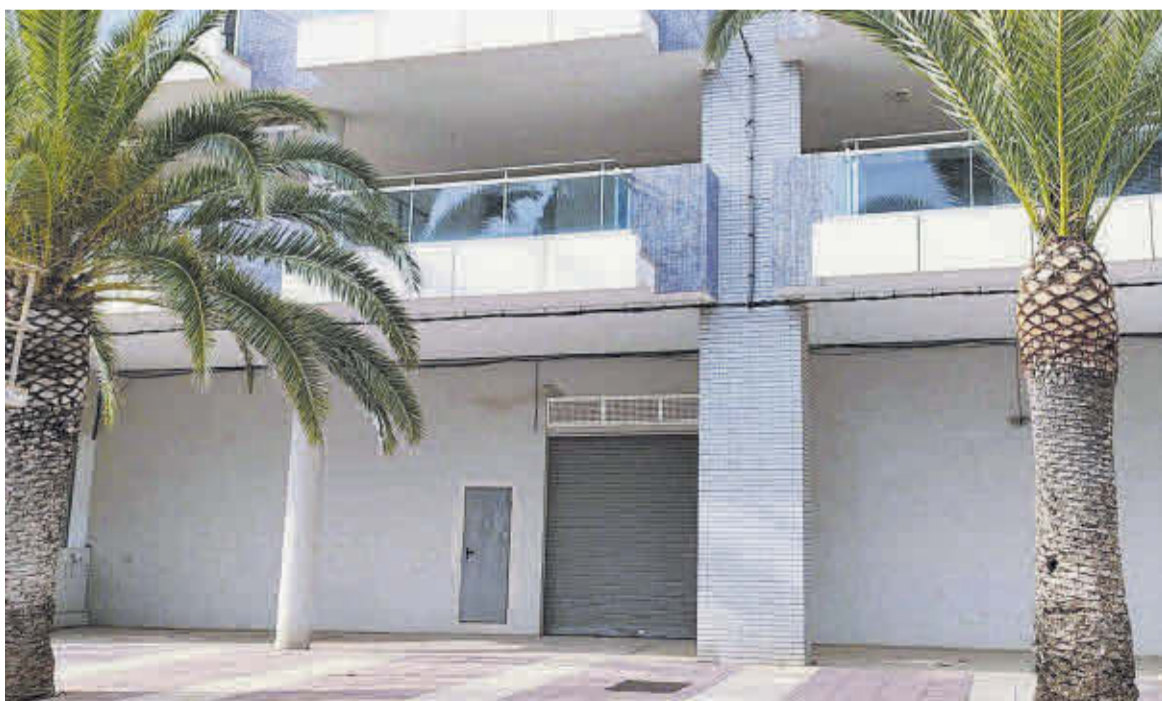
Si la situació ho permet, la localitat comptarà amb un nou Charter a l'avinguda Mare Nostrum, 71, la propera Setmana Santa.

«Tots coneixem el potencial que té la nostra platja, i al mateix temps, som conscients de la falta de servicis que pateix, per això estem convençuts que aquest nou projecte va a tindre una gran acollida i l'èxit necessari per a donar els bons resultats que tots esperem», assenyalen des de l'entitat.