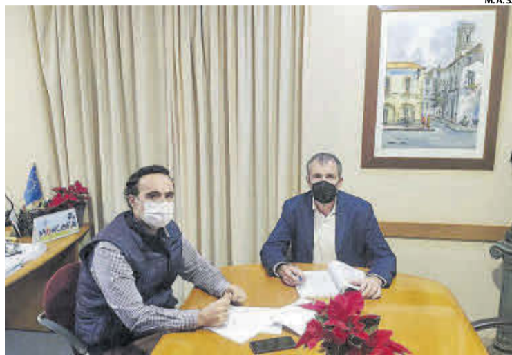
El alcalde de Moncofa y el primer teniente alcalde han realizado esta gestión.

Desde el pasado mes de marzo las empresas han visto cómo han disminuido sus ingresos