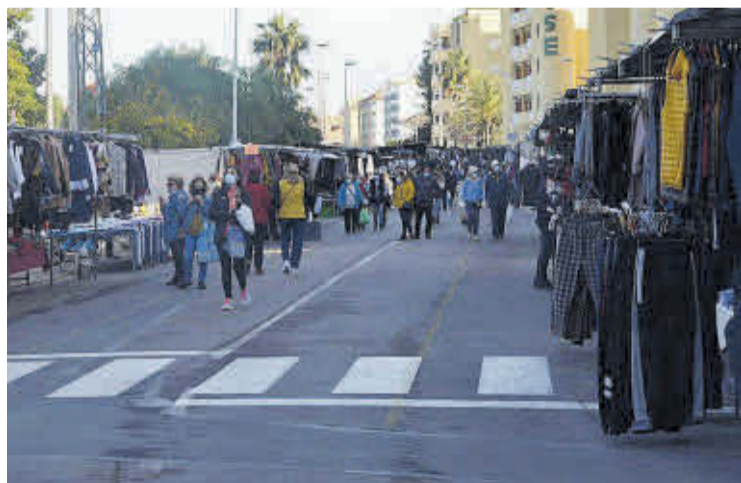
La ubicación del mercado invernal es la misma durante la temporada estival.

La playa de Moncofa alberga el mercado ambulante extraordinario, que se celebra en las mañanas de los sábados. Este espacio comercial ambulante cuenta con un centenar de puestos de venta y se ubica en el mismo espacio que durante la