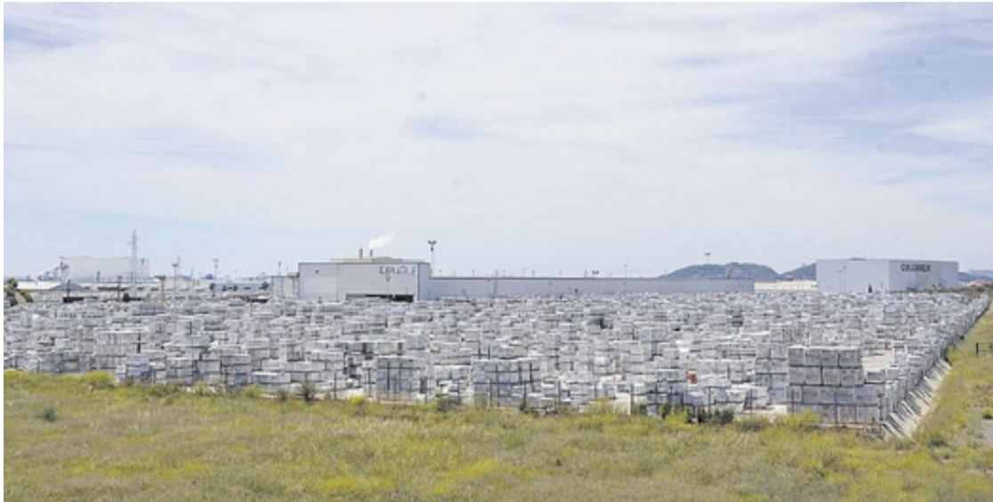
Grupo STN tiene unas amplias instalaciones, ubicadas en unos terrenos que se encuentran en el polígono Casablanca.