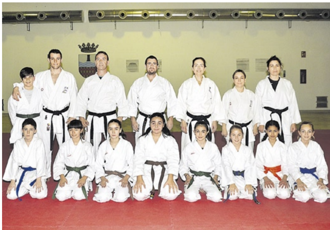
Integrantes del Club de Karate do La Torre, que estarán presentes en el Karate Divertit y en el campeonato de Sofía.