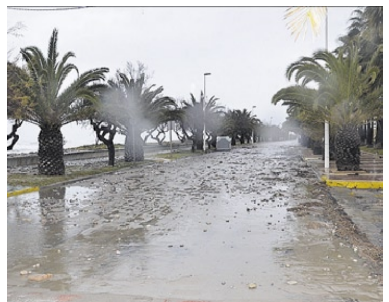
La avenida Mare Nostrum fue cortada al tráfico por la entrada de agua del mar.

los desperfectos y acogernos a todas las líneas de ayuda, tanto las impulsadas por la Generalitat valenciana, como por el Gobierno de España. Únicamente espero que estas sean lo más amplias posibles, puesto que tanto el litoral como en el núcleo urbano de la playa y la urbanización La Torre registran muchos daños».