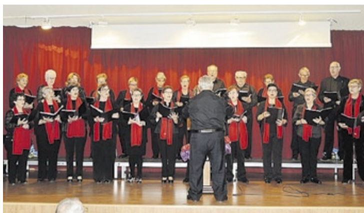
El coro parroquial de Moncofa llevó a cabo una excelente interpretación.