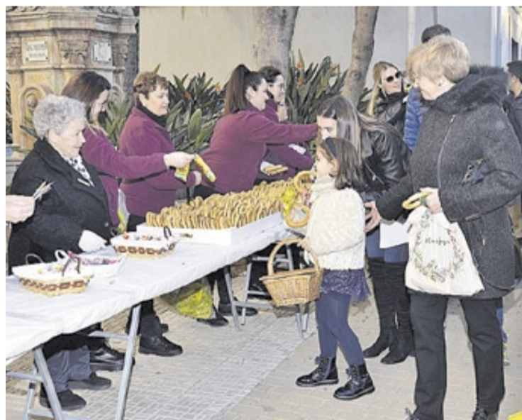
Los participantes recibieron los típicos 'rotllets' y caramelos de Sant Antoni.