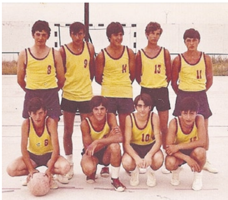
Los integrantes de la primera plantilla del CB Moncofa, en los años 60.

El monopolio de las instalaciones lo ostentaba el fútbol y nosotros solo podíamos entrenar cuando estaban libres, tanto el campo del fútbol como el de