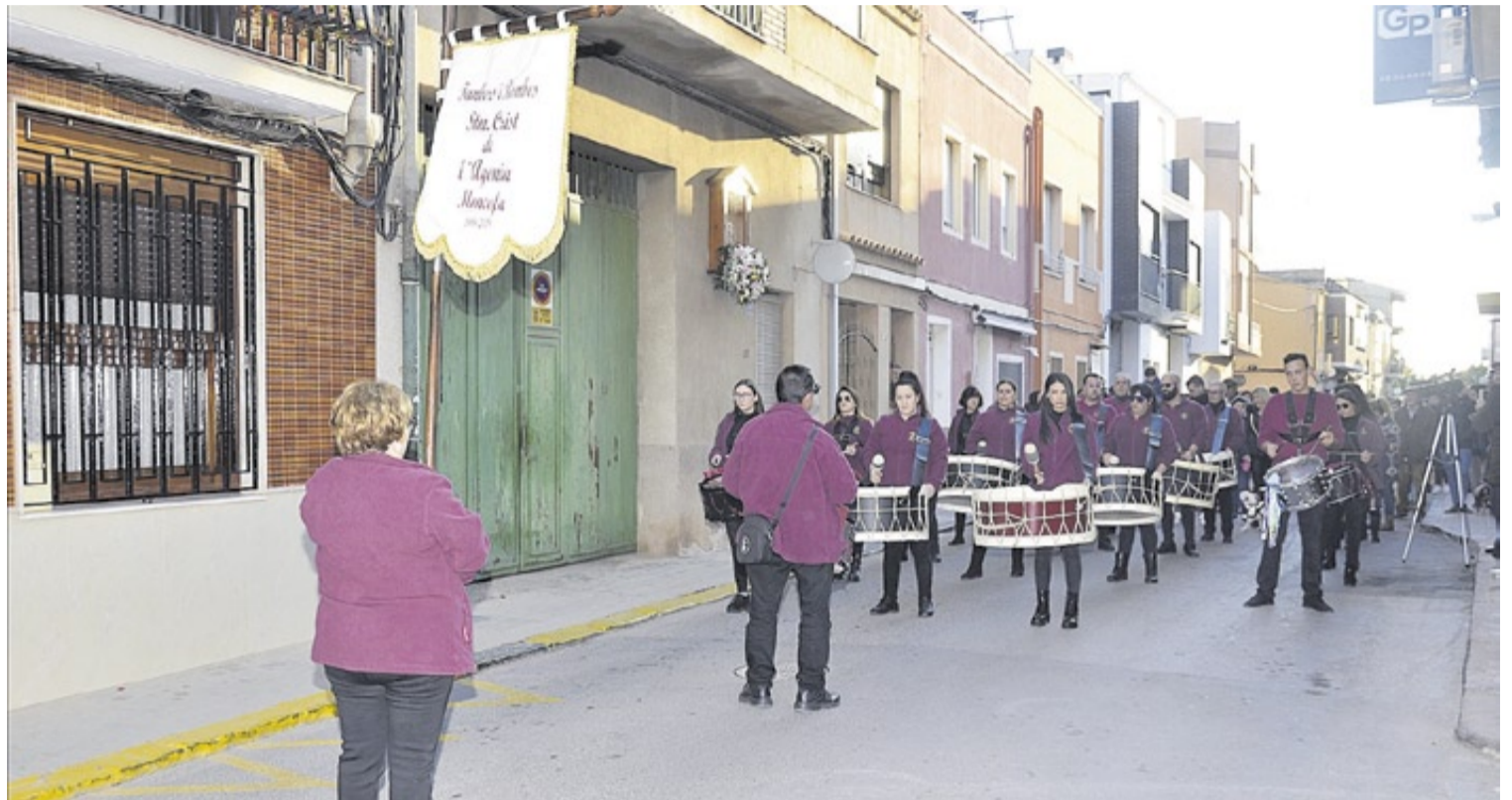
La Asociación de Tambores y Bombos del Santísimo Cristo de la Agonía encabezó la comitiva que recorrió las calles del casco urbano para recibir la bendición.