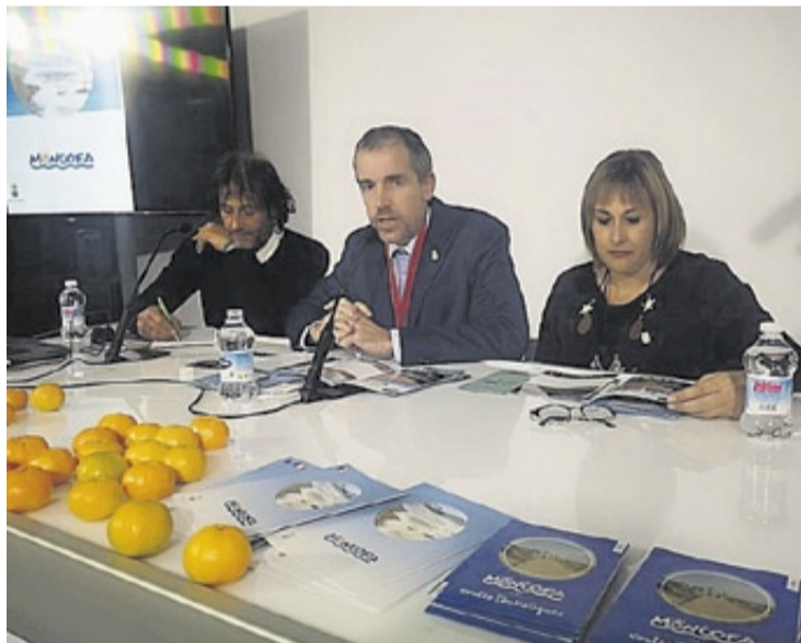
El alcalde de Moncofa presentó los nuevos folletos turísticos para el verano.

tros, ahora, se puede recorrer en su totalidad, porque con la nueva pasarela de madera ya se puede sortear la desembocadura del río Belcaire, sin tener que dar ningún rodeo».