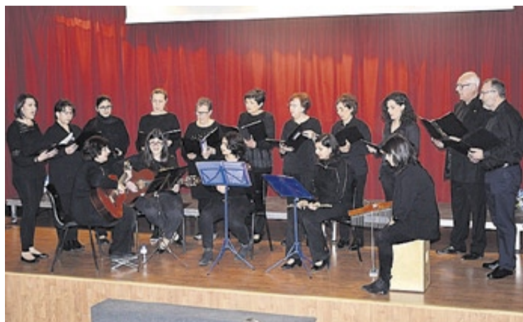
El Coro Belcaire, de Moncofa, ofreció un repertorio de temas muy conocidos.