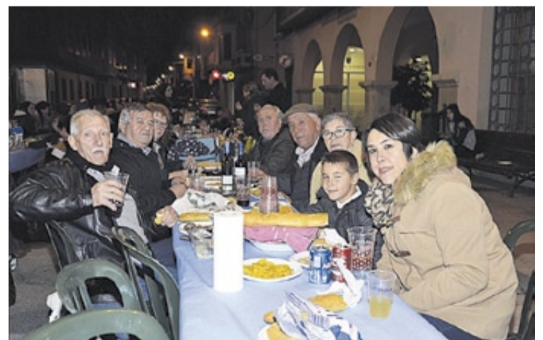
Al llegar la noche, los vecinos disfrutaron de una animada 'torrà' y discomóvil.