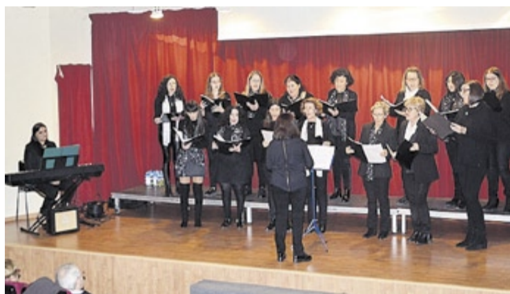
Las notas del piano acompañaron la actuación del Coro Carnevale, de Burriana.