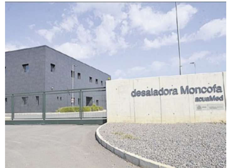
La desaladora está en fase de mantenimiento desde noviembre.

La planta desaladora de Moncofa se encuentra en la actualidad en fase de mantenimiento, por lo que no presta servicio a la red de agua potable del municipio. Este hecho se debe a que, en el mes de noviembre, Moncofa alcanzó el límite de consumo de 100.000 metros cúbicos de agua desalada asignados para el año 2019. Este hecho ha derivado en la parada total de la planta, dado que no puede proporcionar un servicio mayor al estipulado en el convenio firmado de tarifa transitoria, aprobada para que se pudiera poner en marcha la desalinizadora.