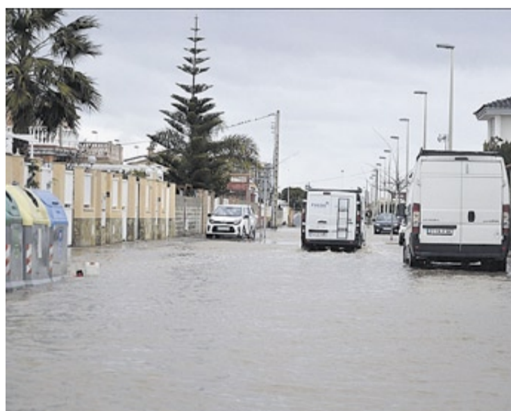
El vial principal de la urbanización La Torre también quedó anegado.