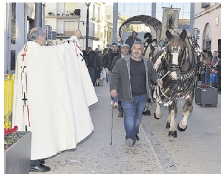
Las caballerías fueron las primeras en llegar a la plaza de la Iglesia.