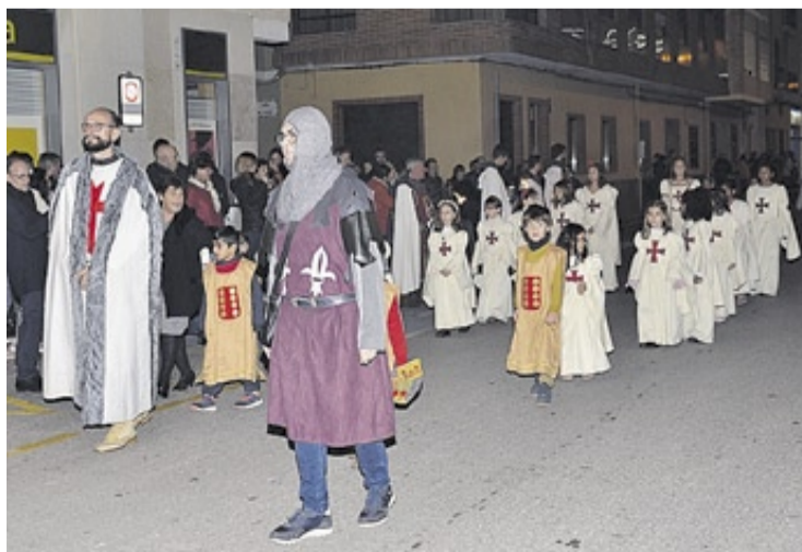
La Carta Poble i el 9 d'Octubre veuran augmentat el seu pressupost en 2020.

Moncofa s'han inclòs 3.000 euros per a una partida destinada a benestar animal i inversió en accessibilitat universal. Per finalitzar, del grup socialista s'ha inclòs la continuïtat amb accions juvenils, activitats d'oci i l'ampliació dels punts de reciclatge.