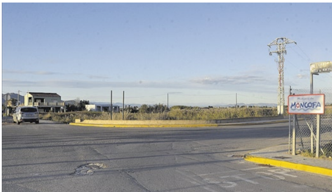
La construcció d'una rotonda, en la intersecció situada al límit de les platges de Moncofa i Xilxes, tindrà lloc aquest any.