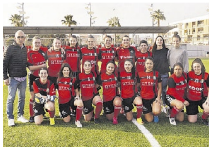
EL MONCOFA FEMENINO AFRONTA SU SEGUNDA TEMPORADA EN REGIONAL