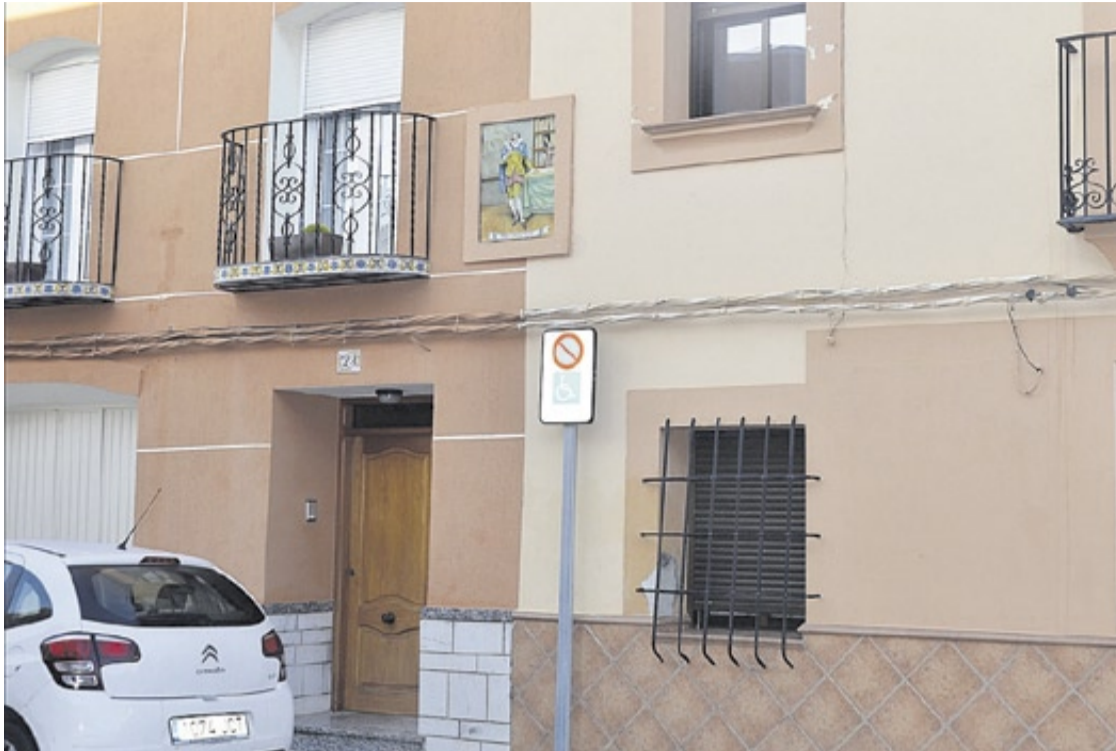
Moncofa compta, en l'actualitat, amb noms de carrers, edificis e imatges devocionals fets amb taulells històrics.