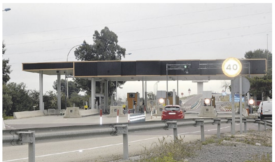
Moncofa cuenta con la salida más cercana al casco urbano de toda la AP-7, a su paso por la provincia de Castellón.