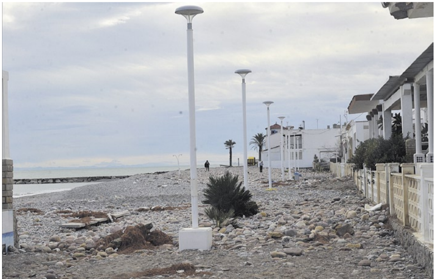
El paseo marítimo ha acumulado grandes cantidades de piedras y arena arrastradas por el intenso oleaje, cuya fuerza ha provocado daños en varios tramos.