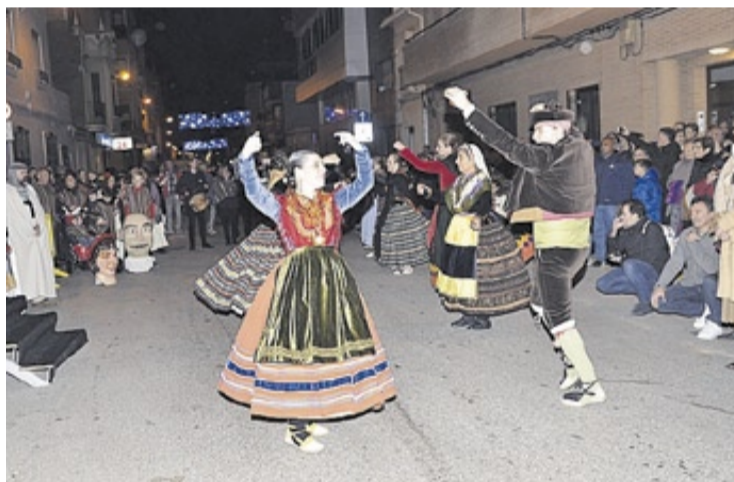
El Grup de Danses Biniesma brindó diversos bailes a los vecinos.