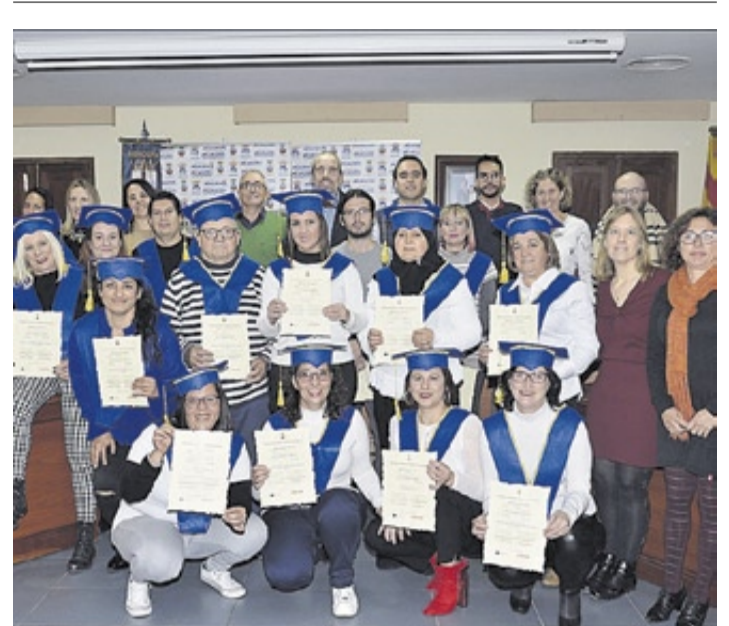
■ CLOENDA OFICIAL DEL TALLER D'Ocupació PER A MAJORS DE 30 ANYS

Entre els elements catalogats, tots ells de naturalesa ceràmica, es troben «els panells devocionals de casc urbà, les plaques ceràmiques de Regiones Devastadas, plafons ceràmics de retolació civil, les rajoles de Sito de Bando o algun exemple de taulelleria arquitectònica industrial, com el rètol que anunciava la Societat Naranjera d'Exportació Número 1 de la Cooperativa Agrícola La Prosperitat», diu José Albelda.