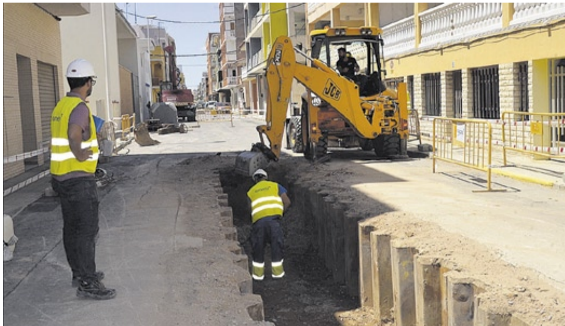
La millora de la xarxa de clavegueram seguirà sent el plat fort de les inversions previstes per a aquesta anualitat.

Del grup municipal Compromís s'han inclòs 3.000 euros per a la campanya del nom del municipi, que és Moncofa i no Moncofar; 6.000 euros per a la celebració del 9 d'Octubre; 5.000 euros per a la celebració de la Carta Poble i una partida per mantenir els parcs canins i, si pot ser, construir-ne un en el municipi, ja que els dos existents es pot dir que són a la platja. De Podem