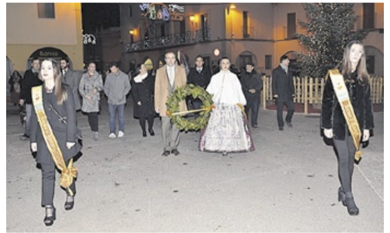
Las autoridades locales, el alcalde de Moncofa y la reina de las fiestas.