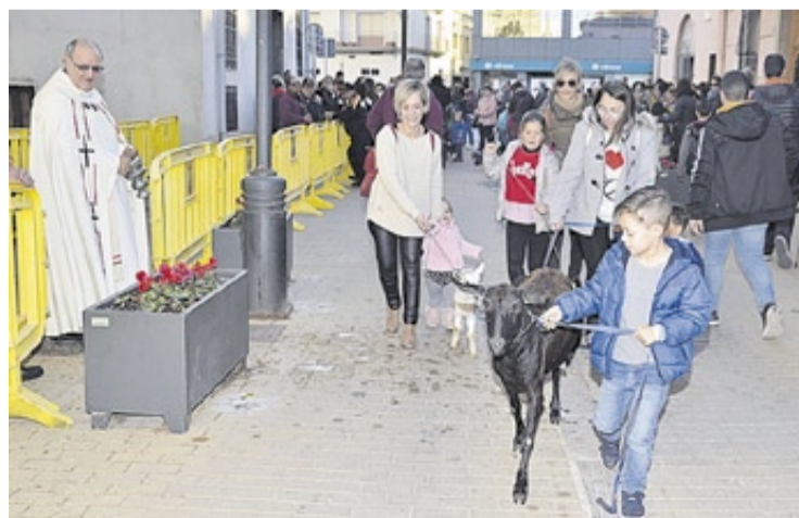
En el pasacalle participaron toda clase de mascotas y animales, como las cabras.