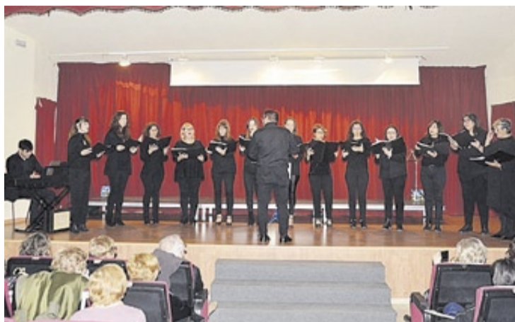
Coro Innuendo, de Castelló, destacó por la calidad de sus voces femeninas.