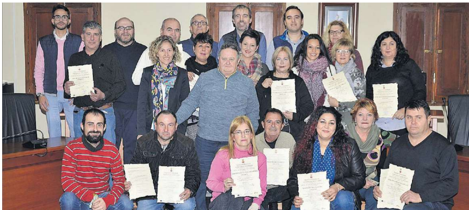
La totalidad de los alumnos del Taller de Empleo, de los módulos de Jardinería y Albañilería, recibieron el certificado por su trabajo realizado durante este año.