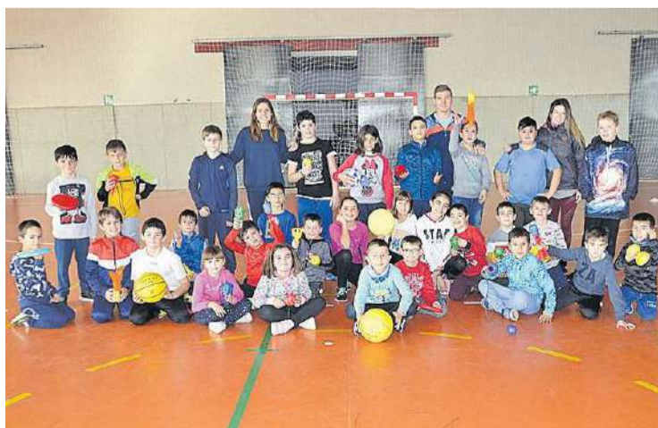
El polideportivo congregó a niños y niñas en la escuela deportiva de Navidad.