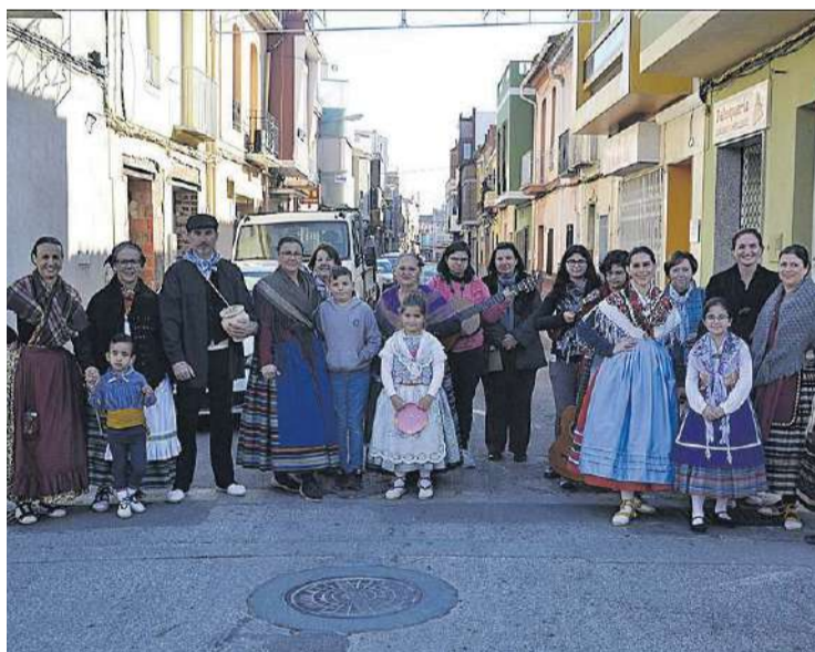
El Grup de Danses Biniesma llevó a cabo una jornada matinal de villancicos.