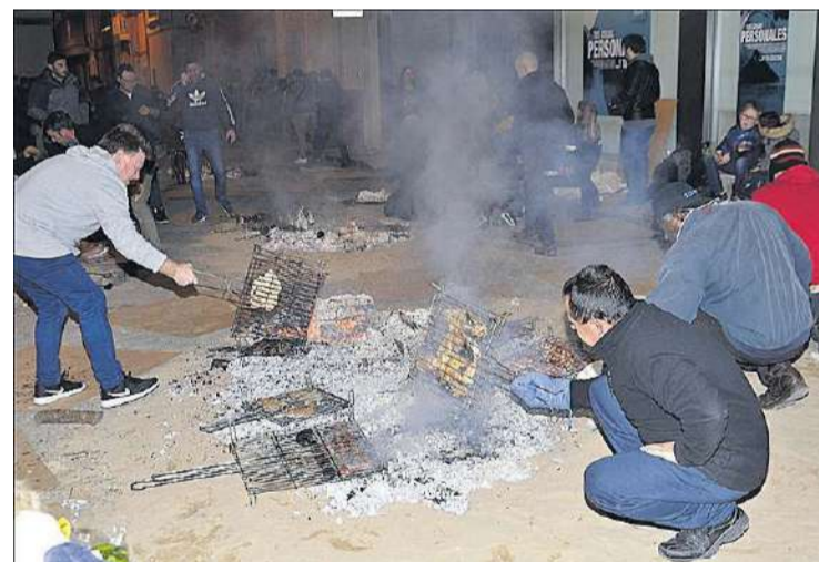
La torrà popular va congregar prop de 500 veïns en la plaça de la Constitució.