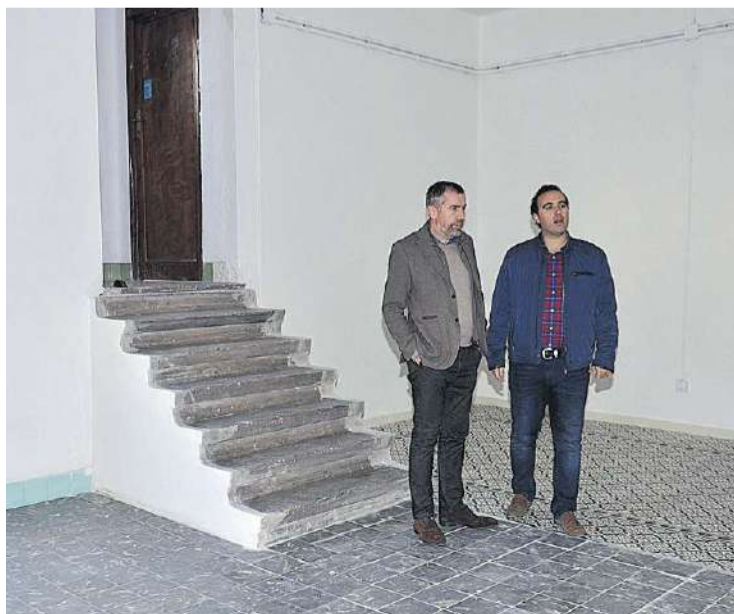
Los alumnos de Albañilería han adecuado la Cámara Agraria para ser museo.

no ha sido el fomento del empleo y desde que estamos al frente del consistorio, la obtención de talleres de empleo. Los 20 alumnos que han finalizado este taller se encontraban muy satisfechos con la obtención del certificado de profesionalidad que les ofrecerá más oportunidades para introducirse en el mercado laboral».