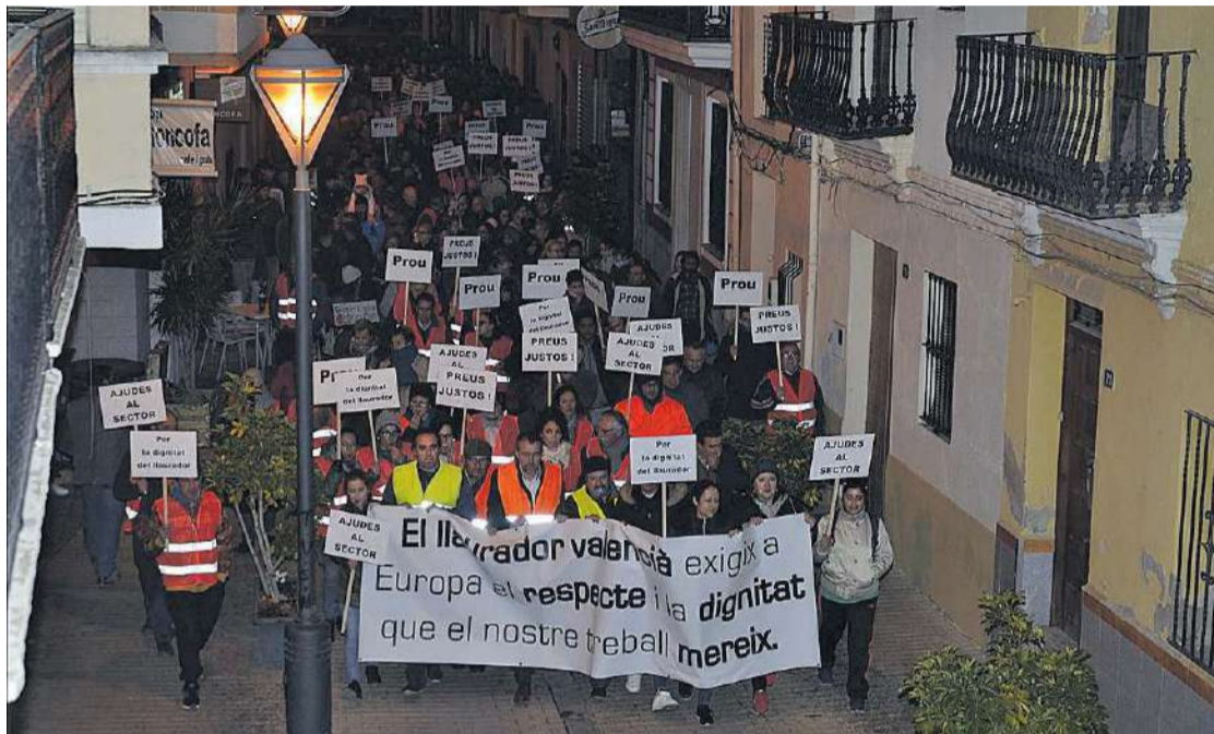
Los manifestantes quisieron hacer visible la pancarta y todas las reivindicaciones en defensa de toda la agricultura.

Después de que las protestas del 18 de diciembre en las plazas de una treintena de poblaciones citrícolas no hayan sido atendi-