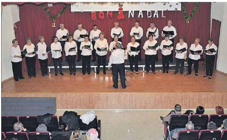
El coro de la Asociación de Jubilados y Pensionistas dio un recital de villancicos.