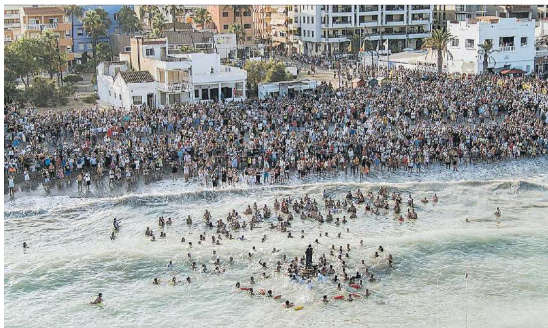
Moncofa promociona a Fitur el desembarcament de Santa Maria Magdalena, gravat des de l'aire per mitjà d'un dron.