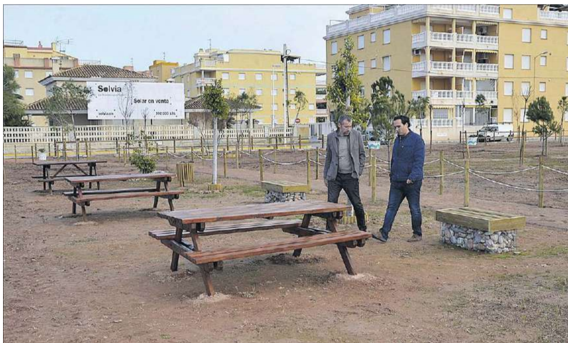
El módulo de Jardinería ha habilitado una nueva y amplia zona ajardinada cerca de la calle Estany al sur de la playa.