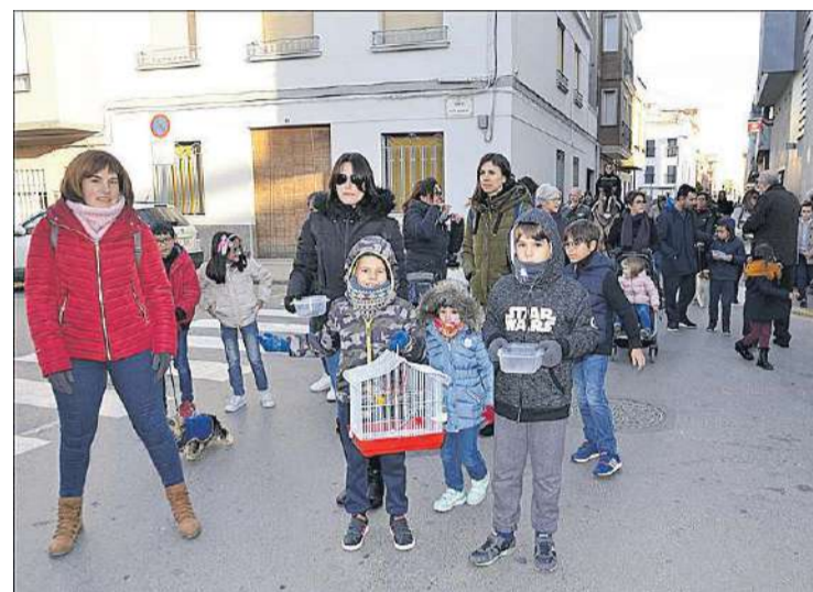
El passacarrer que es va iniciar al col·legi va comptar amb molta assistència.