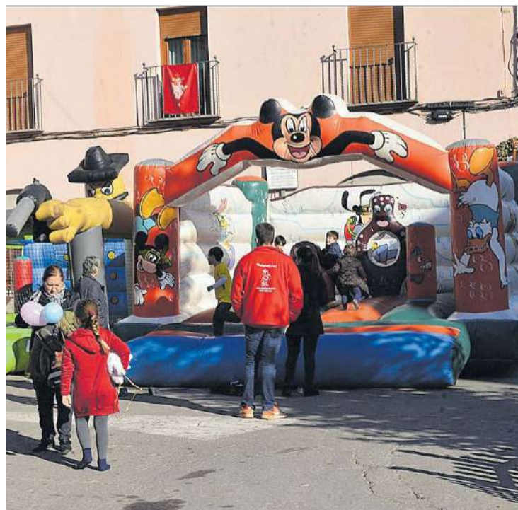
Los más pequeños disfrutaron de las actividades infantiles programadas.