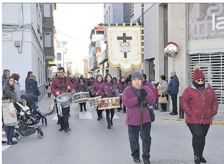
L'Associació Cultural del Santíssim Crist de l'Agonia va ficar la nota musical.

Cal dir que la festivitat de Sant Antoni ha agafat gran interès per part dels veïns, que són els que més es bolquen en aquesta festa, però empès per la importància que té aquesta festivitat a nivell provincial són molts els visitants de cap de setmana els que també s'acosten per a participar amb els seus animals a la benedicció. A la nit es va celebrar la tradicional torrà, que va tindre lloc a la plaça de la Constitució, un event organitzat per la Regidoria de Festes i l'Associació Cultural Santíssim Crist de l'Agonia.