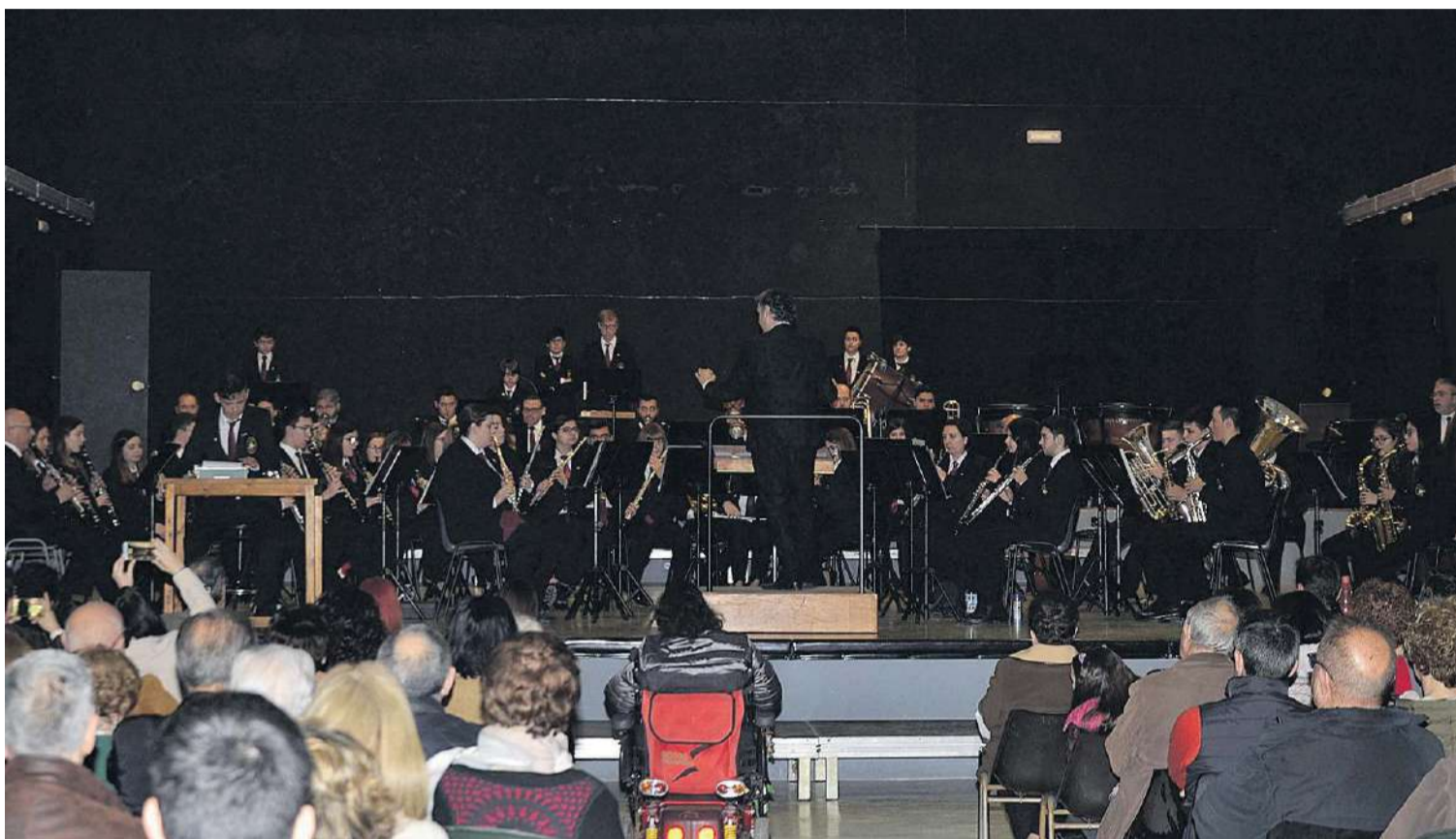
La SUM Santa Cecilia de Moncofa celebró su tradicional concierto de Navidad, evento que llevó a cabo el 22 de diciembre ante un buen número de asistentes.

Este año Moncofa ha querido ofrecer una gran variedad de actividades para que todos los vecinos pudieran disfrutar de unas merecidas Navidades en su municipio, como también dar a conocer a sus visitantes y turistas la oportunidad de poder integrarse como parte de la sociedad moncofense. El alcalde de Moncofa, Wenceslao Alós, agradece «el trabajo llevado a cabo conjuntamente por las tres concejalías que han estado implicadas en toda la programación, porque su coordinación ha sido lo que ha hecho posible que se pudiesen celebrar cada uno de los actos programados, actos que en muchos casos ha comportado el corte de calles, adecuación de edificios como es el caso del salón de actos de la Casa de Cultura, así como el corte de la plaza de la Constitución para poder ser instalada la carpa festiva de Navidad, que también ha sido agradecida por todos los vecinos y visitantes».