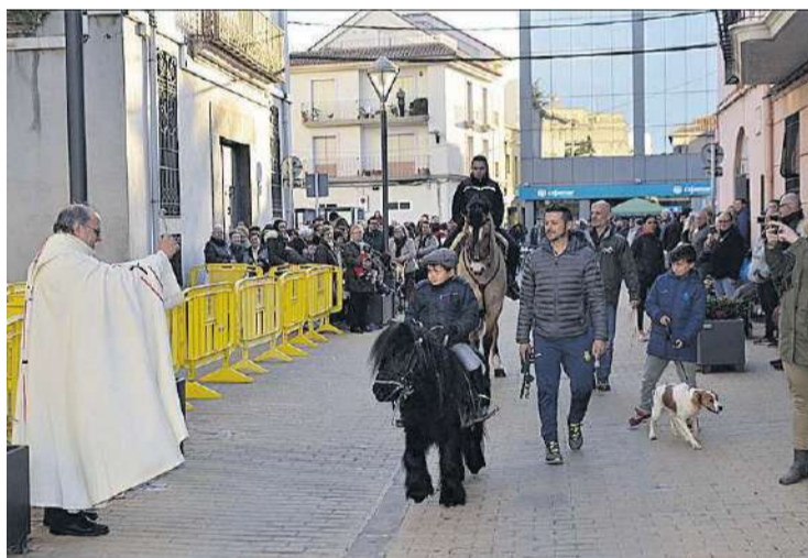
La benedicció es va dur a terme a la plaça de l'església parroquial del poble.