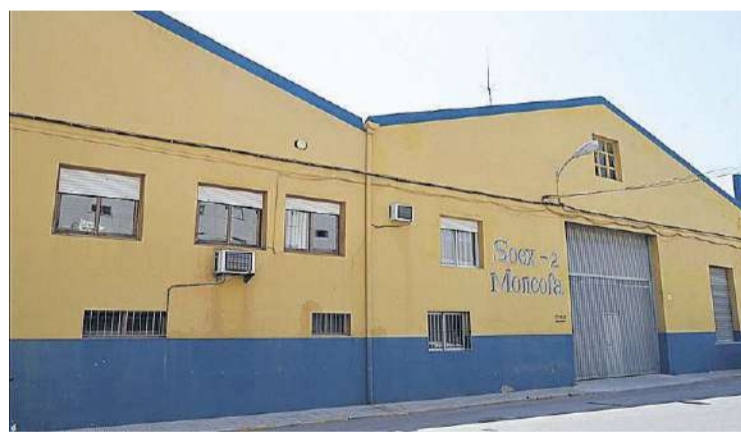
Esta será la última campaña que la Soex-2 trabajará la naranja en Moncofa.

Para Alós «es necesario seguir movilizándonos si queremos salvar la citricultura, no podemos no hacer nada porque significará la ruina más absoluta de nuestros agricultores y con ello la ruina de nuestro pueblo».