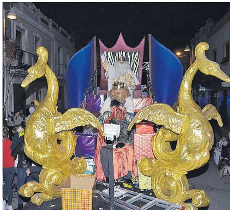
La Cabalgata de los Reyes Magos reunió a los vecinos en todo el recorrido.