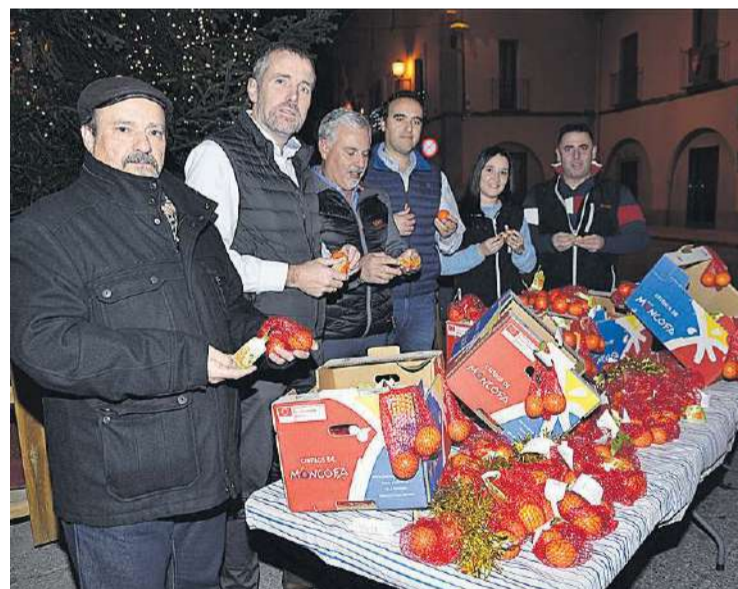
Las naranjas clementinas fueron las protagonistas en la noche de Fin de Año.