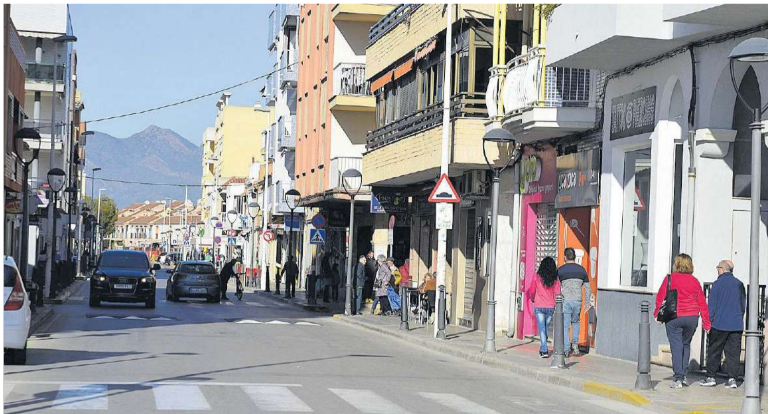
Moncofa compta en l'actualitat amb 424 nous veïns i veïnes que en el transcurs de l'any passat han adquirit habitatges per viure tot l'any en aquesta localitat.

De les localitats de la província superiors a 600 habitants Moncofa ha estat la que més ha augmentat en percentatge