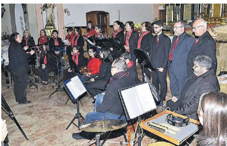
Éxito del concierto de villancicos ofrecido por el coro parroquial en la iglesia.