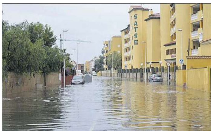
La zona Satse sufre embalsamientos de agua en episodios de lluvias.

de las instalaciones de Moncofa y se trasladarán a las de Xilxes. Las nuevas instalaciones permitirán obtener nuevos certificaciones que facilitarán la salida de la fruta. Además se mantendrá el nombre de Moncofa y el propio consejo rector, aunque en un futuro entrarán a formar parte socios del consejo de La Junquera.