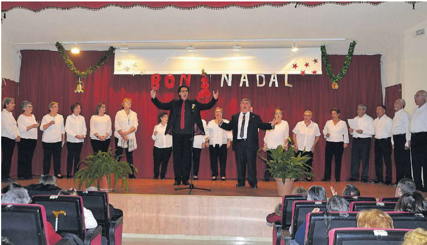
El concierto de ópera y zarzuela ofrecido por el trio Música lírica sorprendió a los presentes y al final del mismo estuvo acompañado por el coro de los jubilados.