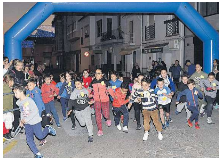
Los niños abordaron con entusiasmo la realización del nuevo recorrido.