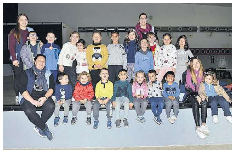
Unos veinte alumnos participaron en la escuela de Navidad de este año.