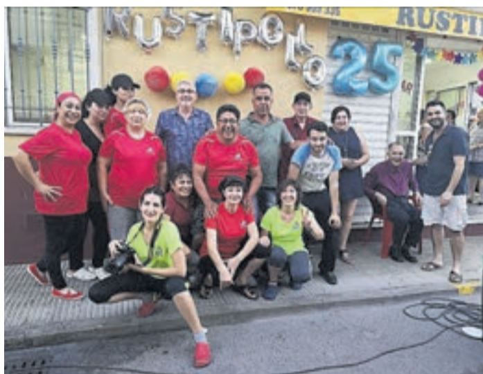
La totalidad de la plantilla de Rustipollo ha celebrado su 25º aniversario.

miento ofrece junto a los pollos y conejos asados, alitas de pollo, patatas bravas, ensaladilla, caracoles, manitas de cerdo guisadas y paellas para llevar.