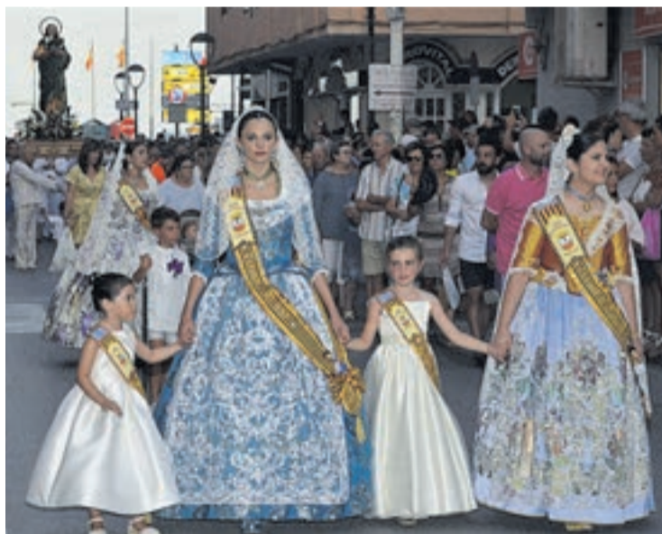
La santa inició su recorrido en procesión hasta la ermita que lleva su nombre.