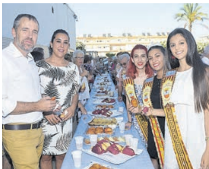
La Regina de las fiestas y corte de honor en la merienda-baile de los mayores.

El día 22 de julio, la Festa Major , se llevó a cabo la procesión de Santa María Magdalena, portada por un grupo de marineros incansables. Y por la noche se