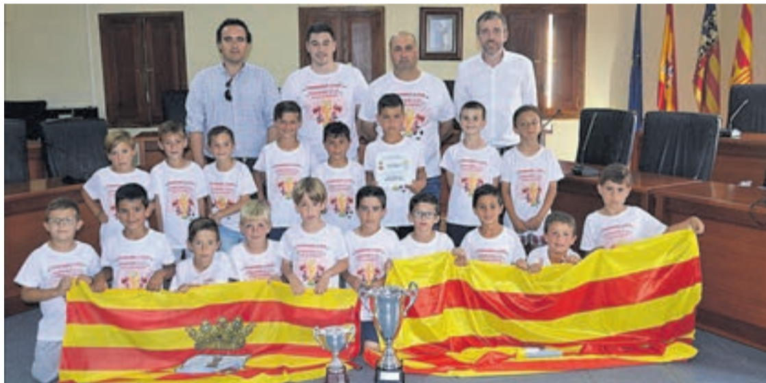
El equipo prebenjamín del Platges de Moncofa fue recibido en el salón de plenos por las autoridades municipales.

A partir de ahora la dirección técnica y deportiva ya están planificando la próxima temporada