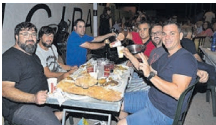
El 'sopar de penyes de mig any fester' fue la primera cita de las peñas.