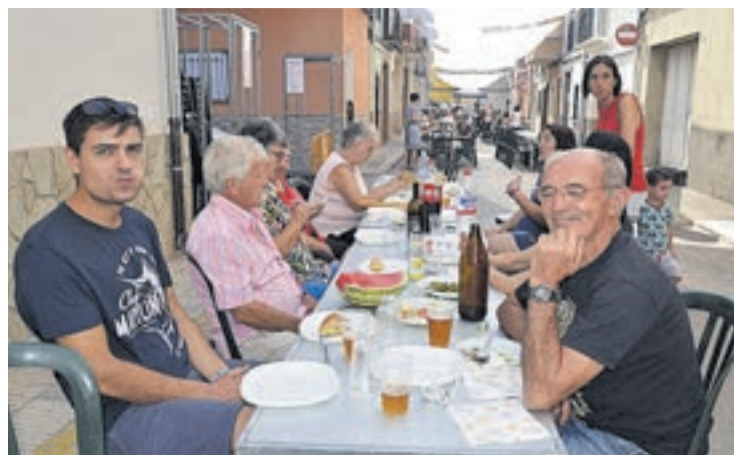
El almuerzo popular congregó a los vecinos en la calle Santa María Magdalena