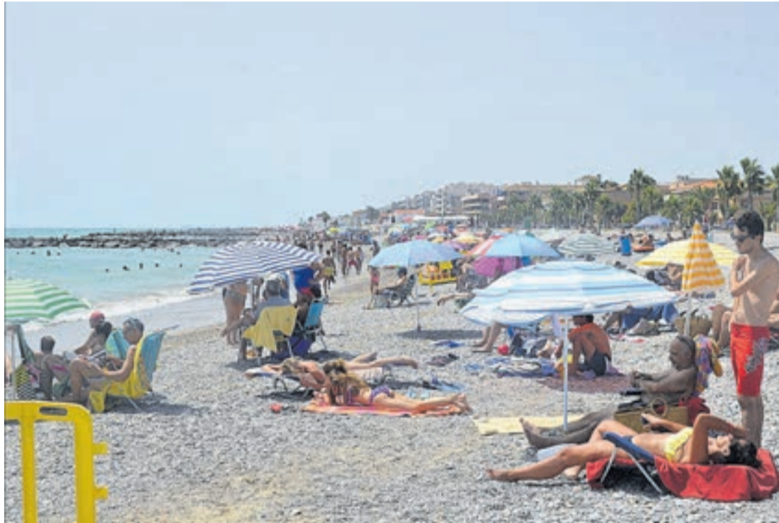
El litoral de Moncofa cada vez es más apetecible para los turistas y visitantes porque cuenta con propuestas turísticas.

Las nuevas líneas aéreas del Aeropuerto de Castellón también salpican positivamente a la Playa de Moncofa, en concreto la de Pozman y Londres, ya que en la Tourist Info se reciben usuarios que vienen hasta esta playa desde el mismo aeropuerto, porque les parece una playa tranquila, si se compara con Benicàssim, Or-