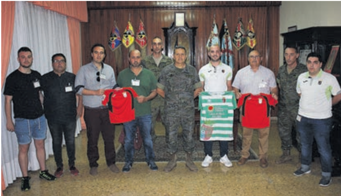
Autoridades de Moncofa junto a responsables de los dos clubes y el vecino de Moncofa, con los militares en Marines.