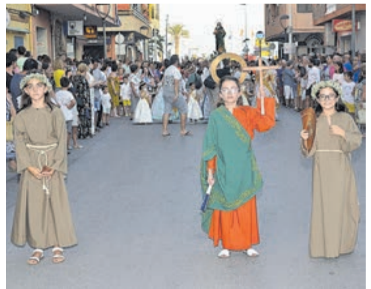
Tres niñas de Moncofa fueron las encargadas de recitarle versos a la patrona.