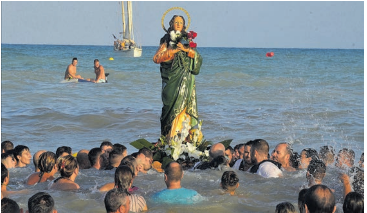
Un año más, el desembarco de Santa María Magdalena, patrona de Moncofa, fue un acto muy emotivo que contó con los incansables marineros de la localidad.

Al salir del mar, la imagen de Santa María Magdalena obtuvo miles de aplausos de los asistentes que se congregaron en la zona centro de la playa de Moncofa. Los marineros transportaron a hombros a la santa, hasta un escenario donde tres niñas le dedicaron diversos versos. Después se inició la emotiva procesión por las calles de la playa que finalizó en la ermita de la patrona.