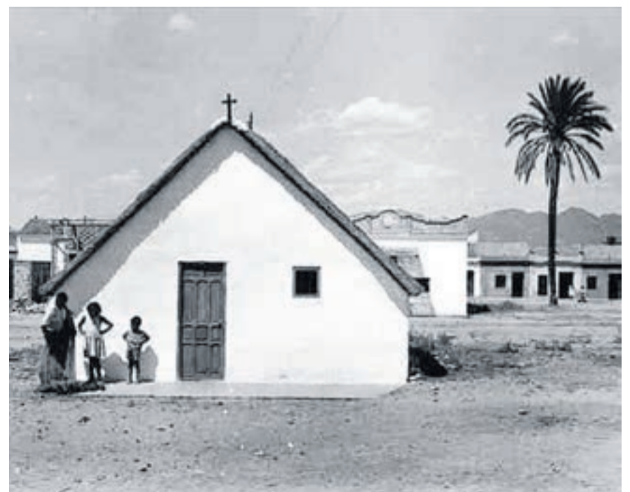
Las dos primeras palmeras se encontraban situadas al lado de la ermita (izquierda) y en lo que en la actualidad es la avenida del Puerto, situada justo detrás de la oficina de turismo (derecha).