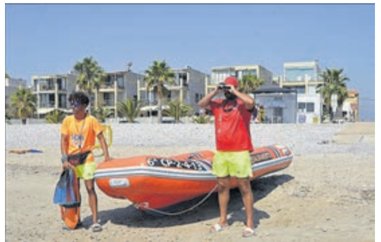
La platja Pedra-roja compta amb infraestructures necessàries com l'embarcació.