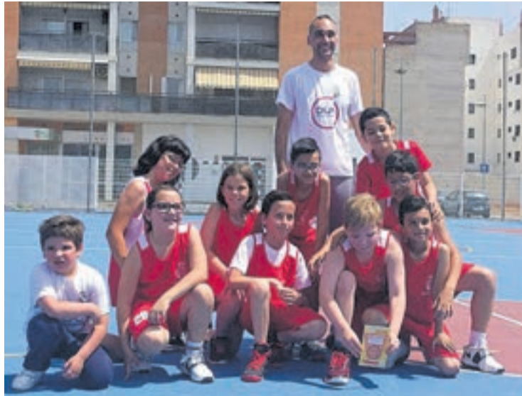
El equipo benjamín de baloncesto ha quedado tercero en la clasificación final.