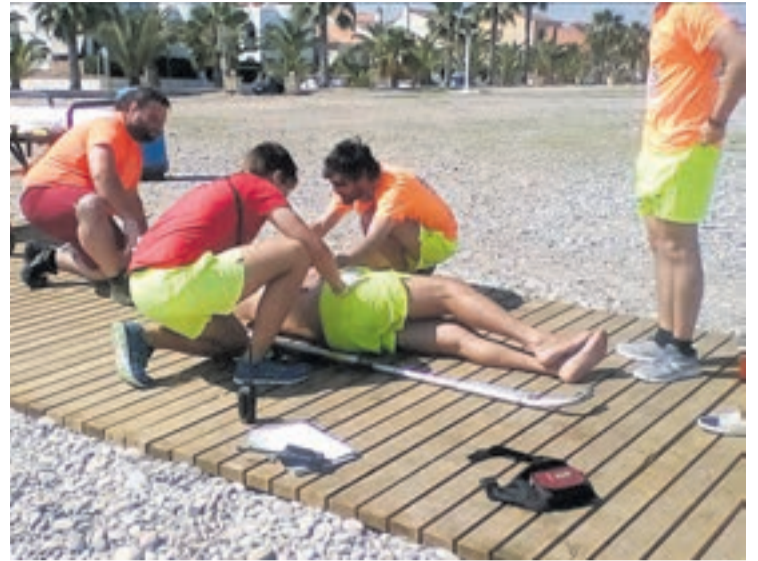
Durant els dos mesos d'estiu els socorristes de Moncofa fan prou simulacres.

Moncofa és gairebé l'excepció. Per aquest motiu l'empresa no ha tingut problemes per conformar aquest planter de socorristes que des de primeres hores del dia i fins les set i mitja de la vesprada, els seus ulls només veuen les zones de bany, comprovant que els banyistes estan en perfecte estat dins de l'aigua.