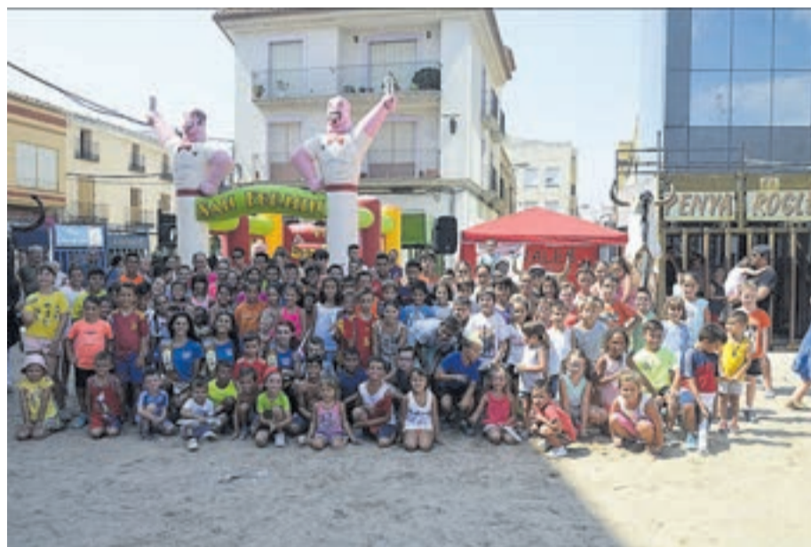
El encierro infantil fue una de las citas de las fiestas más esperada por los más pequeños .