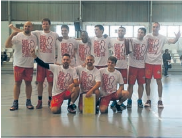
El equipo de baloncesto sénior jugará la próxima temporada en Primera Zonal.