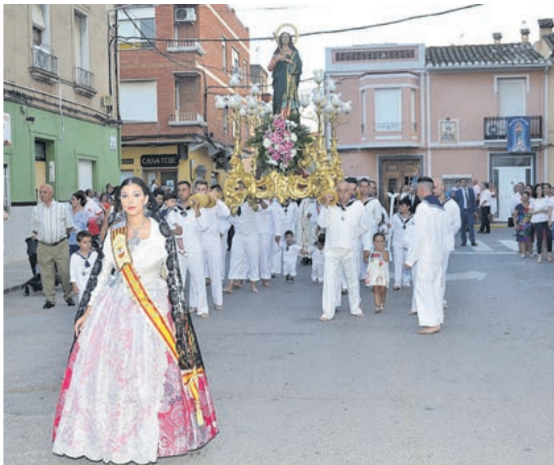
La procesión de la patrona Santa María Magdalena contó con numerosos vecinos que abarrotaron todo el recorrido.