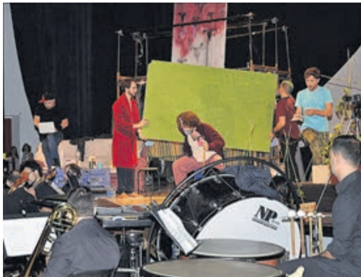
L'escenari de l'obra va comptar amb la presència de molts actors cantant.