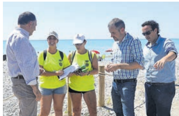
El diputado provincial y autoridades locales, con las trabajadoras en el litoral.

Durante cuatro meses, seis vecinos del municipio moncofense estarán llevando a cabo este tipo de trabajos con la finalidad de recabar información válida para proyectos y estudios cara al próximo verano.