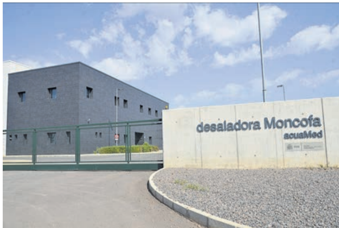
Planta desaladora construida en el término municipal de Moncofa que actualmente se encuentra en fase de pruebas.