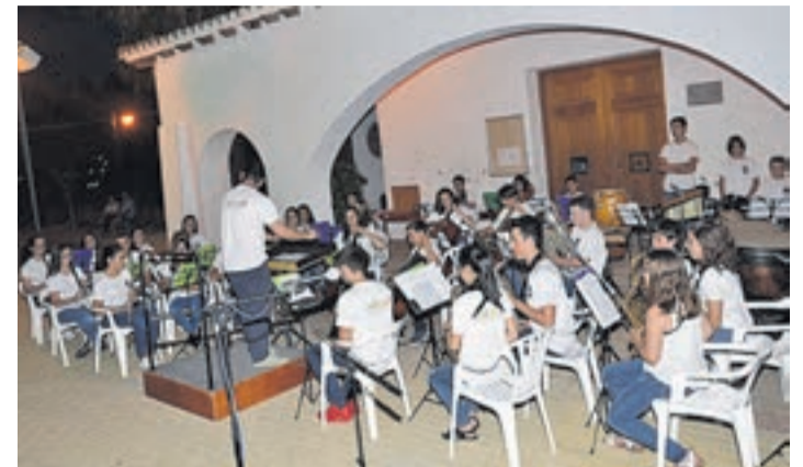
Los integrantes de la banda joven interpretaron diversas obras musicales.

Como viene siendo habitual con la llegada de la época estival, los integrantes de la banda jove Solfejant de Moncofa ha llevado a cabo su tradicional concierto de cierre de temporada que desde hace unos años celebra en la ermita de Santa María Magdalena.