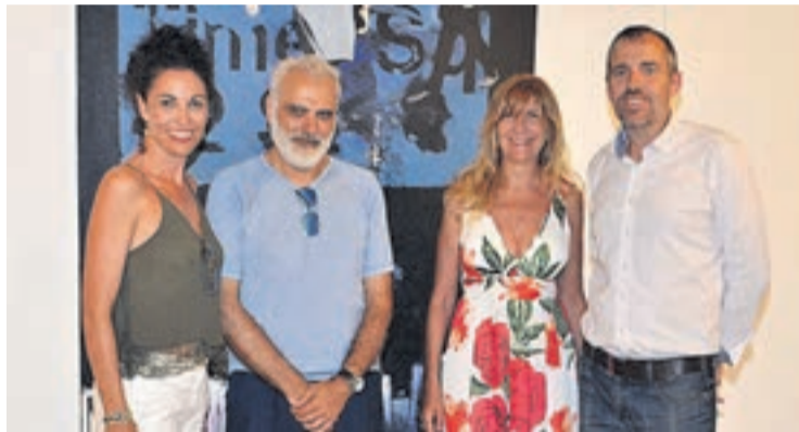
Hoy en día se pueden visitar las obras del pintor valenciano Salvador Montó.