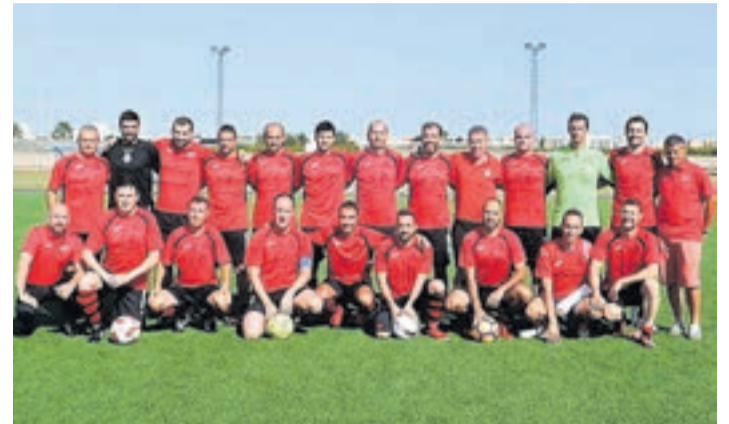
La plantilla del Veteranos Moncofa tiene un buen plantel de jugadores.

El equipo Veteranos Moncofa ha celebrado el torneo conmemorativo del décimo aniversario de su fundación. En dicho torneo participaron el CD Teruel, el Vall d'Uixó y una selección de la liga provincial.