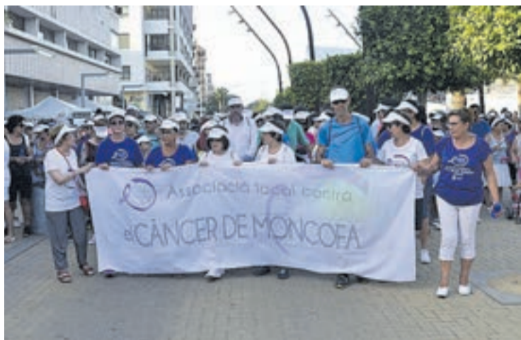
Los asistentes realizaron un recorrido por la céntrica avenida Mare Nostrum.

Cabe recordar que este evento es uno más de los que orga-