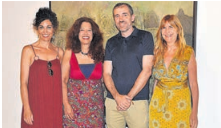
La primera exposición que albergó la sala fue la del pintor Paco Puig.

Y para finalizar las exposiciones del verano, del 10 al 25 de agosto se llevará a cabo una muestra de la pintora valenciana Aurora Valero, que será un recorrido por sus 50 años de trabajo. Gran obra de calidad y singularidad que va desde la figuración a la abstracción expresionista e intuitiva, con contenidos temáticos que cronológicamente han estado relacionados con los acontecimientos de su lar-