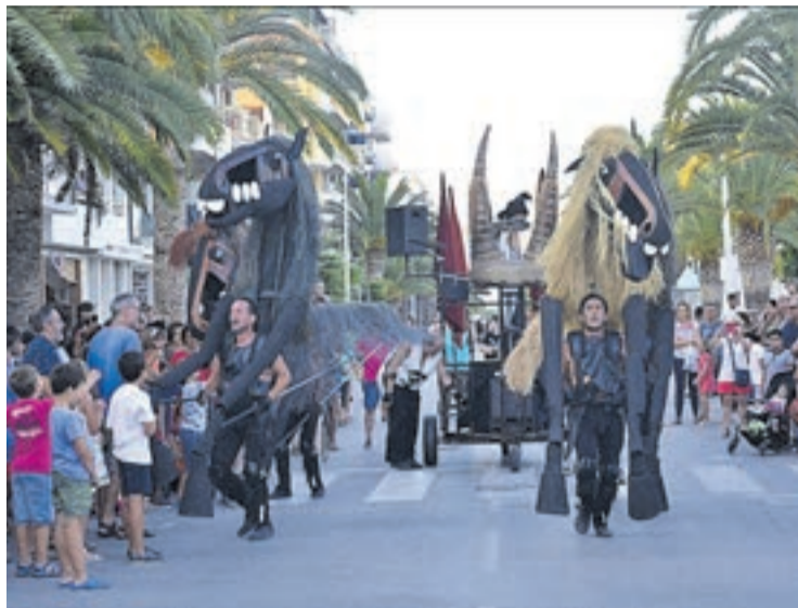
La puesta en escena de Caballos de Menorca de Tutais encantó al público.

Con la llegada del ecuador del certamen, Civi Civiac sorprendió a los asistentes con El Gran Zampano , que representó en la plaza Na Violant d'Hongria, arropado por numerosos seguidores y curiosos, dispuestos a disfrutar del teatro en la localidad.