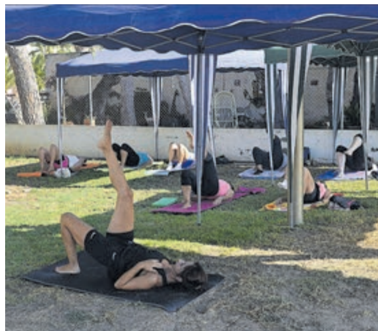
La modalitat esportiva de pilates també es va celebrar a la plaça dels Cucs.