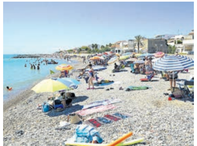
La platja Grao que es troba a la zona centre sempre ha estat concorreguda.