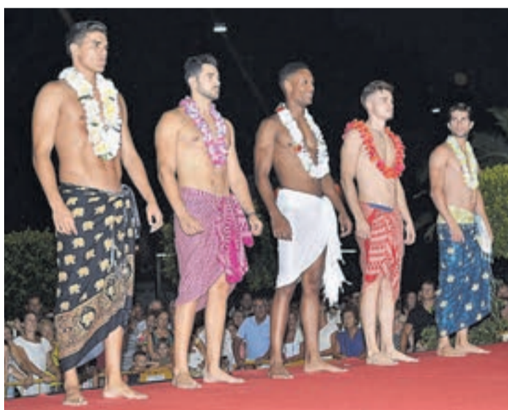
Los modelos dieron vida a las originales y cómodas propuestas de verano.