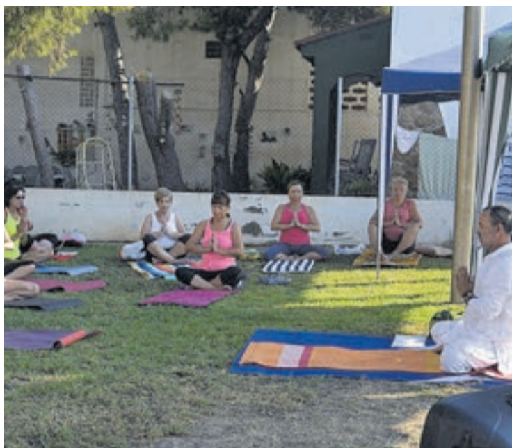
La 'màster class' de ioga va reunir un grup de dones i homes participants.