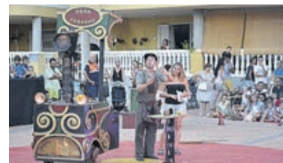
El Gran Zampano tiñó de humor blanco la jornada.