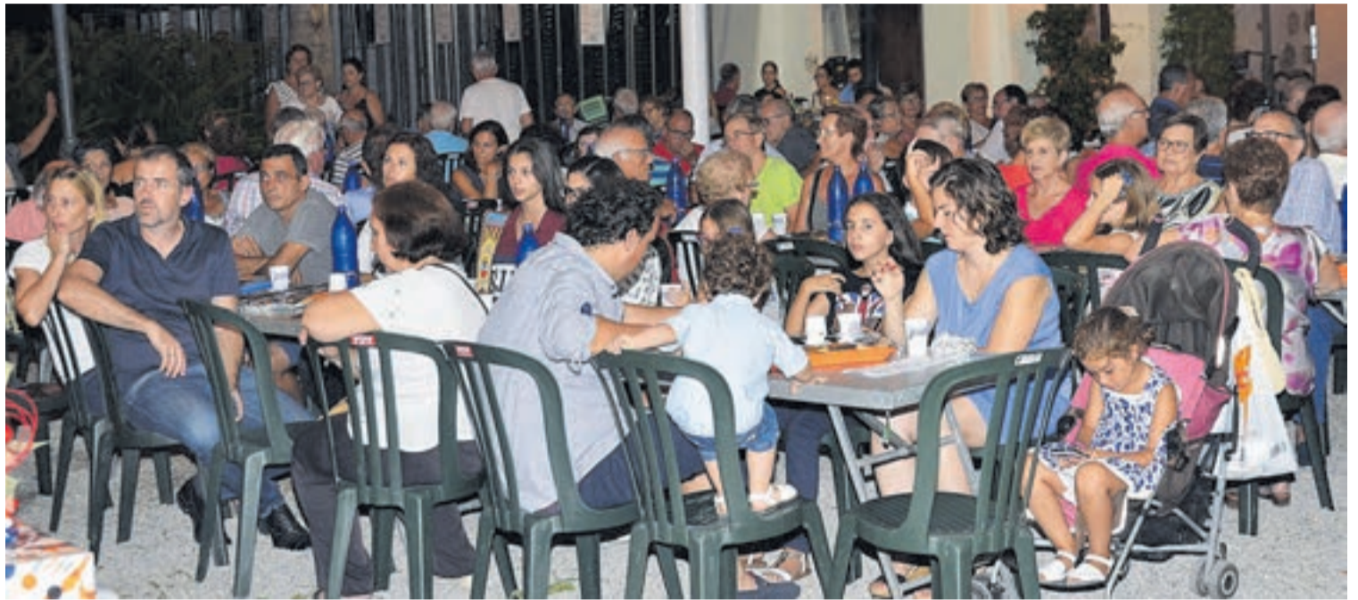
Los asistentes al Sopar de la fam colaboraron para que el proyecto, que se ejecutará en una zona cercana a Calcuta, se convierta en una realidad para los niños.