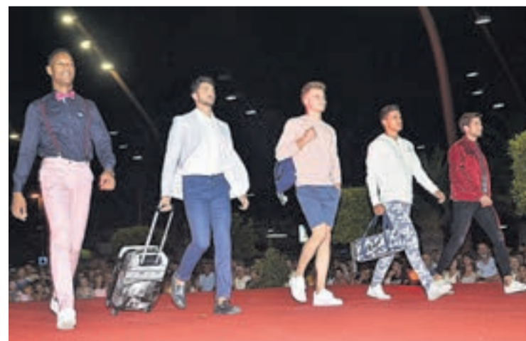
La moda sport aglutinó el estilo urbano más desenfadado con el más sobrio.