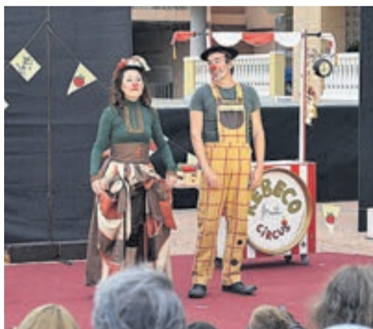
La Troup de Malabo protagonizó 'Sonata Circus' y las noches se tiñeron de fantasía que sorprendieron al público.