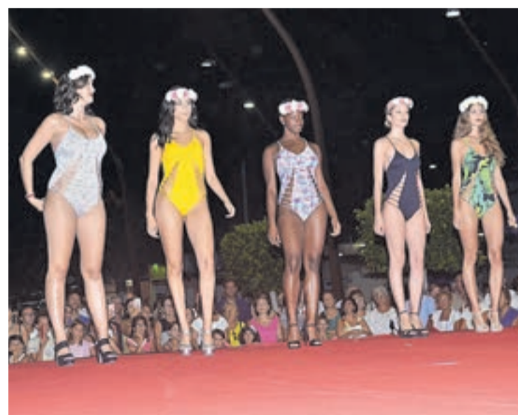
Los diseños de bañadores aunaron elegancia y vanguardia a partes iguales.