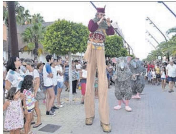
El Flautista de Hamelín y las ratas desfilaron ante el asombro de los pequeños.

En la recta final, el 23 de agosto, la plaza Na Violant d'Hongria se convirtió en el epicentro cultural, de la mano de la compañía La Troupe Malabo que cautivó con su espectáculo Sonata Circus .