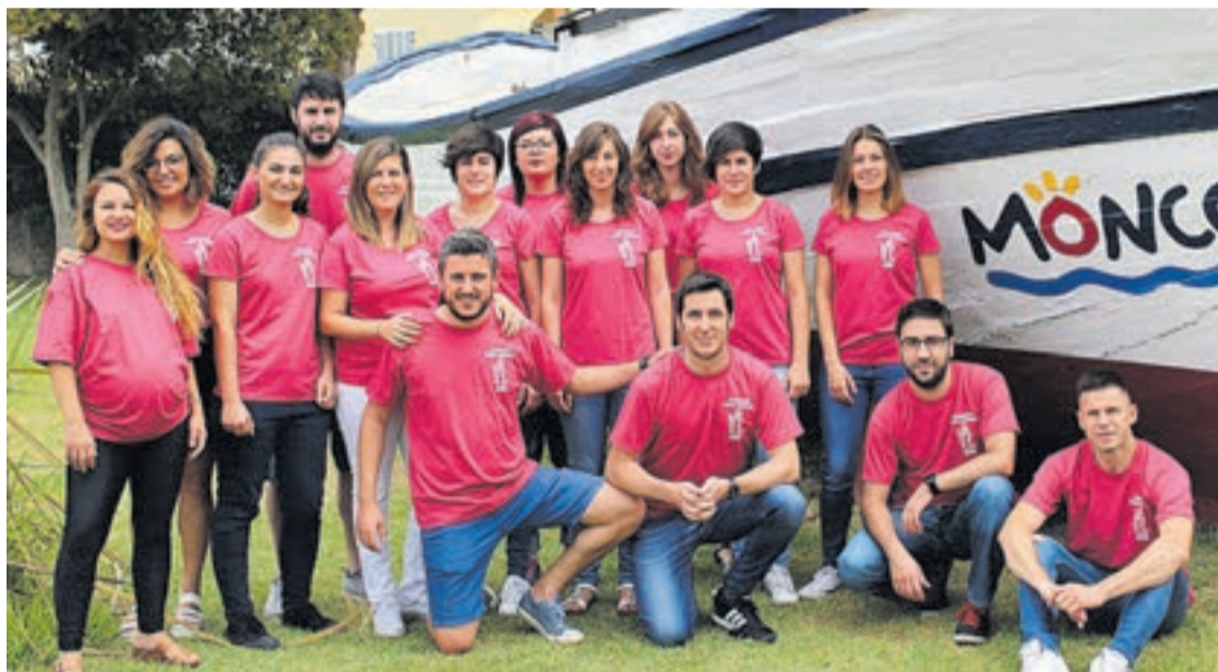
La comissió de les festes d'octubre formada per un grup numerós de membres, ha treballat per a fer un bon programa.

Per a finalitzar afegeixen que «esperem que la gent gaudisca amb germanor d'aquesta setma-