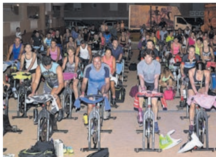
Cent esportistes es van muntar a les bicicletes a la 'master class' de 'cycling'.