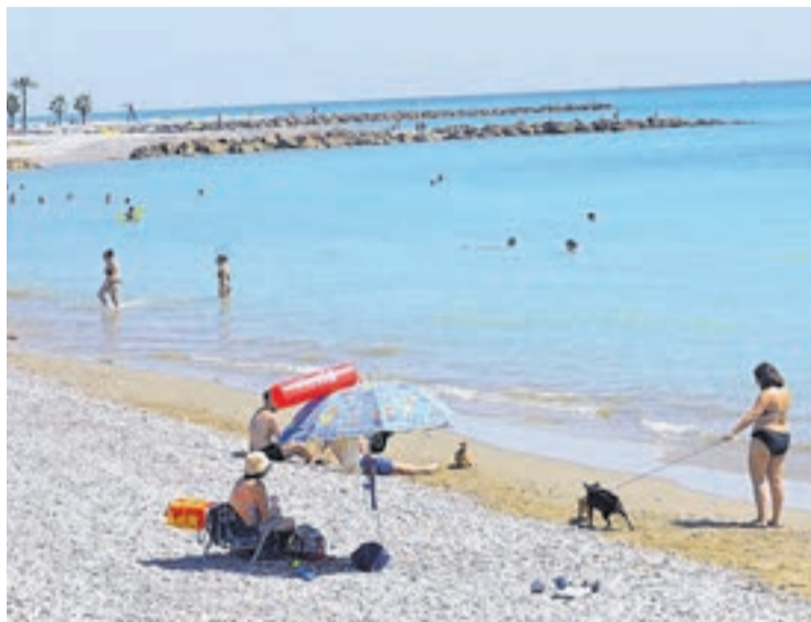
La platja Belcaire en el seu tram destinat a gossos ha estat molt sol·licitada.

Des de l'Ajuntament de Moncofa, s'han millorat tots els serveis turístics, com és el cas de dutxes, passarel·les de fusta i, sobretot, la vigilància i socorrisme de platges, en la qual totes les zones de bany han disposat dels socorristes necessaris. Cal dir que la platja de l'Estanyol que també compta amb el guardó de bandera blava, fins que finalitzi la temporada estival, disposa de dos socorristes, igual que la platja Belcaire per la seva platja canina, i un socorrista a La Torre, ja que aquesta