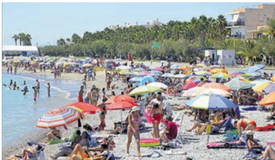
Masbó és la platja referent que té el litoral de Moncofa i tots els dies ha comptat amb banyistes.