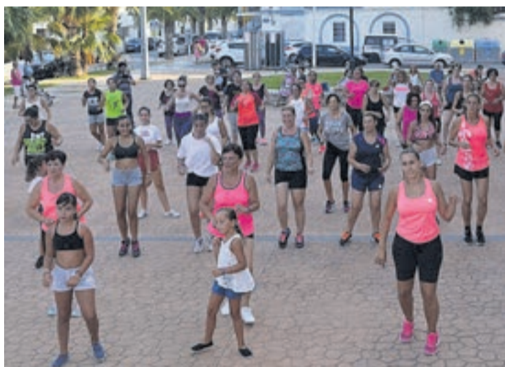
Més d'un centenar de dones es van bolcar en la 'master class' de 'move it'.