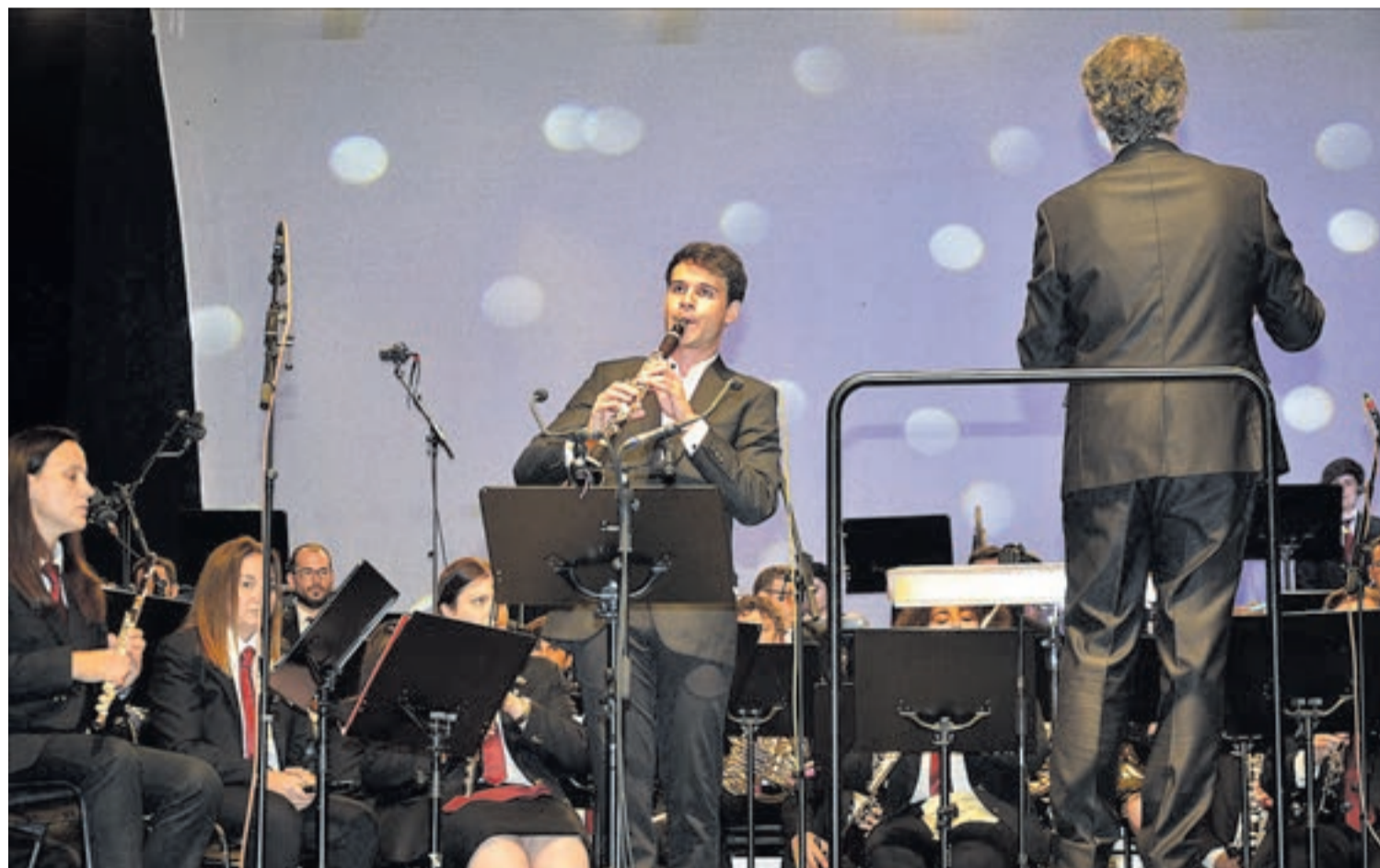
Unas 4.000 personas acudieron a la velada en la playa para disfrutar de la música en la que Assunção cobró protagonismo, junto a la SUM Santa Cecilia.

El público disfrutó durante una semana de variados espectáculos y propuestas para todos los públicos