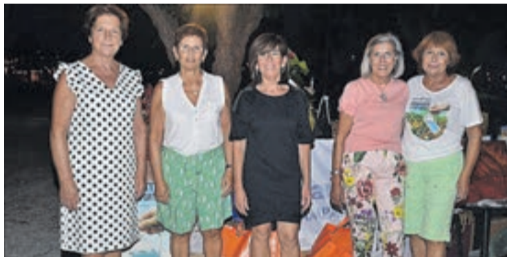
Un grupo de mujeres solidarias encabeza Manos Unidas de Moncofa.

El año pasado, la entidad recaudó 4.319 euros. A esta cantidad se sumaron cerca de 600 euros, gracias a las colectas de misa y un mercado solidario, que la oenegé moncofense y Nules llevaron a cabo en el IES Gilabert Centelles.