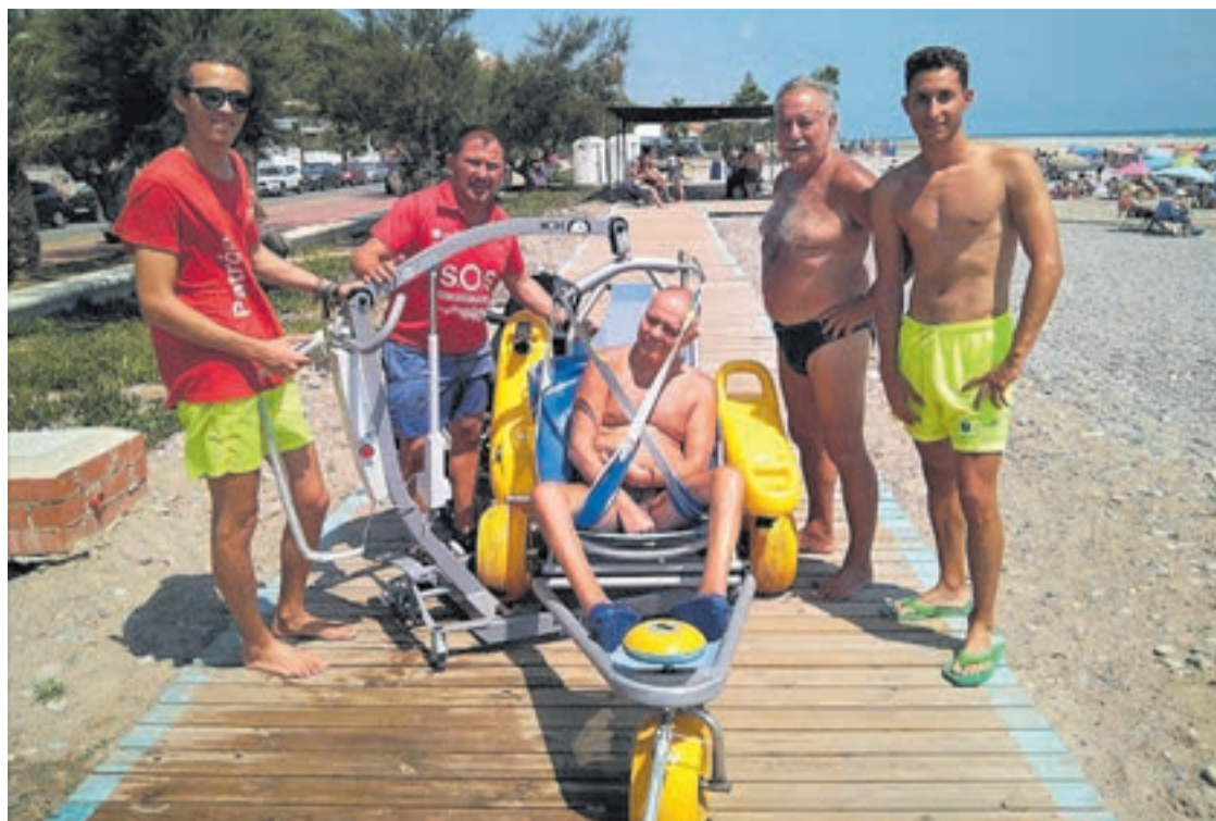
Durante el mes de agosto, los usuarios que han acudido a la playa ya han tenido la posibilidad de hacer uso de la grúa.