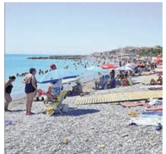
Pedra-roja, també ha rebut molta gent per banyarse.

no té molta llargaria. Després, les platges de Masbó, Grao i Pedra-roja, compten amb centre de coordinació i entre les tres es reparteixen la infraestructura nàutica i terrestre, que en qual-