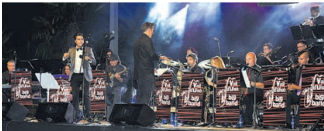
La Vall d'Uixó Big Band ofreció un gran espectáculo musical, que arrancó el aplauso entusiasta de los asistentes.