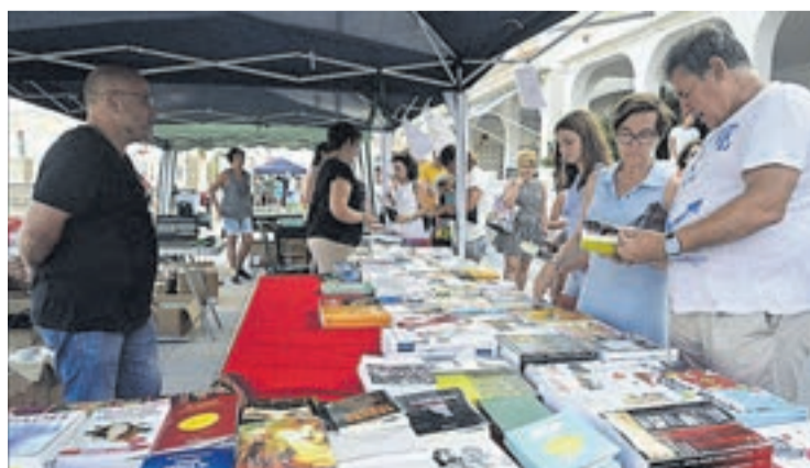
Los asistentes a la cita cultural conocieron las últimas novedades 'in situ'.