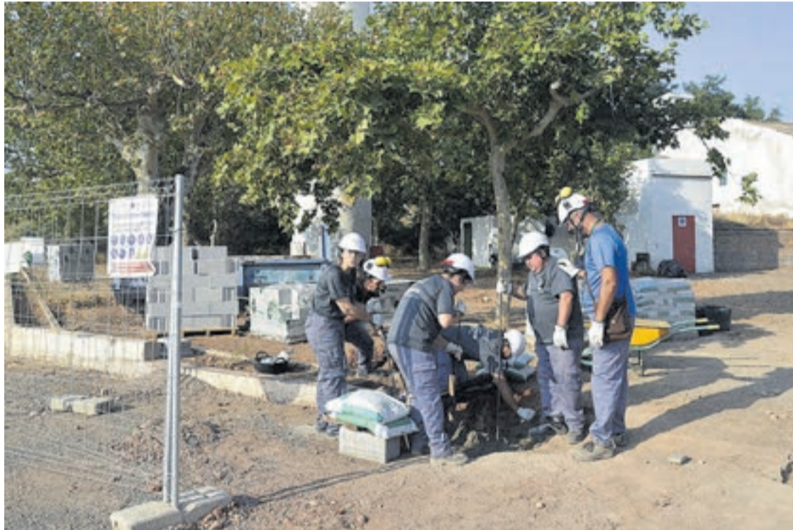
Los alumnos del taller de empleo para personas inclusivas llevan a cabo las labores de acondicionamiento de la zona.