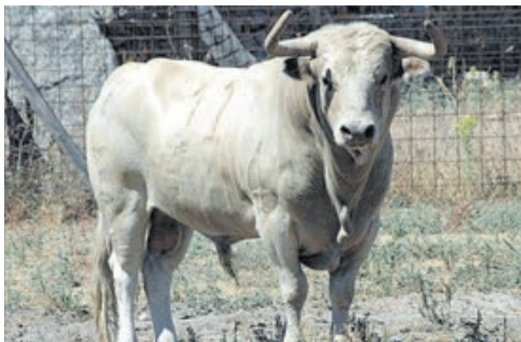
El dissabte 13 d'octubre, bou 'Generoso' de Tomás y Pilar Entero.

Durant tota la setmana de festes s'exhibiran sis bous, tres de la comissió i tres de les penyes taurines