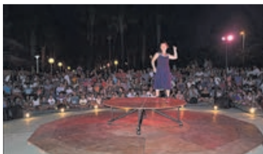
Flou Papagayo puso una nota muy especial a la velada.